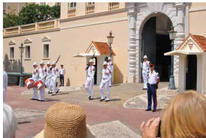
Zmiana warty przed Pałacem Księżęcym Grimaldich

Od września do czerwca „Les Petits Chanteurs de Monaco” i chórzyci Katedralnej Szkoły Chóralnej śpiewają podczas mszy świętej w każdą niedzielę o 10:00. Msza jest również odprawiana każdego roku 6 grudnia, kiedy głównie dzieci gromadzą się na radosnym wspomnieniu życia świętego Mikołaja .