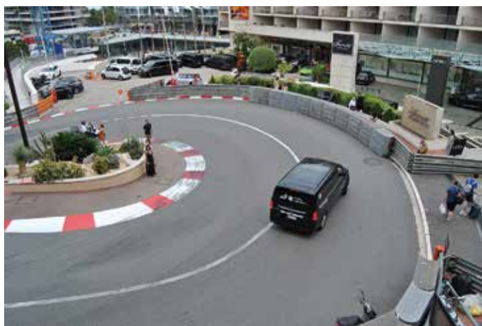
Jeden z zakrętów rajdu po ulicach Monte Carlo

Rozstanie Kelly z kinem szczególnie oplakiwał Alfred Hitchcock, który zdążył zaangażować ją do trzech swoich produkcji. Jednak księżna nigdy się nie skarżyła, a swoje nowe obowiązki wypełniała z pasją. „Owszem, kochałam grać”, wyznała w jednym z wywiadów. „Jednak rola hollywoodzkiej gwiazdy nigdy nie sprawiała mi przyjemności”. Księżna Grace z Monako zmarła 14 września 1982 r., w skutek tragicznego wypadku. Prowadziła samochód, gdy doznała ataku apopleksji. Straciła panowanie nad pojazdem i zjechała w przepaść. W aucie była też jej córka, księżniczka Stefania, która odniosła tylko lekkie obrażenia. Później, przez dekady spekulowano, że faktyczną przyczyną wypadku była ostra kłótnia, w jaką siedemnastolatka wdała się z matką. W momencie śmierci Grace Kelly miała 52 lata. Po niespodziewanej śmierci księżnej Monako książę Rainier się załamał. Nigdy więcej się nie ożenił. Zmarł w 2005 r., w wieku 81 lat. Został pochowany obok swojej żony w Katedrze św. Mikołaja w Monte Carlo.