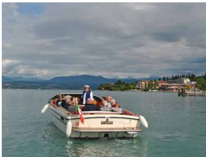
Rejs po jeziorze Garda

Kolejny dzień przyniósł nowe doznania, udaliśmy się nad Jezioro Garda , największe i najpopularniejsze jezioro włoskie, gdzie czekał na nas rejs łódką i spacer po malowniczej starówce.