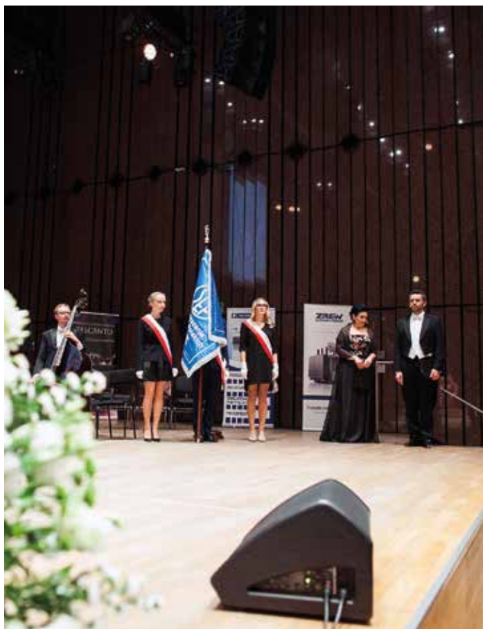
Sala koncertowa Filharmonii Łódzkiej – Jubileusz 100-lecia Oddziału Łódzkiego SEP.