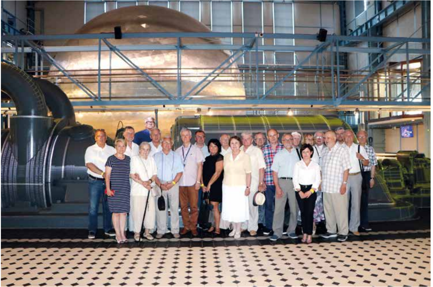
Uczestnicy uroczystości odsłonięcia tablicy pamiątkowej w EC1 przed turbozespołem