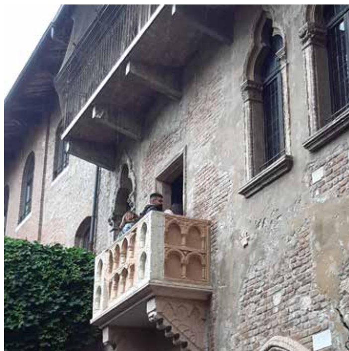
Balkon Julii w Weronie

Udaliśmy się także na spacer zatłoczoną Via Mazzini. Ta reprezentacyjna, zamknięta dla ruchu samochodowego ulica, łączy dwa najważniejsze miejskie place. Z Piazza Brà można nią dojść do Piazza della Erbe, a także w bliskie okolice domu Julii, do którego zawitaliśmy niebawem.