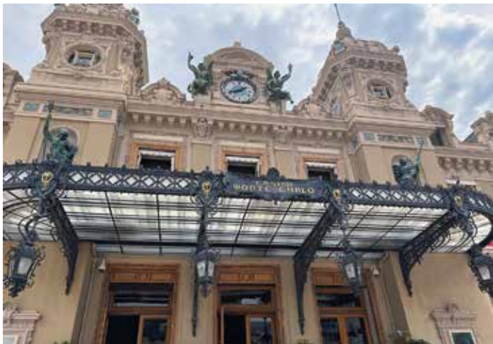
Kasyno w Monte Carlo

Hrabstwo Nicei graniczące od północy i zachodu z włościami rodu. Francja uznała Monako za niezależne terytorium w 1489 r., zaś Genua podjęła w 1509 r. ostatnią, nieudaną próbę zajęcia go.