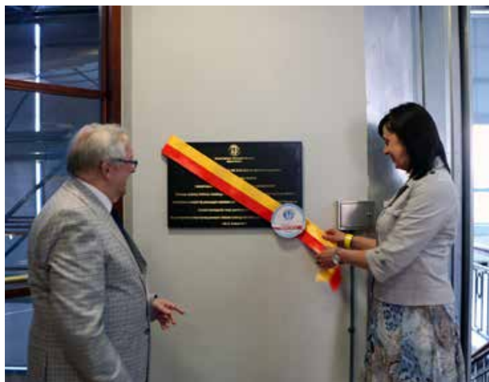
Odsłonięcie tablicy pamiątkowej w EC1

Kiedy w październiku 2019 roku w sali koncertowej Filharmonii Łódzkiej Oddział świętował jubileusz 100-lecia, wówczas nikt nie przypuszczał, że za kilka miesięcy zostanie poddany poważnej próbie – pandemii. Próbie, z której Oddział Łódzki wyszedł obronną ręką dzięki zaangażowaniu i poczuciu odpowiedzialności ówczesnych prezesów Oddziału, którzy pomimo wszechobecnego strachu, niepokoju i lęku o zdrowie swoje i najbliższych, troszczyli się o dobro Oddziału. Biuro Oddziału nie zostało zamknięte nawet na jeden dzień, ponieważ wiedzieliśmy, jakie to może mieć nieodwracalne konsekwencje dla działalności gospodarczej Oddziału, dzięki której może on funkcjonować. Przypomnijmy, nie otrzymujemy żadnych dotacji, darowizn czy grantów. Robiliśmy wszystko, aby Oddział Łódzki SEP zachował ludzką twarz, a nie twarz ekranu monitora. Bo nie jest sztuką być wtedy, kiedy jest miło i pięknie, ale wtedy, kiedy jest najtrudniej. Wtedy jest to prawdziwe wyzwanie. Być, działać i pomagać w czasach zarazy.