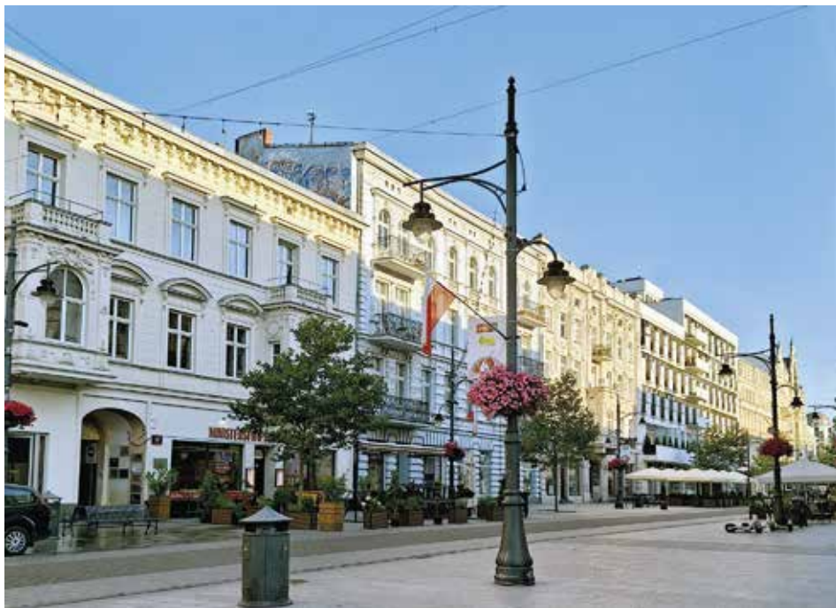
Łódź, ul. Piotrkowska