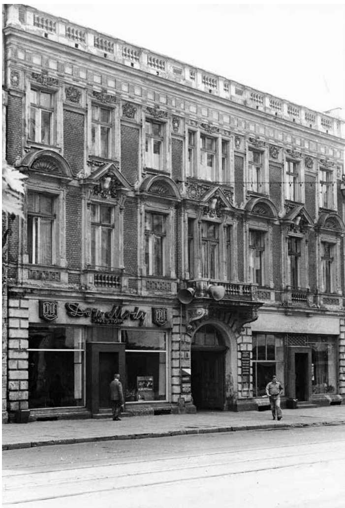
Siedziba OŁ SEP do wybuchu II wojny światowej oraz w latach 1948 – 1966; Łódź, ul. Piotrkowska 102

Podczas 105-letniej historii Oddziału wydano wiele publikacji książkowych opisujących historię i bieżącą działalność Oddziału.