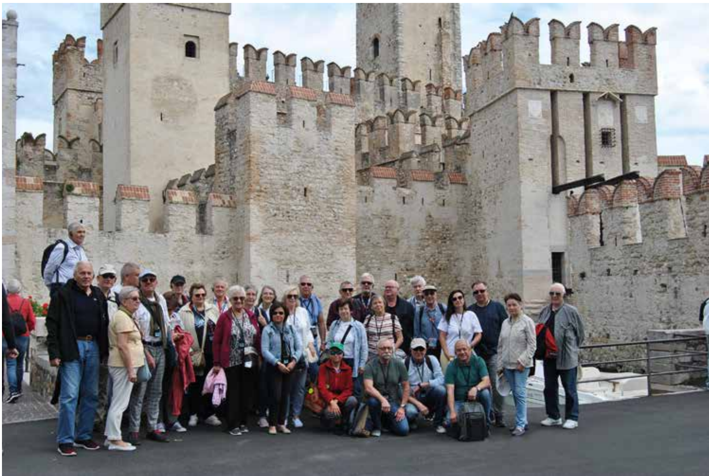
Uczestnicy seminarium o murach obronnych w Lazise

Werona była zamieszkała już w czasach prehistorycznych. Powstały wtedy niektóre osiedla na wzgórzu Świętego Piotra, które góruje nad rzeką Adygą. Do dziś toczą się dyskusje nad tym, która populacja rozpoczęła zasiedlanie regionu. Najszerszej uznana hipoteza zakłada, że zasiedlenie rozpoczął lud Retów. Podziela ją rzymski pisarz Pliniusz Starszy. Natomiast Tytus Liwiusz twierdzi, że inicjatorami byli Cenomanowie. Inne hipotezy mówią o pochodzeniu etruskim (na tym terenie odnotowano obecność Arsunati, ludu o nieznanym pochodzeniu, który przez niektórych jest zaliczany do Etrusków). Wreszcie hipoteza adriatycko-wenecka zakłada, że miasto zostało wzniesione przez populację lokalną Euganejczyków. Około roku 390 p.n.e. Werona została zdobyta lub założona na nowo przez Celtów. Wzniesieniem kolonii rzymskiej w meandrze Adygi (89 r. p.n.e.) zapoczątkowano okres wielkiego rozwoju miasta. Z małego i niewielkiego osadnictwa Rzymianie uczynili dzieło sztuki, budując wielkie pomniki, które możemy podziwiać jeszcze dziś. Miasto było szczególnie wykorzystywane w III wieku n.e. jako baza wojsk w bitwach przeciwko barbarzyńcom. Wówczas miasto zostało wzmocnione przez cesarza Galiena, który poszerzył miejskie mury.