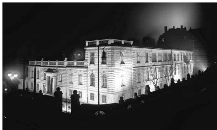
Elektrownia Łódzka, budynek dyrekcji od ulicy Przejazd (obecnie Tuwima).

W historię Oddziału wpisują się kolejne wydarzenia odbywające się cyklicznie, ale także nowe przedsięwzięcia podejmowane przez Oddział Łódzki SEP, który w swej działalności stale szuka ciekawych rozwiązań, aby z powodzeniem pełnić misję popularyzatora wiedzy z zakresu szeroko rozumianej elektryki. Oddział wypełnia swoje zobowiązania statutowe wobec społeczeństwa Łodzi i województwa, współpracuje z łódzkimi uczelniami wyższymi i szkołami średnimi, uczestniczy w organizowanych na terenie miasta imprezach, mających na celu zapoznanie społeczeństwa z najnowszymi osiągnięciami techniki. Prowadzi liczne kursy i szkolenia z zakresu elektroenergetyki, elektrotechniki, elektroniki, telekomunikacji i informatyki oraz wdrażania postępu technicznego. Działalność Oddziału służy również integracji środowiska elektryków.