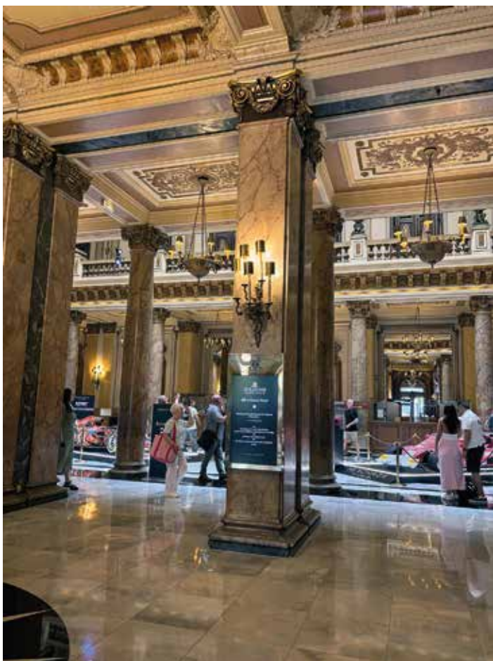
Wnętrze kasyna w Monte Carlo

W 1524 r. niepodległość Monako została uznana de jure przez Cesarza Karola V. Monako do 1641 r. będzie pod protektoratem Królestwa Hiszpanii. W tym czasie Honoriusz II uzyskał tytuł księcia, uznany przez Hiszpanię w 1633 r. Ze względu na konflikty ze swoim protektorem, Honoriusz II podpisał 14 września 1641 r. traktat z Francją, dzięki któremu udało mu się wypędzić garnizon hiszpański i nabyć nowe tytuły szlacheckie. Księstwo prosperowało głównie dzięki uprawie cytryn w Menton. W 1793 r. rewolucyjna Francja zajęła księstwo, zmieniając nazwę miasta na Skale Monakijskiej na „Fort Herkulesa” (fr. Fort d'Hercule ). W wyniku