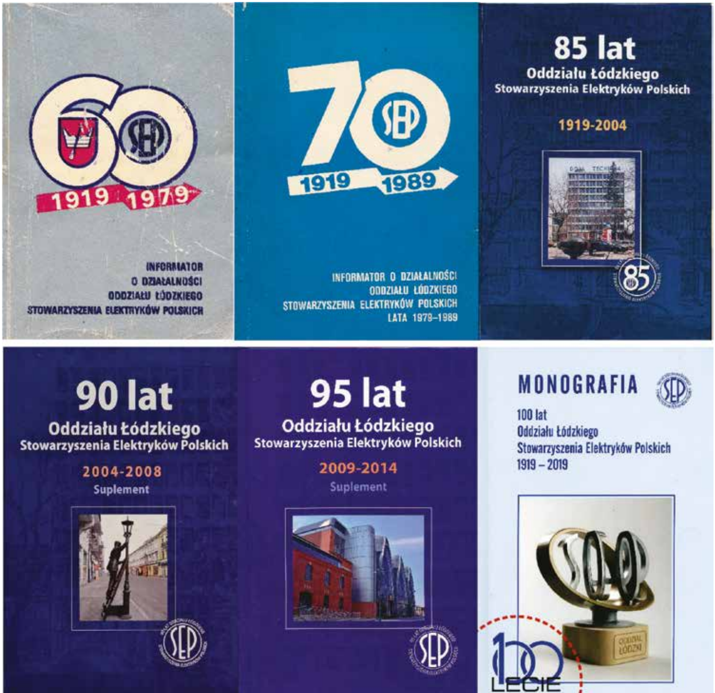
Publikacje książkowe wydane przez Oddział Łódzki SEP

numer ukazał się w grudniu 2023 roku, a który pełni niejako rolę kroniki i jest jednym ze sposobów docierania z informacją stowarzyszeniową do naszych członków, klientów, sympatyków i do innych Oddziałów. Pierwszy numer wydano w czerwcu 1997 roku. Tworzą go ludzie z pasją i zaangażowaniem, sumiennie przygotowując każdy kolejny numer. To jest właściwie praca ciągła, ponieważ zamykając jeden numer już myślimy o kolejnym.