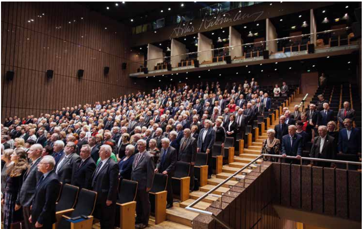
Sala koncertowa Filharmonii Łódzkiej – Jubileusz 100-lecia Oddziału Łódzkiego SEP.