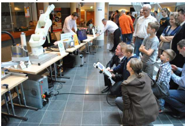
Fot. 2. Warsztaty prowadzą specjaliści z firmy ASTOR.

Zawodnicy rywalizowali w 11 konkurencjach o dość tajemniczych nazwach: Nanosumo, Microsumo, Minisumo, Sumo, Minisumo Deathmatch, Line Follower Enhanced, Line Follower Amator, Line Follower Professional, Freestyle, Micromouse oraz Lego SUMO - co sklasyfikowało zawody w ścisłej ogólnopolskiej czołówce pod względem atrakcyjności. Uczestniczyły reprezentacje politechnik: Wrocławskiej, Opolskiej, Krakowskiej, Gdańskiej, Rzeszowskiej, Akademii Górniczo-Hutniczej oraz z politechniki z Koszyc