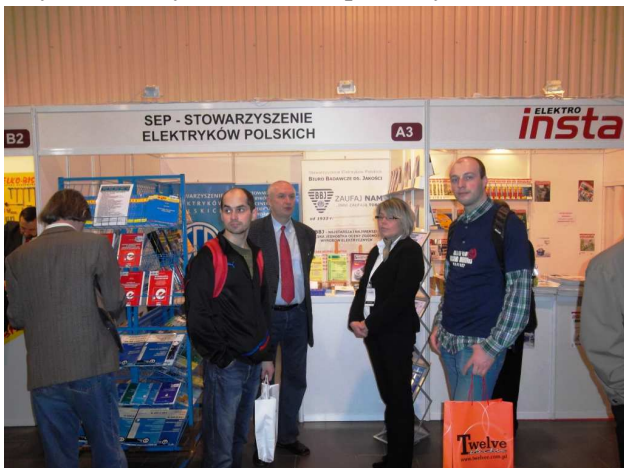
Fot. 1. Stoisko SEP na targach.

Zakończyły się trwające od 12 marca 2012 roku warszawskie targi „Światło 2012”. Jak wiadomo były to odbywające się równolegle trzy imprezy wystawiennicze: XX Międzynarodowe Targi Sprzętu Oświetleniowego ŚWIATŁO 2012, X Międzynarodowe Targi Sprzętu Elektrycznego i Systemów Zabezpieczeń ELEKTROTECHNIKA 2012 i IV Międzynarodowe Targi Czystej Energii CENERG 2012. Czynne było stoisko Stowarzyszenia Elektryków Polskich obsługiwane przez Biuro Badawcze ds. Jakości SEP i Centralny Ośrodek Szkolenia i Wydawnictw SEP (fot. 1). Według zgodnej opinii zwiedzających i wystawców była to udana impreza wystawiennicza.