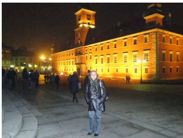
Fot. 1. Wycieczka po Warszawie.