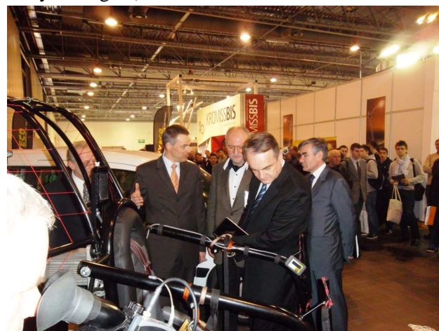
Fot. 2. Wystawę samochodów elektrycznych zwiedza wicepremier Waldemar Pawlak.

nictw SEP. Targi cieszą się dużym zainteresowaniem i już od pierwszego dnia odnotowano rekordową liczbę zwiedzających. Targi odwiedził również Wicepremier i Minister Gospodarki Waldemar Pawlak, który otworzył pokaz pojazdów elektrycznych i ekologicznych towarzyszący Targom (Ministerstwo Gospodarki jest Głównym Patronem Honorowym Targów).