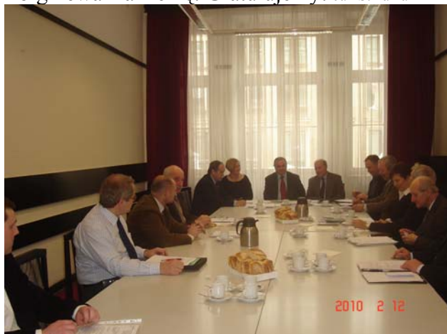
Fot.17 Uczestnicy zebrania Polskiego Komitetu Jakości i Efektywnego Wykorzystania Energii Elektrycznej SEP.