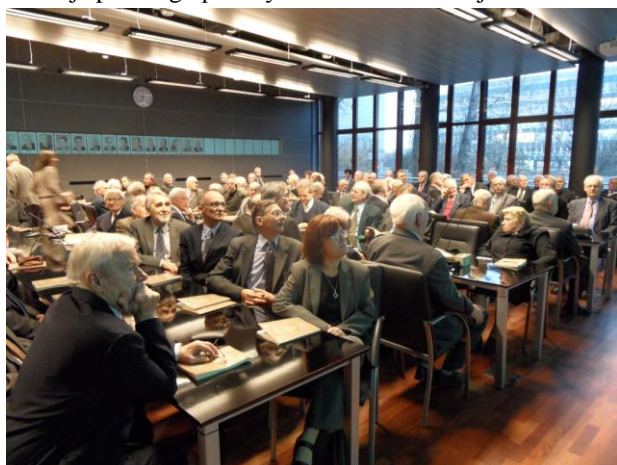
Fot. 2. Uczestnicy konferencji licznie przybyli na obrady.

Głównymi celami konferencji były: uczczenie pamięci Profesora - wybitnego naukowca, wielkiego patrioty i obywatela, wykazanie fundamentalnej roli profesora w rozwoju polskiej i światowej myśli technicznej XX wieku, przekazanie młodemu pokoleniu idei pracy naukowo-dydaktycznej Profesora, zaprezentowanie Jego zasług dla rozwoju polskiego przemysłu i obronności kraju.