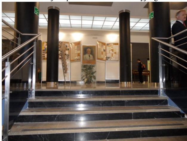
Fot. 1. Wejście na konferencję. fot. Bogusław Muszyński

Konferencja odbyła się w dniu 16.11. br. z inicjatywy Koła Seniorów Oddziału EIT SEP w Warszawie - na Wydziale Elektroniki i Technik Informatycznych Politechniki Warszawskiej - w ramach tegorocznych obchodów Światowego Dnia Telekomunikacji i Społeczeństwa Informatycznego”.