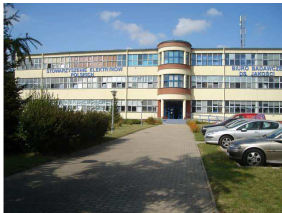
Fot. 5. Budynek BBJ SEP Oddziału Lubelskiego w pełnej okazałości

Znak Przepisowy stał się znakiem obowiązkowym dla 37. grup wyrobów elektrycznych. W 1962 r. SEP podpisało porozumienie z Polskim Komitetem Normalizacyjnym. Jedną z konsekwencji tego porozumienia była zmiana nazwy na Biuro Badawcze ds. Jakości. Teraz BBJ ma swoją siedzibę w Warszawie – Międzyzlesiu przy ul. Pożaryskiego, a od 1969 r. Oddział w Lublinie mieszczący się obecnie przy ul. Rapackiego. BBJ SEP zatrudnia łącznie w Warszawie i Lublinie około 60 osób.