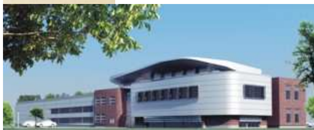
Fot. 8. Nowa siedziba firmy SONEL S.A. w Wałbrzyskiej Specjalnej Strefie Ekonomicznej w Świdnicy

Firma Sonel S.A. przeniosła ostatnio swą działalność do Wałbrzyskiej Specjalnej Strefy Ekono-