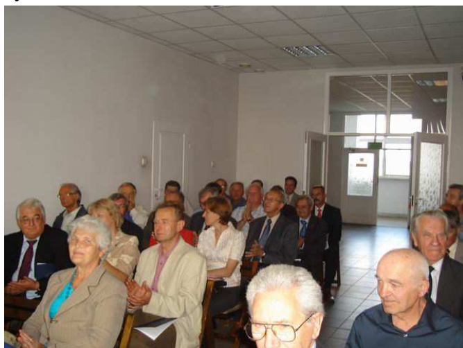
Fot. 4. Uczestnicy obchodów 75-lecia BBJ SEP w Lublinie, 2 września br.