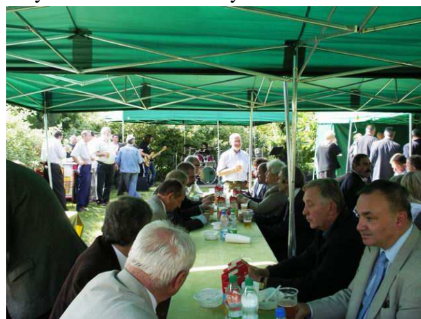
Fot. 6. Po części oficjalnej odbył się tradycyjny piknik. Pogoda dopisała