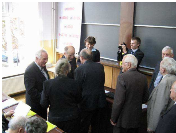
Fot. 2. Moment wręczania medali im. prof. Stanisława Szpora.

Kolejnym, nie mniej interesującym, blokiem tematycznym były referaty na temat aktualnych prac prowadzonych w poszczególnych ośrodkach akademickich i instytutach badawczych związanych z techniką wysokich napięć. W przerwie obrad uczestnicy mogli zwiedzić wystawę „Dorobek prof. S. Szpora”, gdzie zgromadzono setki zdjęć, dokumentów i eksponatów.