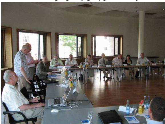
Fot. 7. Sala obrad