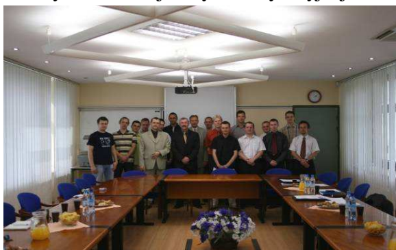
Fot. 8. Uczestnicy i gospodarze posiedzenia Studenckiej Rady Koordynacyjnej SEP