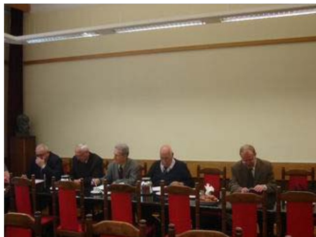
Fot. 2. Uczestnicy obrad Prezydium

dzie się 11 czerwca br. podczas obchodów Międzynarodowego Dnia Elektryki. Wyrażono sugestię, aby przewodniczący Centralnych Kolegiów Sekcji, Polskich Komitetów i Komitetów weszli w skład Komitetu Organizacyjnego Jubileuszu Obchodów 90-lecia SEP.