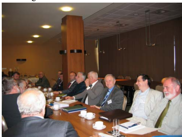
Fot. 3. Uczestnicy zebrania Rady Prezesów