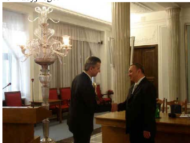
Fot. 19. Minister Infrastruktury, Cezary Grabarczyk wręcza prezesowi SEP specjalną statuetkę dla Stowarzyszenia Elektryków Polskich

Niespodziewanym, niezaplanowanym wydarzeniem było wręczenie przez Ministra Infrastruktury Statuetki dla Stowarzyszenia Elektryków Polskich za całokształt działań na rzecz rozwoju telekomunikacji i społeczeństwa informacyjnego.