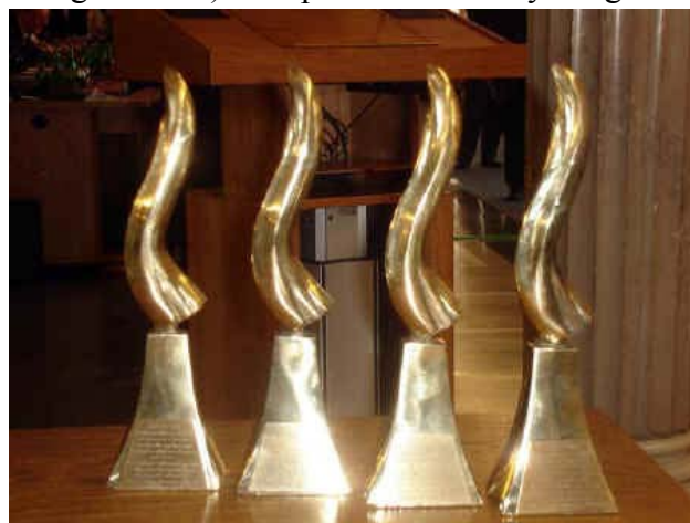
Fot. 18. Statuetki Ministra Infrastruktury

Przegładowi Telekomunikacyjnemu (najstarszemu naukowo-technicznemu miesięcznikowi telekomunikacyjnemu w Polsce), Politechnice Warszawskiej, Andrzejowi Wilkowi (inicjatorowi i współorganizatorowi corocznych obchodów ŚDTiSI) i firmie Corning Cable Systems Polska Sp. z o.o ze Strykowa wyróżnionej dyplomem Prezesa SEP podczas XIX Międzynarodowych Targów Komunikacji Elektronicznej INTERTELECOM 2008 w Łodzi. Statuetki wręczyli: Minister Infrastruktury Cezary Grabarczyk, prezes Anna Streżyńska (laureatka ubiegłoroczna) oraz prezes SEP Jerzy Barglik.