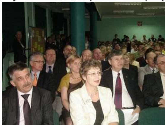
Fot. 11. Obchody ŚDTiSI w Technikum Łączności im. prof. Janusza Groszkowskiego