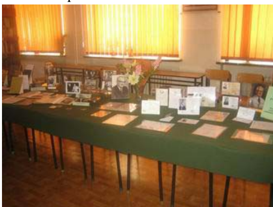
Fot. 12. Pamiątki po prof. Januszu Groszkowskim w Technikum Łączności