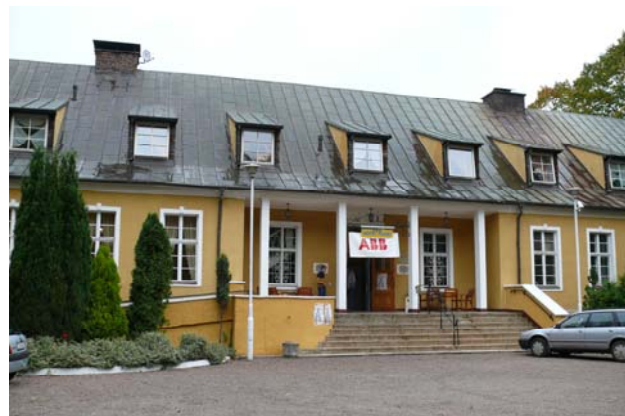
Fot.1 Hotel „Piaski”, w którym, przebywali uczestnicy ODME

Grazu: Manfreda Bürgera, Martina Kirchera i Thomasa Kerna.