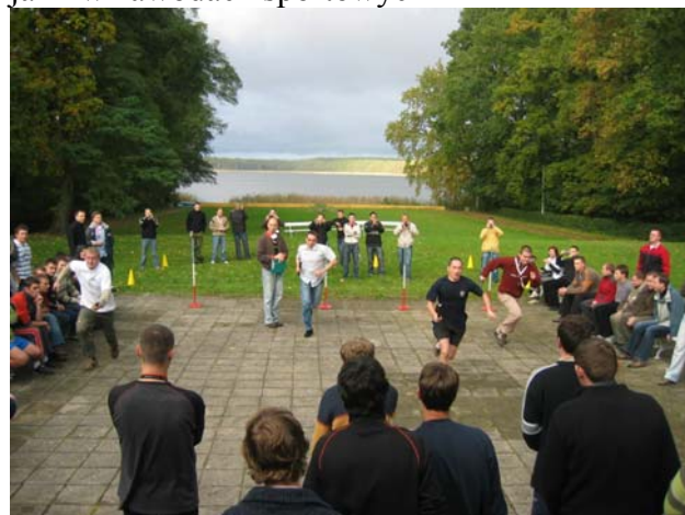
Fot.3 Zawody sportowe młody Austriak biegnie drugi od lewej w jasnej koszuli