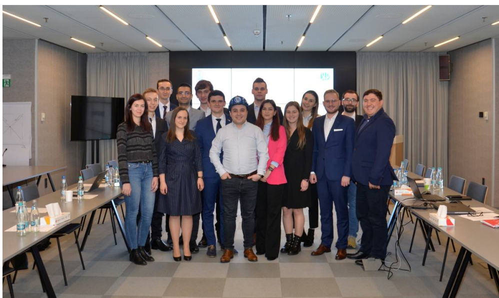
Wszyscy uczestnicy spotkania - młodzież rumuńska otrzymała od nas symboliczny kask SEP.

W ramach części turystycznej wyjazdu, w sobotę przed rozpoczęciem seminarium, uczestnicy zwiedzili Muzeum Wsi oraz Pałac Parlamentu. Pałac Parlamentu w Bukareszcie jest jedną z głównych atrakcji Rumunii i drugim największym budynkiem na świecie.