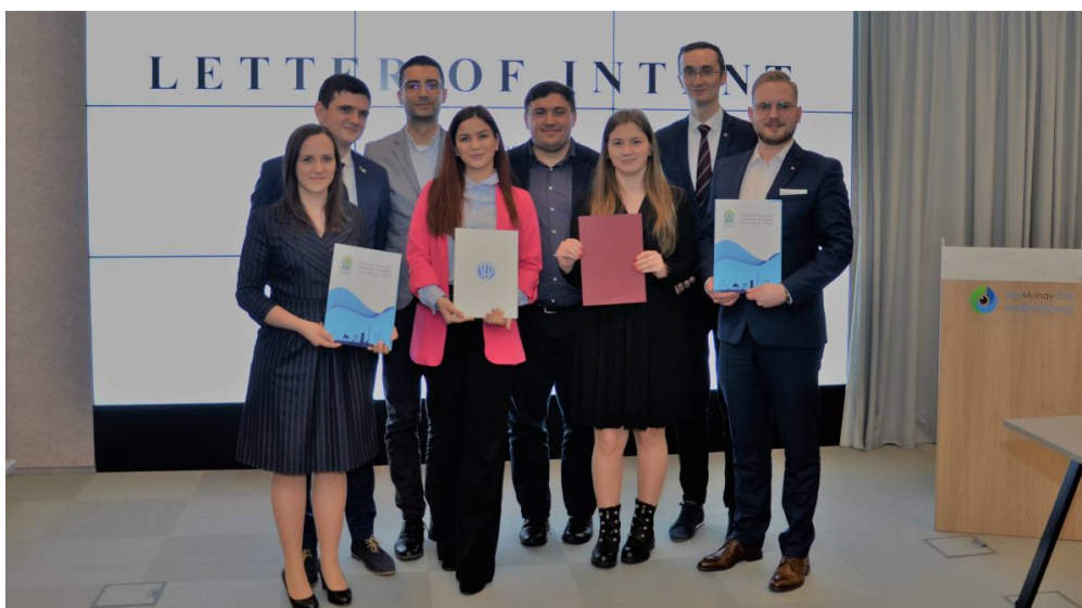
Po podpisaniu listu intencyjnego.