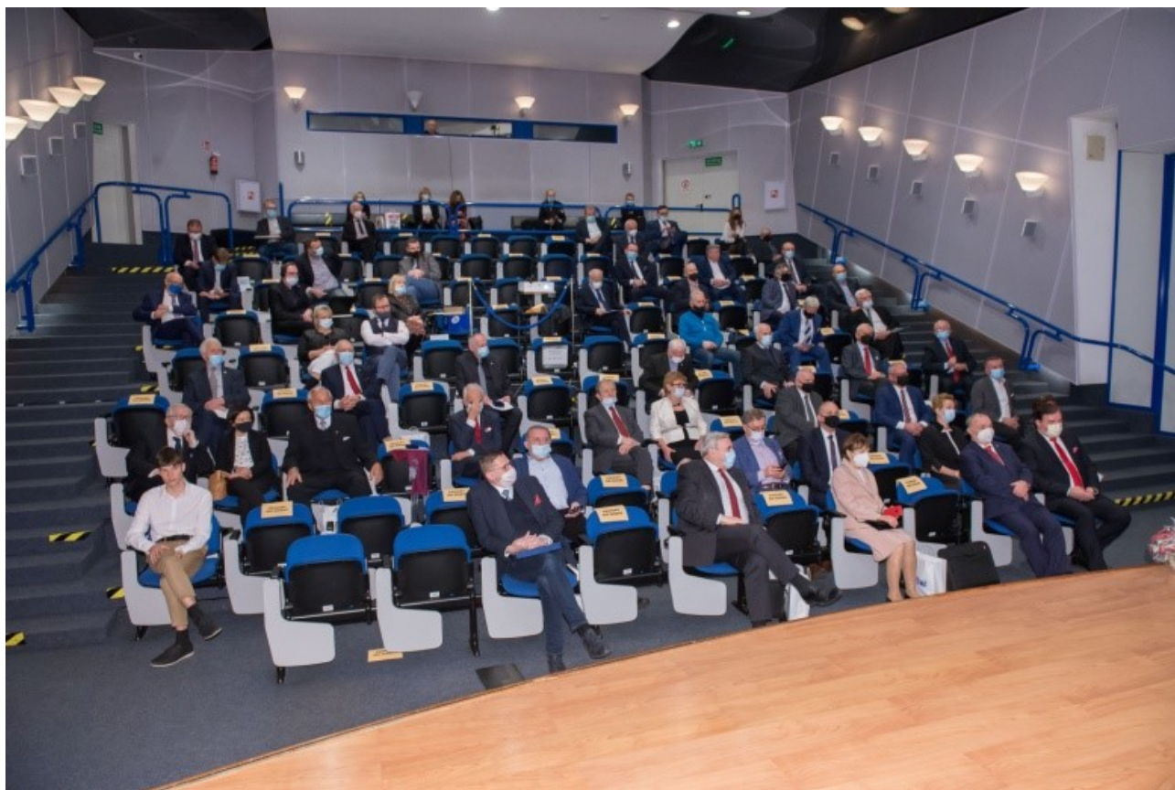
Fot. Widok ogólny Sali