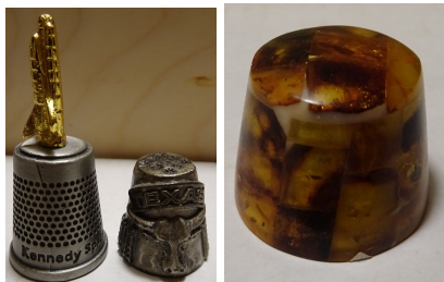
Zdj. 6. Okazy wykonane ze srebra oraz bursztynu