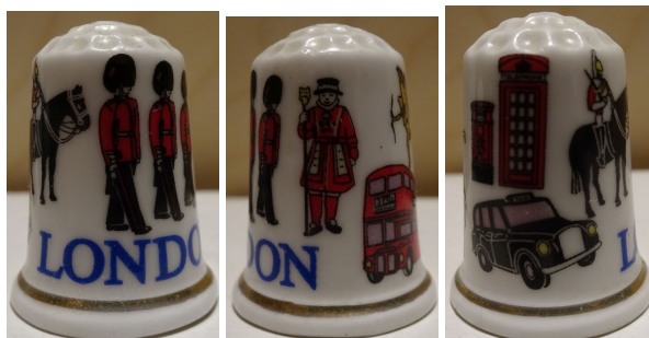
Zdj. 3. Naparstek nr 1 w kolekcji