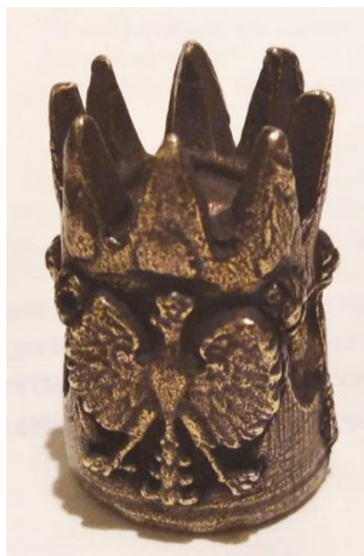
Zdj. 1. Jeden z okazów z numerem 827 w kolekcji Z. A. Kuczy

Pasja jest wyrazem zapożyczonym z łac. passio (cierpienie) i funkcjonuje w języku polskim od XVI wieku. Początkowo występowała tylko w znaczeniu religijnym jako ewangeliczny opis męki Chrystusa, następnie określała nabożeństwa wielkopostne oraz dzieła plastyczne (zwłaszcza krucyfiks zwany pasyjką). Znana jest również z nazewnictwa dzieł muzycznych. Począwszy od XVIII wieku, zapewne pod wpływem francuskiego passion, wyraz pasja zaczął funkcjonować w polszczyźnie ogólnej w znaczeniu „bardzo silne upodobanie do czegoś, zajmowanie się czymś z namiętnością”, np. pasja badawcza, pasja do podróżowania, pasja kolekcjonerska.