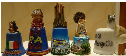
Zdj. 8. Zachwycają swoimi kolorami

JS: A najdalsza podróż i związane z nią trofea?