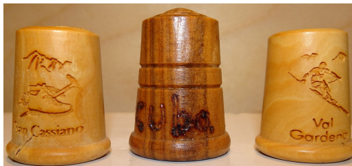
Zdj. 5. Naparstki wykonane z drewna