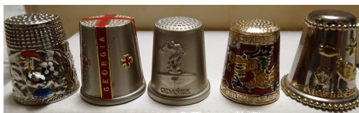
Zdj. 4. Naparstki metalowe

ZAK: Jak się okazało są nie tylko naparstki ceramiczne ale również metalowe, drewniane, srebrne, bursztynowe oraz kamionkowe. Mają również przeróżne kształty. Są naparstki w kształcie czajniczka, matrioski, kufla do piwa, wieży oraz przedstawiające np. sowę. Są też naparstki ozdobione różnymi motywami. Właściwie naparstki mogą zawierać każdy motyw - to od wyboru kolekcjonera zależy jakie okazy ma w swoich zbiorach. Ja zbieram naparstki, które są pamiątkami z podróży, więc na ogół mają umieszczoną nazwę miasta lub państwa.