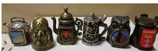
Zdj. 7. Niektóre naparstki zadziwiają swoim kształtem