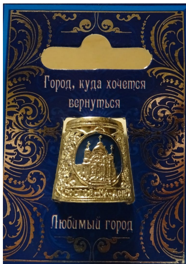
Zdj. 10. Naparstek z Sankt Petersburga

JS: A jak wyeksponować taką liczną kolekcję?