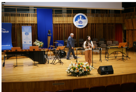
Przed rozpoczęciem uroczystości.

Czas wyznaczył nam rok 2021 jako rok Jubileuszu 100-lecia istnienia Oddziału Radomskiego Stowarzyszenia Elektryków Polskich. Stowarzyszenie Elektryków Polskich to jedna z najbardziej prężnych organizacji zawodowych w regionie. Należą do niej zarówno pracownicy firm z branży energetycznej, informatycznej i telekomunikacyjnej, ale też pracownicy Elektrowni Kozienice, zakładów energetycznych, pracownicy naukowcy Uniwersytetu Technologiczno-Humanistycznego oraz nauczyciele szkół branżowych.