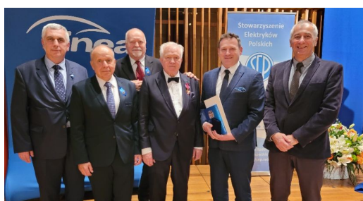
Odznaczeni Medalem Oddziału Radomskiego SEP członkowie Koła przy ENEA Wytwarzanie w towarzystwie prezesa O.R. SEP.