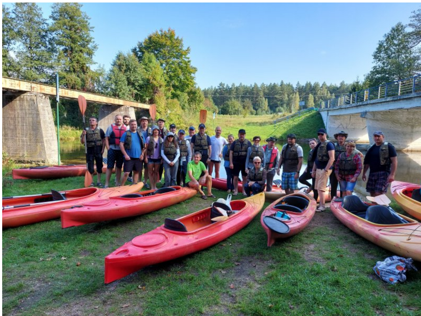
Uczestnicy spływu nad Czarną Hańczą