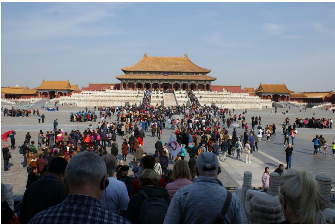
Jeden z dziedzińców Zakazanego Miasta w Pekinie