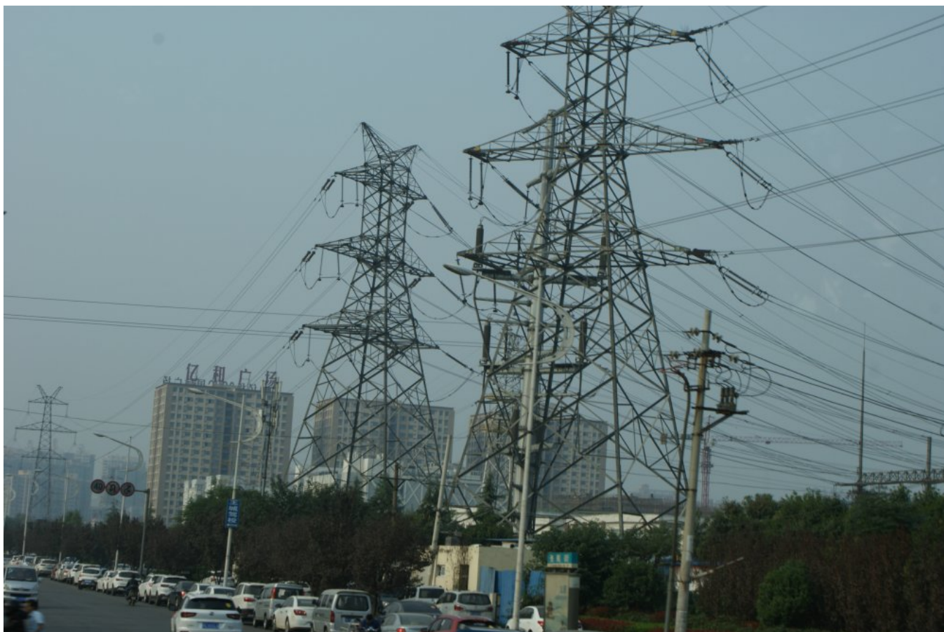
Linie przesyłowe WN