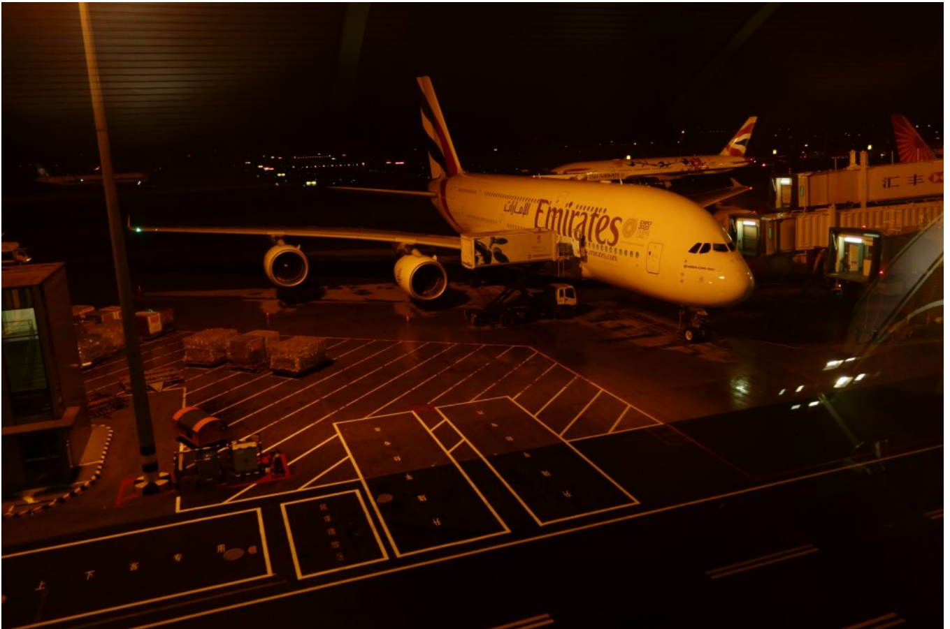
Takim A380 lecieliśmy do Pekinu