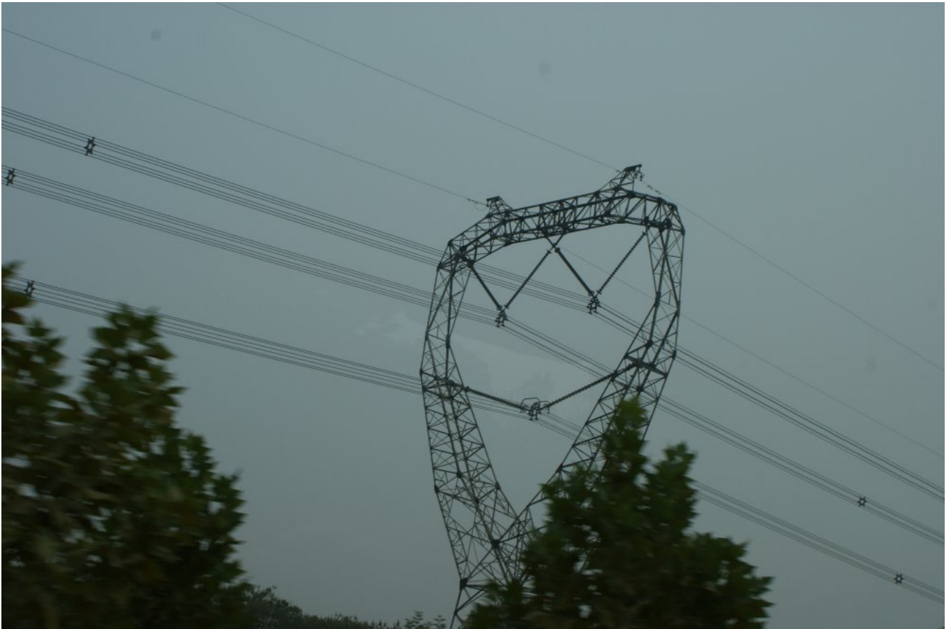
Linie przesyłowe NN