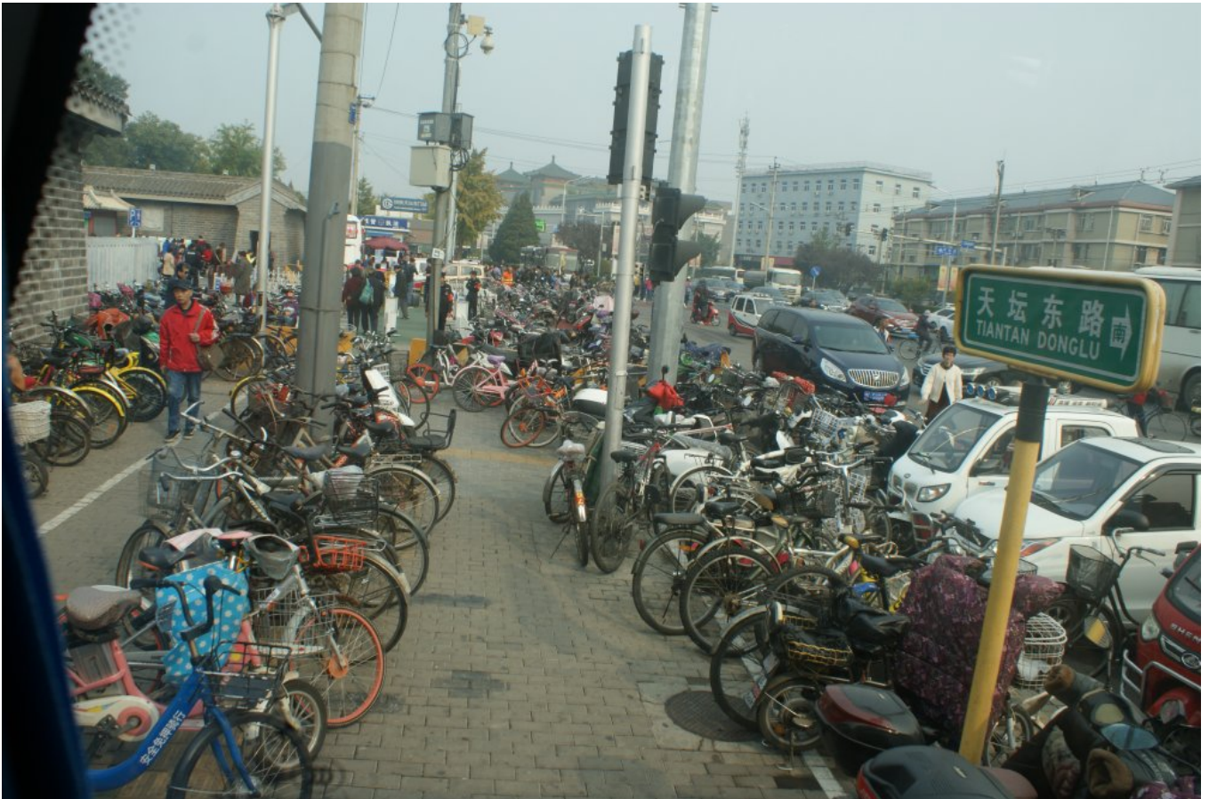
Ulica w Pekinie