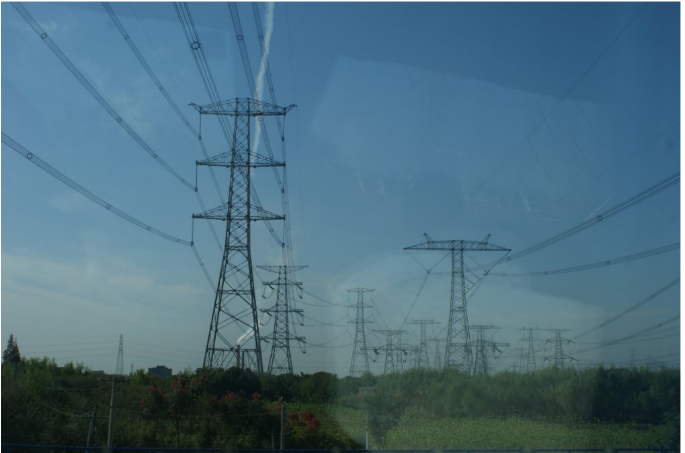
Linie przesyłowe NN