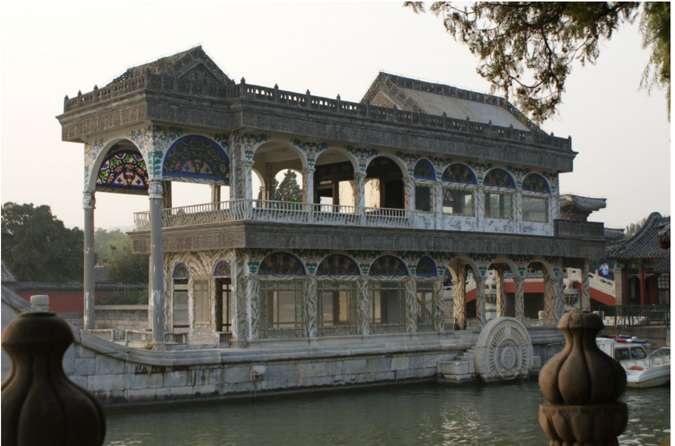
Marmurowa łódź na jeziorze Kunming