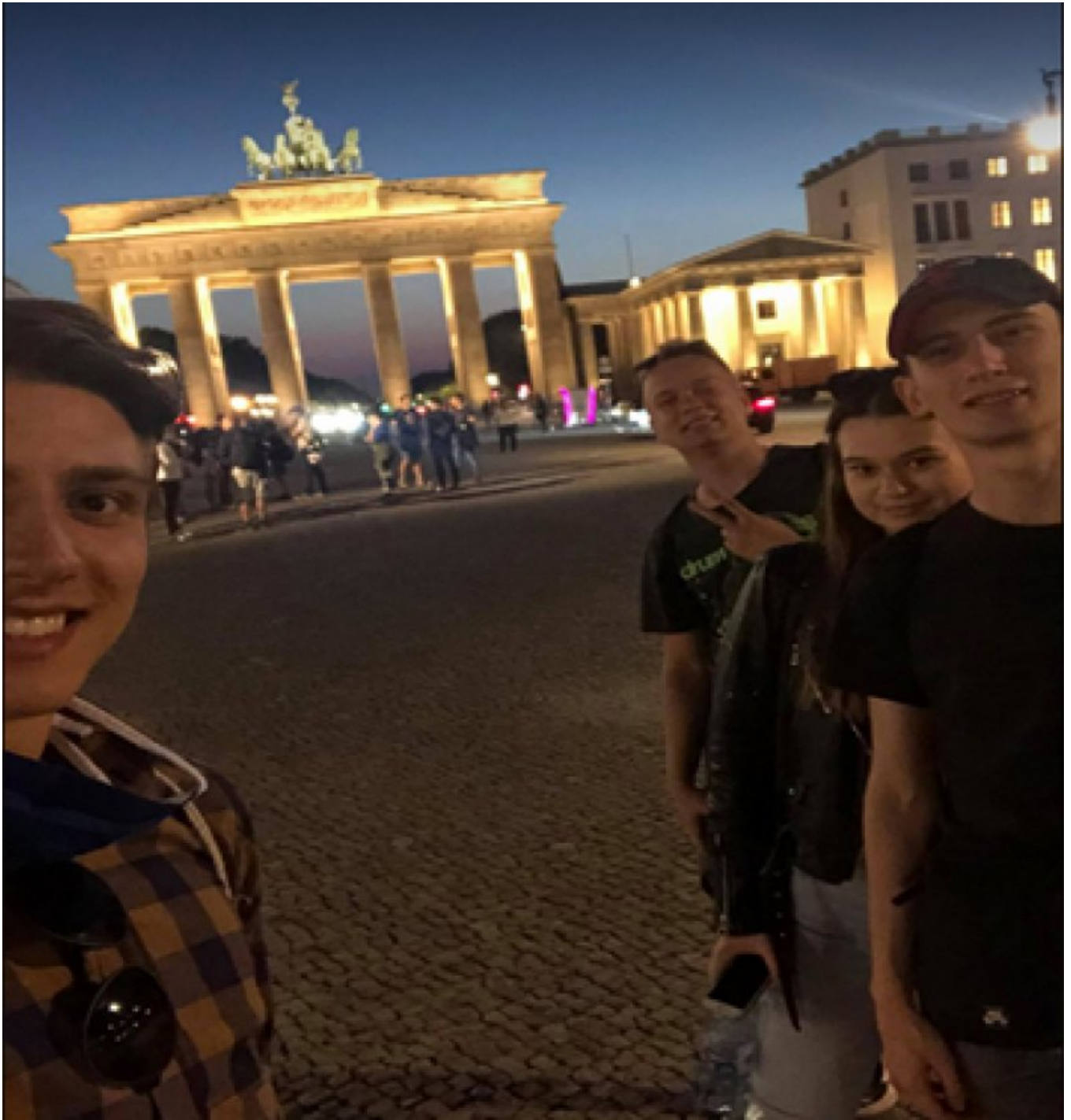
Zwiedzanie Berlina - Brama Brandenburska