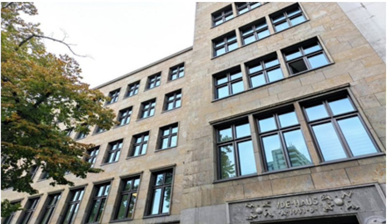
Fasada budynku Verband der Elektrotechnik (VDE).