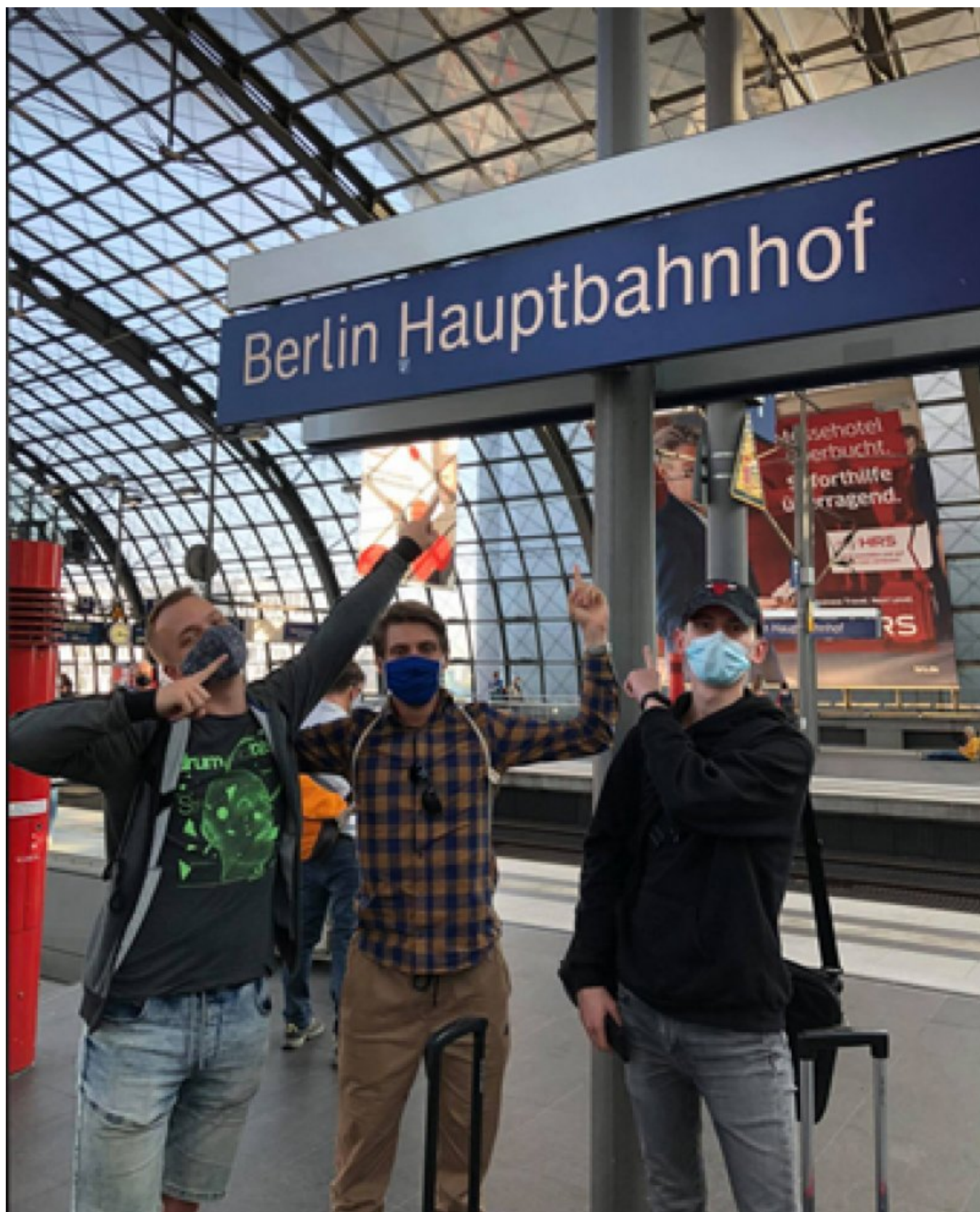
Przyjazd na dworzec Hauptbahnhof w Berlinie.