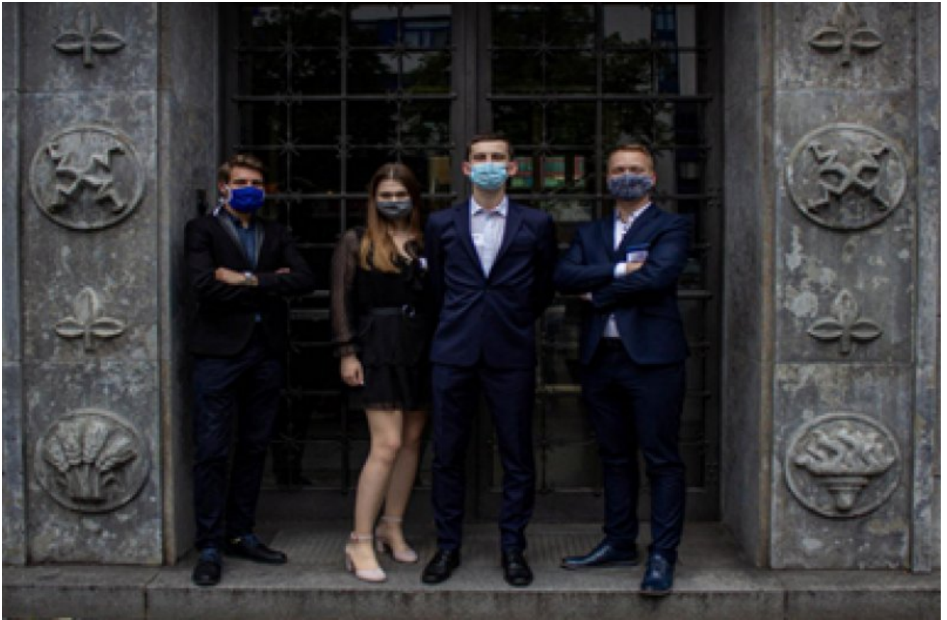
Drużyna reprezentująca SK SEP PG na finałach IMC w Berlinie.