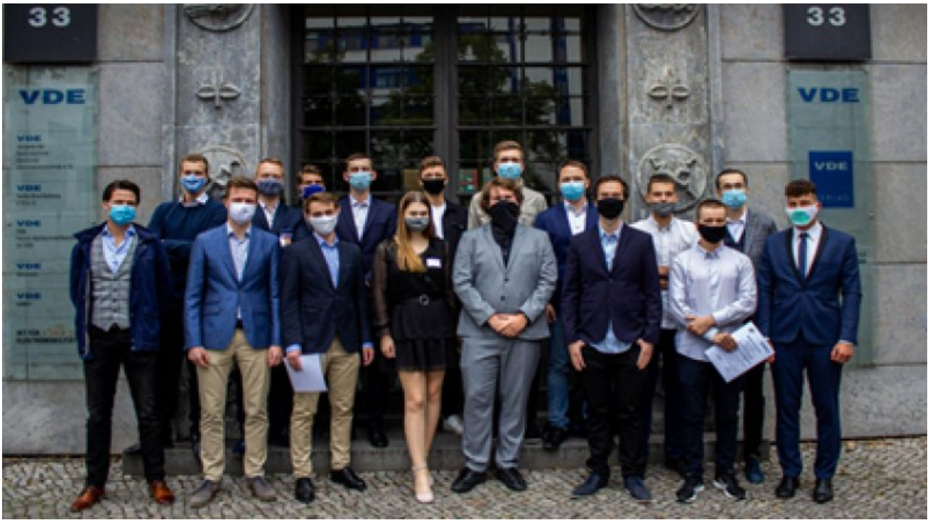
Finaliści EUREL International Management Cup przed siedzibą VDE.