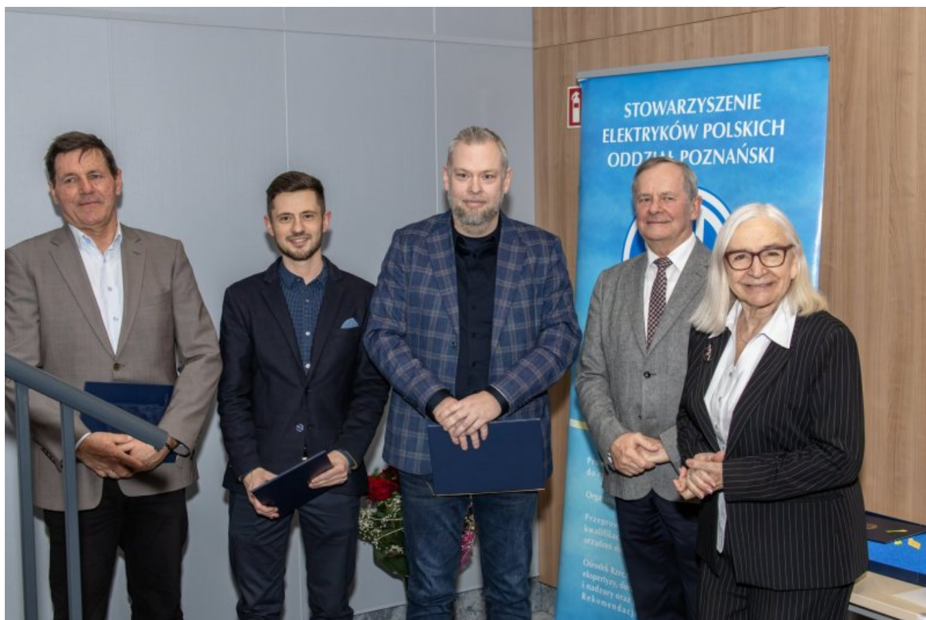
Wyróżnieni Medalem im. prof. Józefa Węglarza