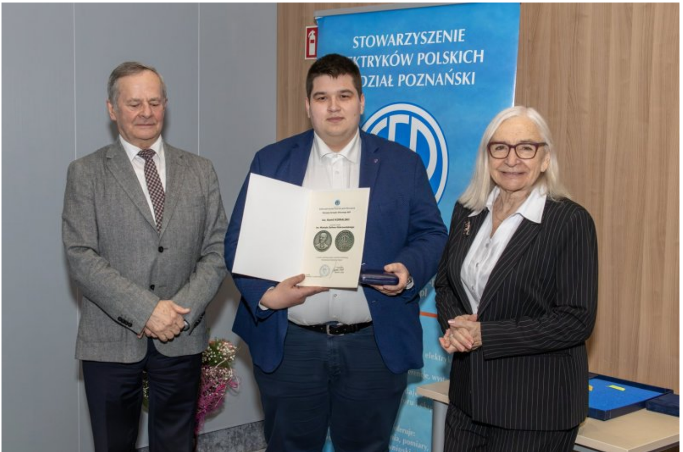
Wyróżniony Medalem im. Michała Doliwo-Dobrowolskiego