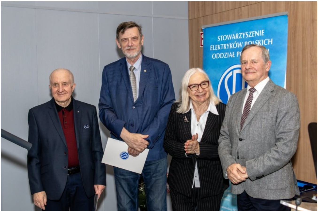
Wyróżnieni Godnością Zasłużonego Seniora SEP