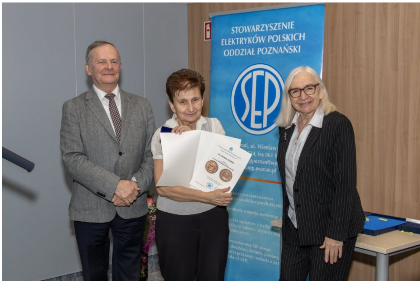
Wyróżniona Medalem im. prof. Mieczysława Pożaryskiego