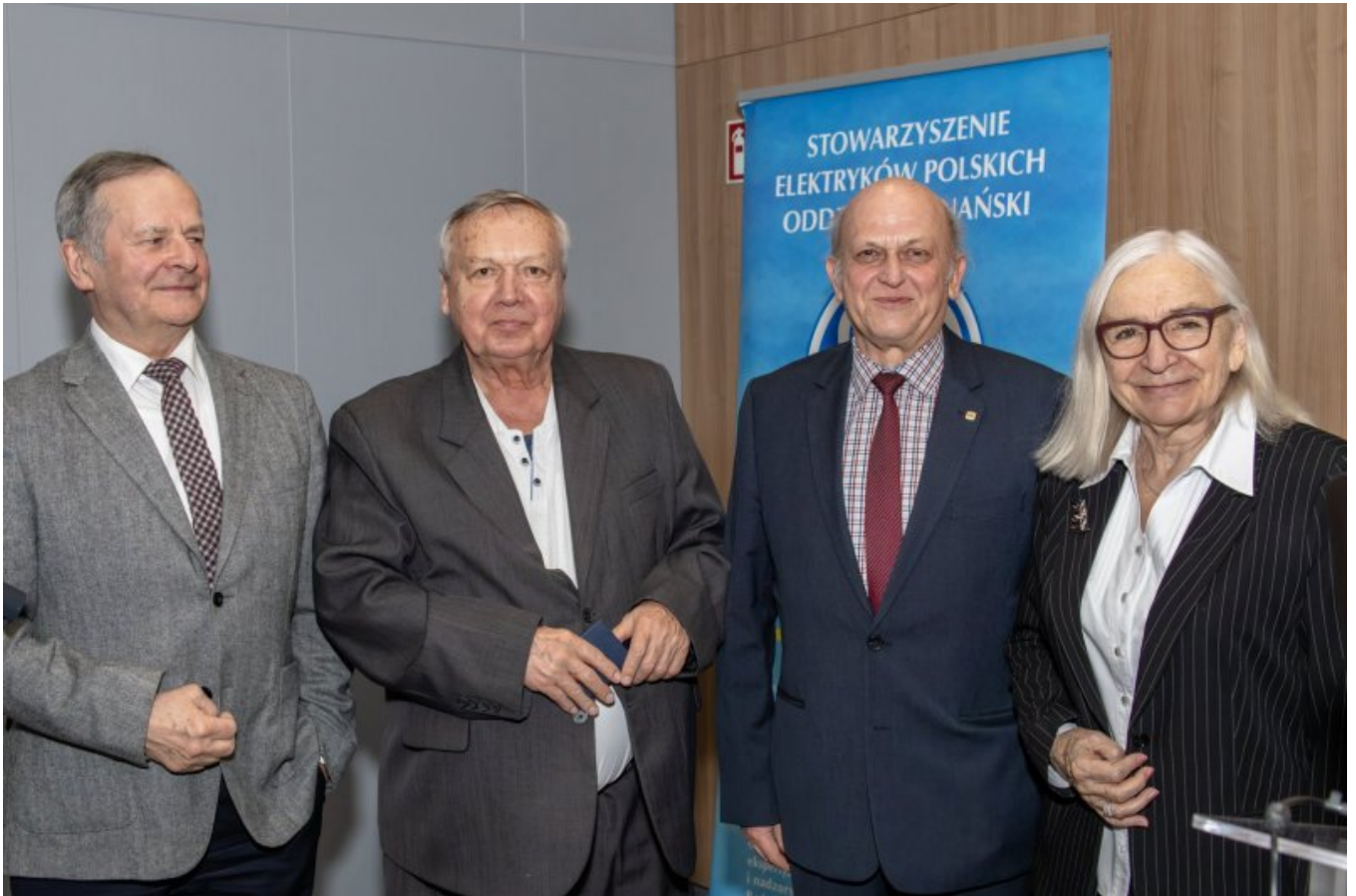
Odznaczeni Szafirową Odznaką Honorową SEP