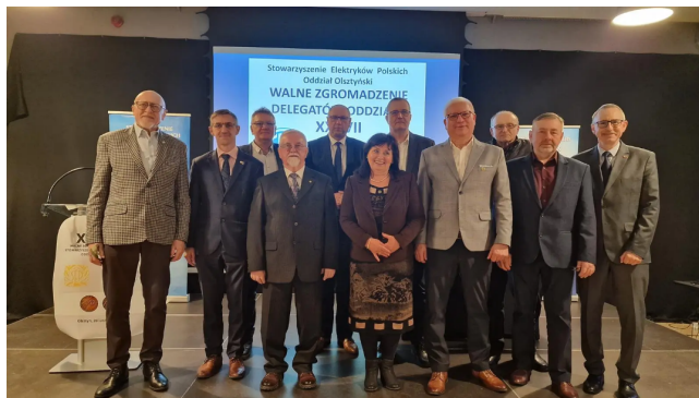
Zarząd Oddziału Olsztyńskiego SEP