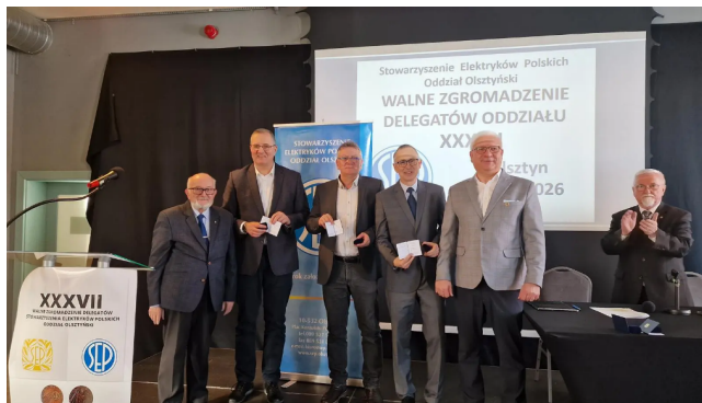
Wyróżnieni Szafirową Odznaką Honorową SEP