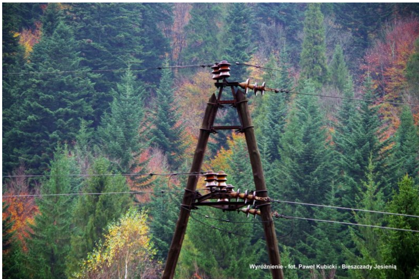
W - Kubicki Paweł - Bieszczady Jesienią