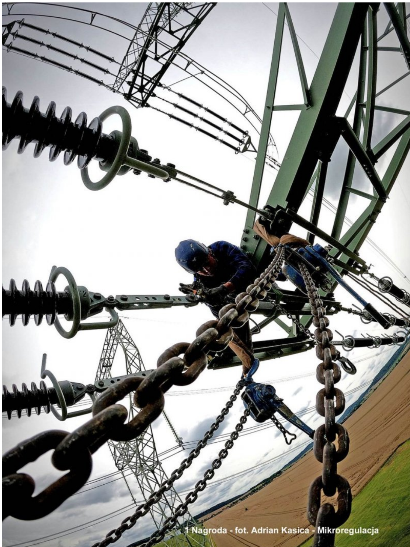
1 Nagroda - Mikroregulacja