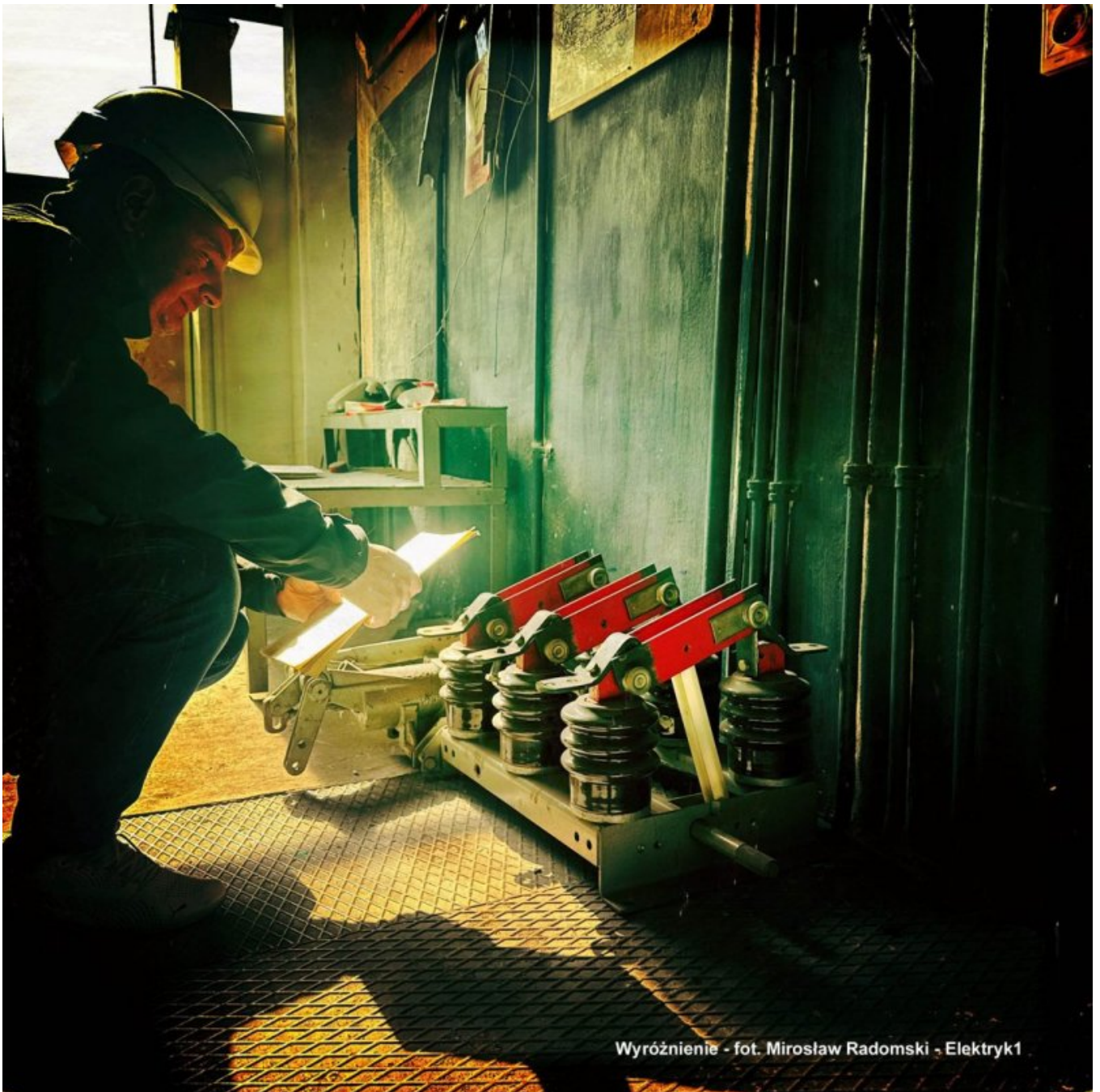
W - Radomski Mirosław - Elektryk1