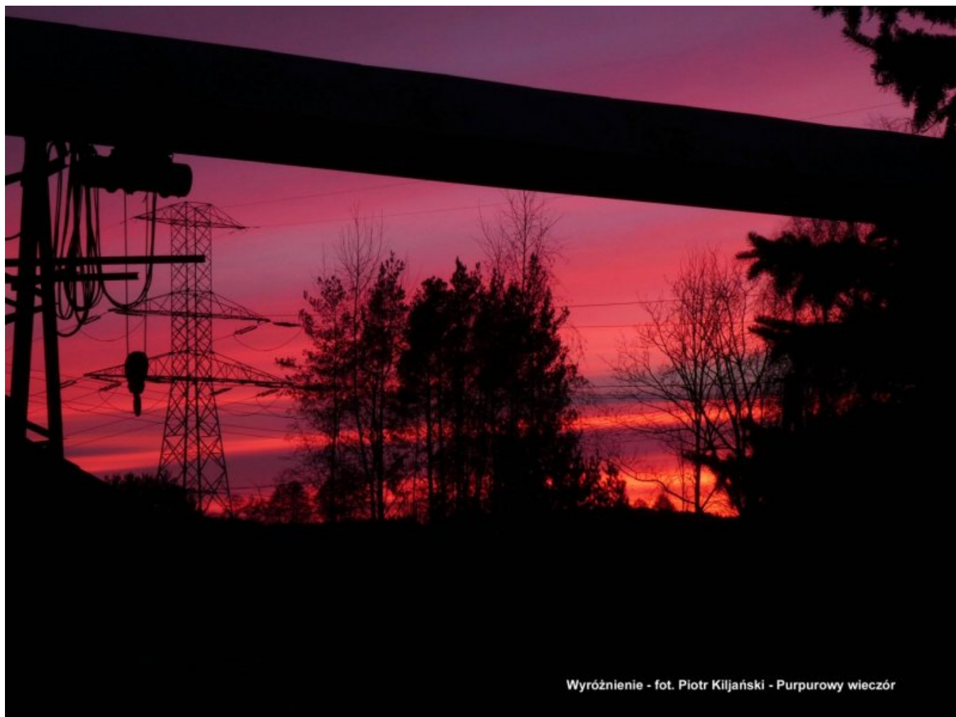
W - Kiljański Piotr - Purpurowy wieczer