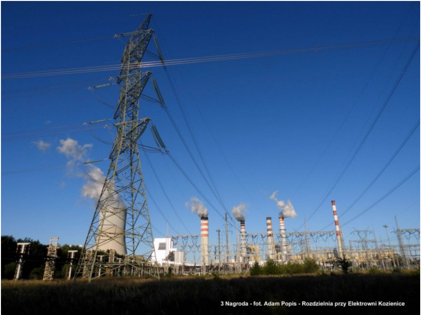
3 Nagroda - Rozdzielnia przy Elektrowni Kozienice