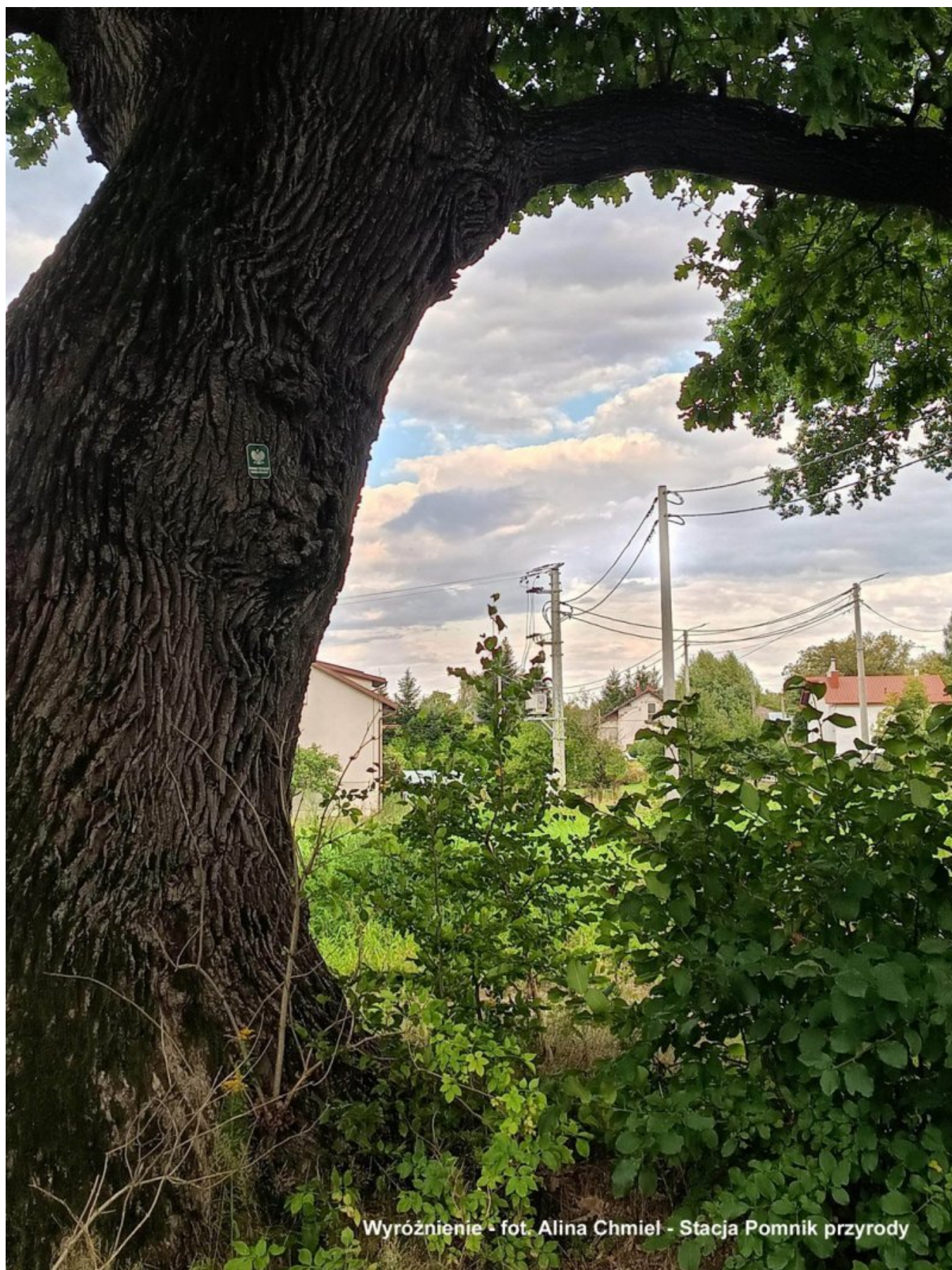
Wyróżnienie - fot. Alina Chmiel - Stacja Pomnik przyrody