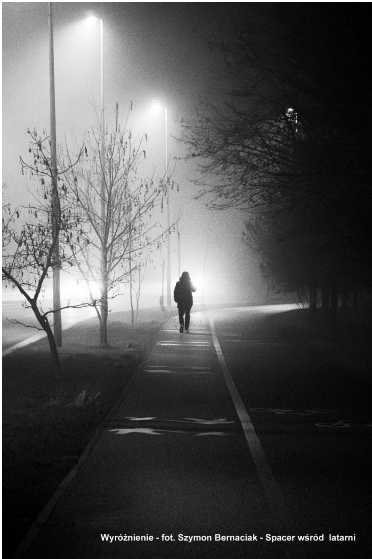
Wyróżnienie - fot. Szymon Bernaciak - Spacer wśród latarni