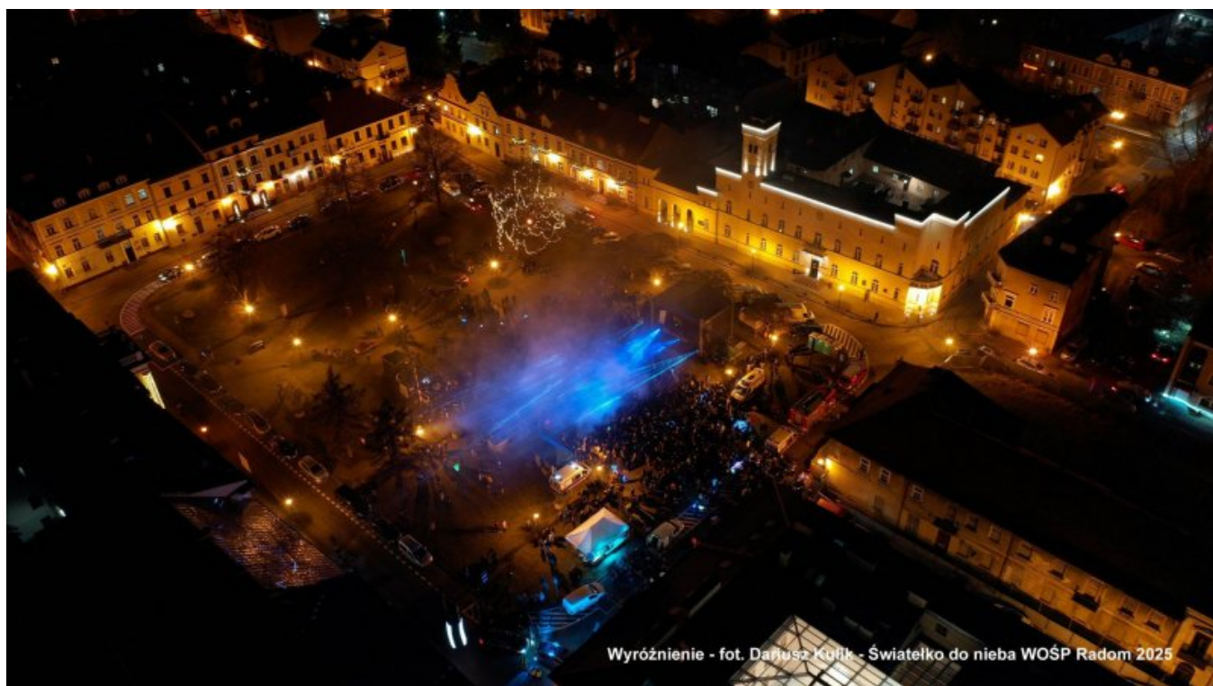
W - Kulik Dariusz - Światelko do nieba WOŚP Radom 2025