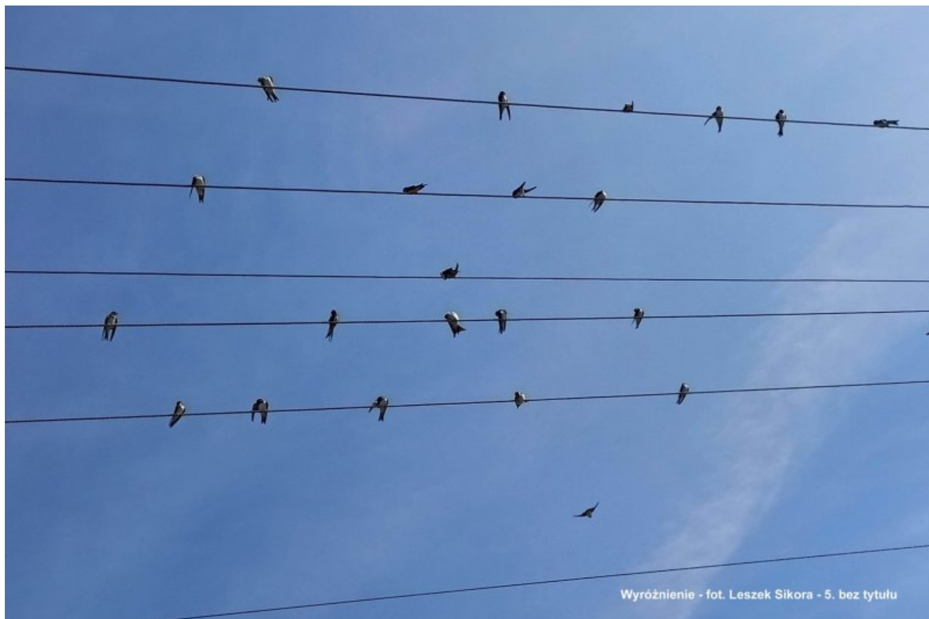
W - Sikora Leszek - 5