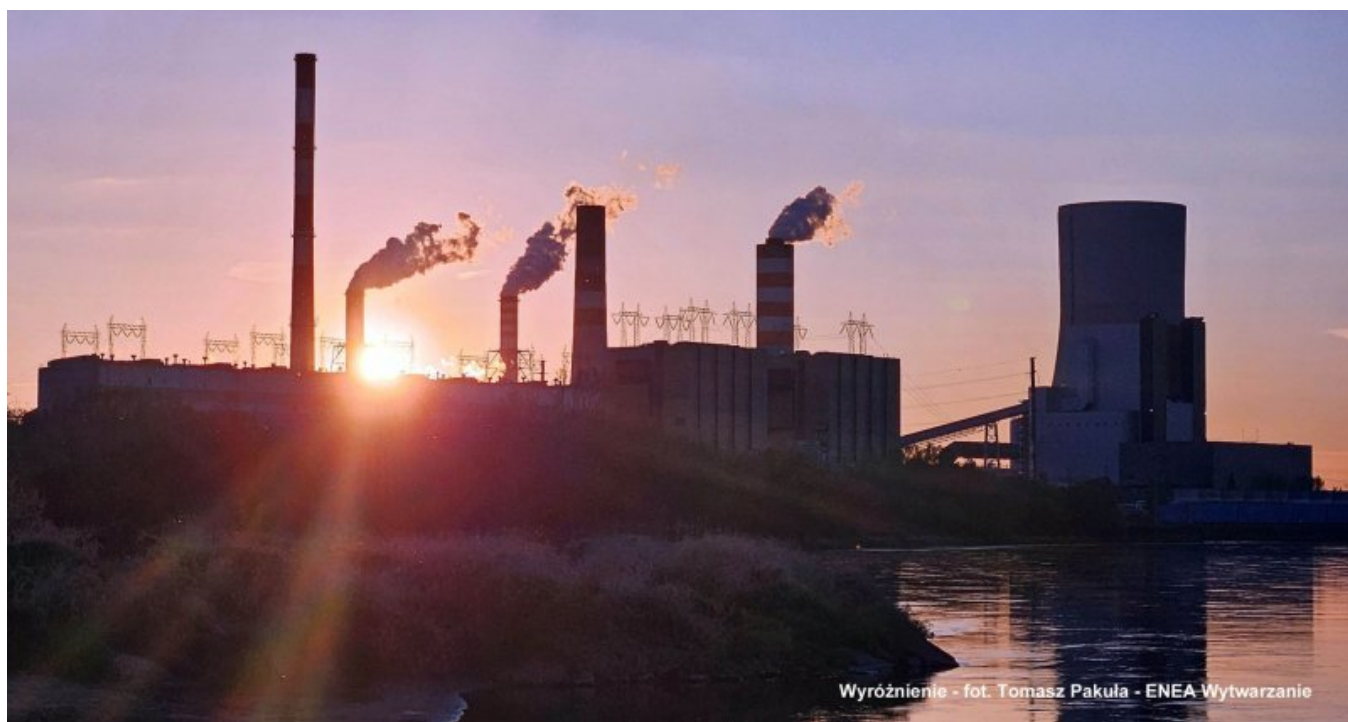
W - Pakuła Tomasz - ENEA Wytwarzanie