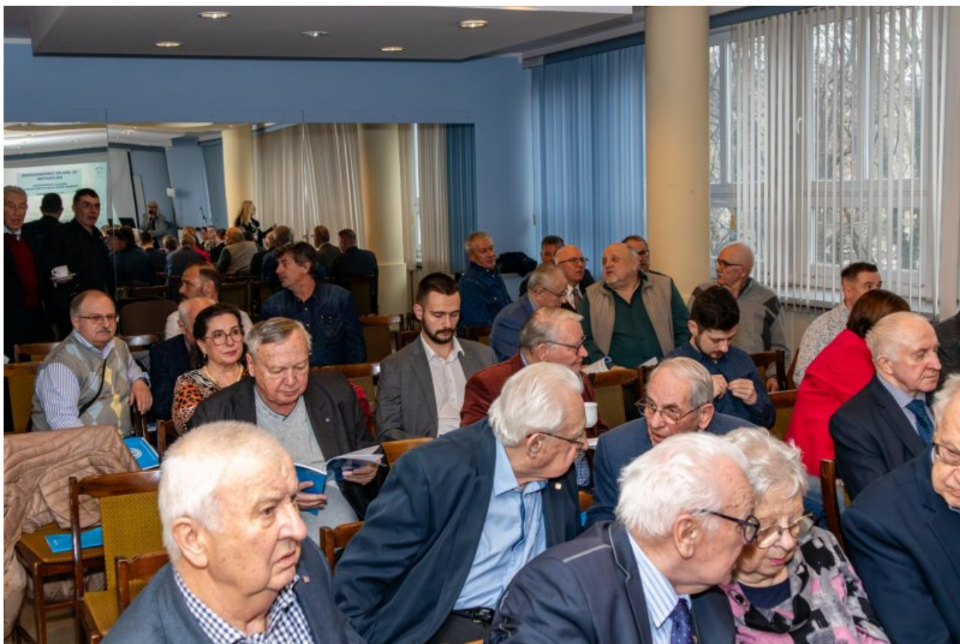
Sala obrad 62. Walnego Zgromadzenia Delegatów Oddziału Poznańskiego SEP