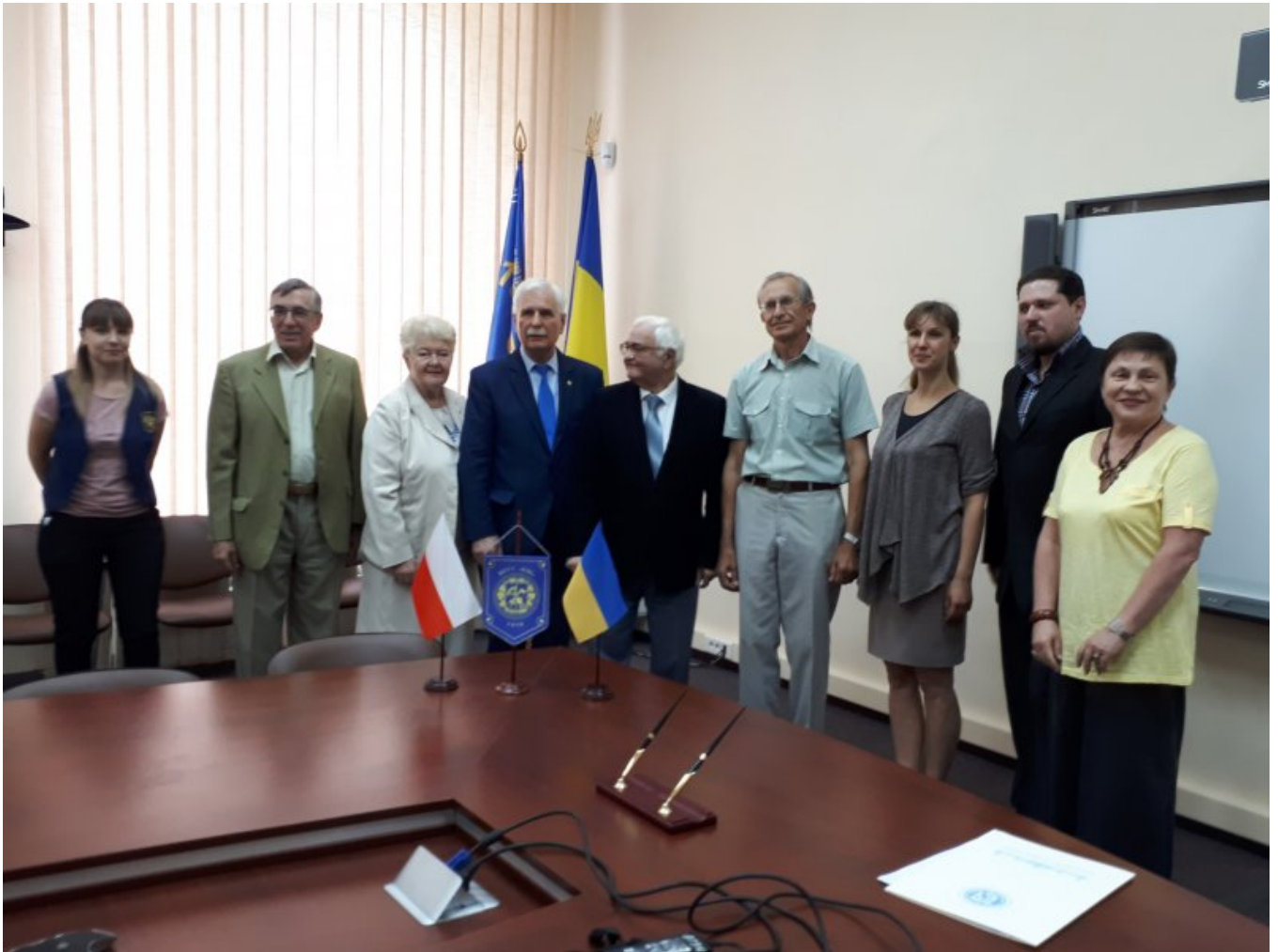
Na Politechnice Kijowskiej