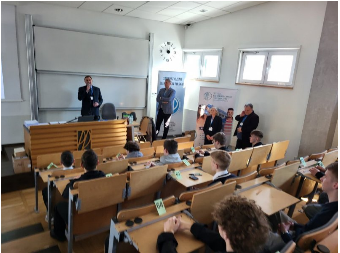
Otwarcie POLTELINFO Aula A61