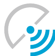
OLIMPIADA LIDERÓW TELEKOMUNIKACJI I INFORMATYKI POLTELEINFO

Ogólnopolska Olimpiada Wiedzy Elektrycznej i Elektronicznej EUROELEKTRA organizowana jest od 27 lat z inicjatywy Zespołu Szkół Elektrycznych w Bydgoszczy. Od początku w realizację tego projektu czynnie włącza się Stowarzyszenie Elektryków Polskich, które obecnie jest głównym organizatorem Olimpiady a w naszym regionie zawody organizowane są w ścisłej współpracy z Wydziałem Elektrotechniki i Informatyki Politechniki Rzeszowskiej. Olimpiada przeznaczona jest dla uczniów szkół średnich, ze szczególnym uwzględnieniem szkół profilu kształcenia obejmującym tematykę Olimpiady. Ze względu na wzrastające zainteresowanie udziałem w tych zawodach oraz rosnącą z roku na rok liczbę uczestników dotychczasowa formuła Olimpiady została zmodyfikowana. Od roku dwóch lat zawody poszczególnych stopni odbywają się w wydzielonych grupach tematycznych i przeprowadzane będą w trzech niezależnych terminach. Uczniowie o zainteresowaniach z zakresu elektrotechniki i energetyki uczestniczą w Olimpiadzie EUROELEKTRA, uczniowie ze szkół o profilu elektronicznym i mechatronicznym startują w Olimpiadzie ELEKTROMECHATRON, natomiast przyszli fachowcy z zakresu telekomunikacji, teleinformatyki i informatyki zmagają się w Olimpiadzie POLTELEINFO.