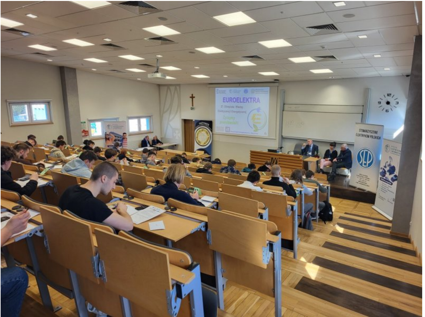
ELEKTROMECHATRON AulaA61