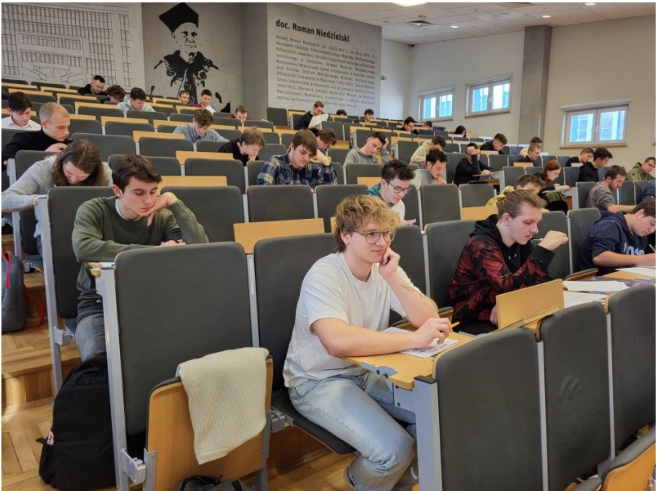
Uczestnicy ELEKTROMECHATRON