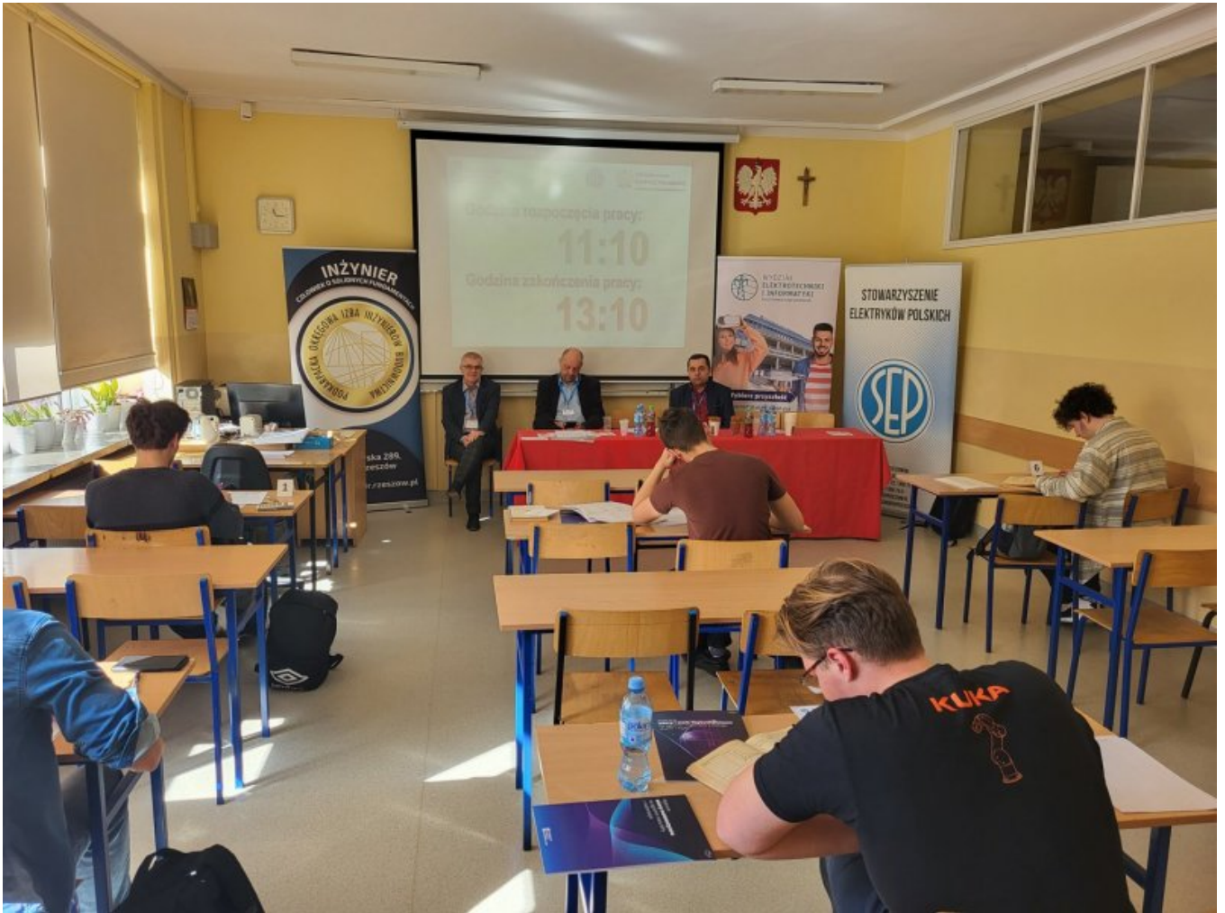
EUROELEKTRA ZSE Rzeszów