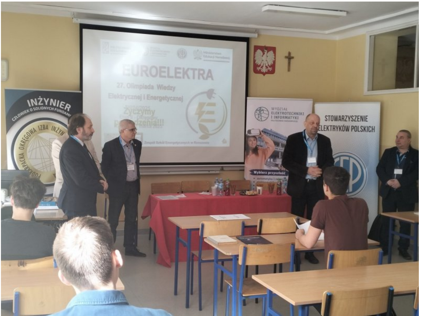
EUROELEKTRA ZSE Rzeszów