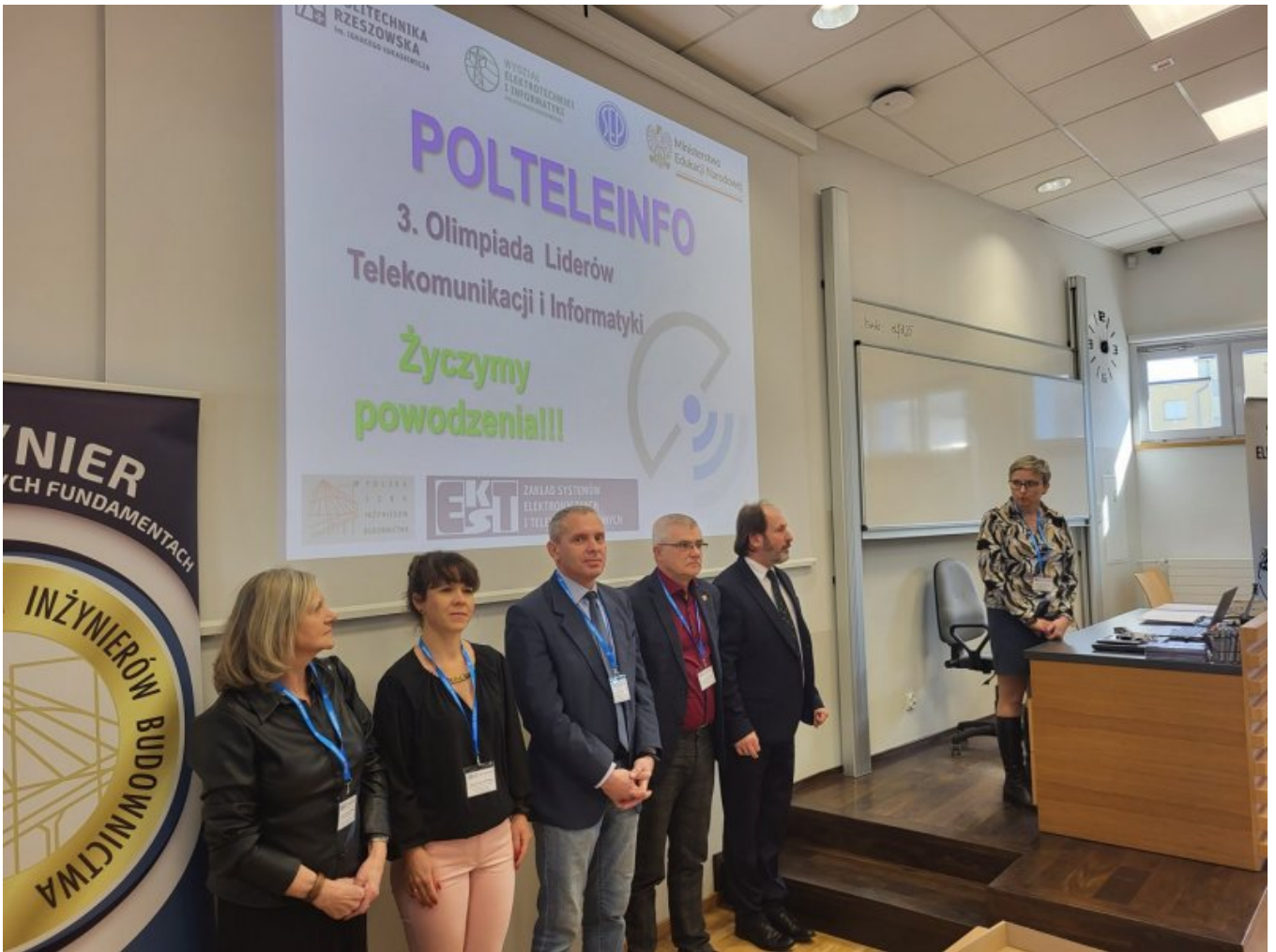
Otwarcie ELEKTROMECHATRON Aula A61