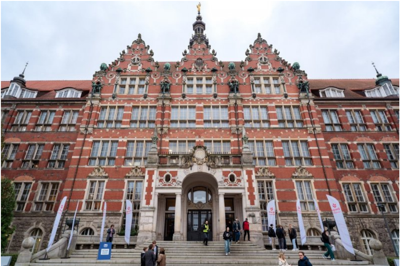
Gmach Główny Politechniki Gdańskiej