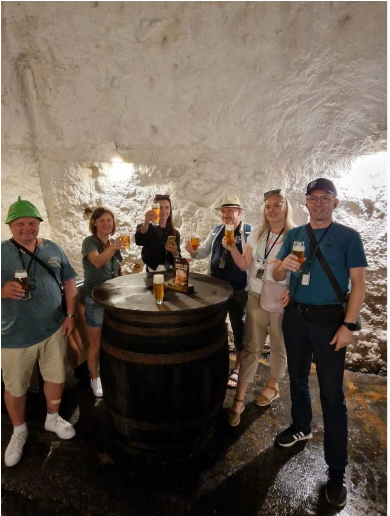
Browar Pilsner Urquell