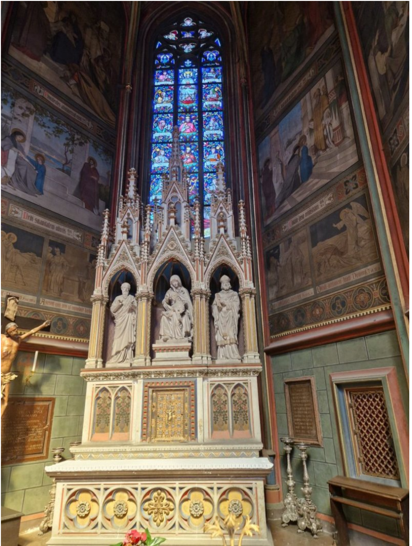
Zamku na Hradczanach