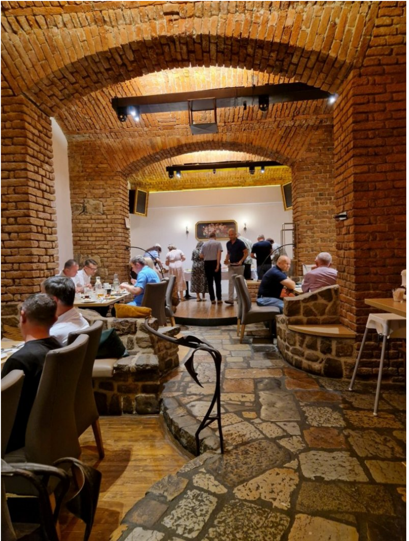
Wieczorem w restauracji Zlaté Časy