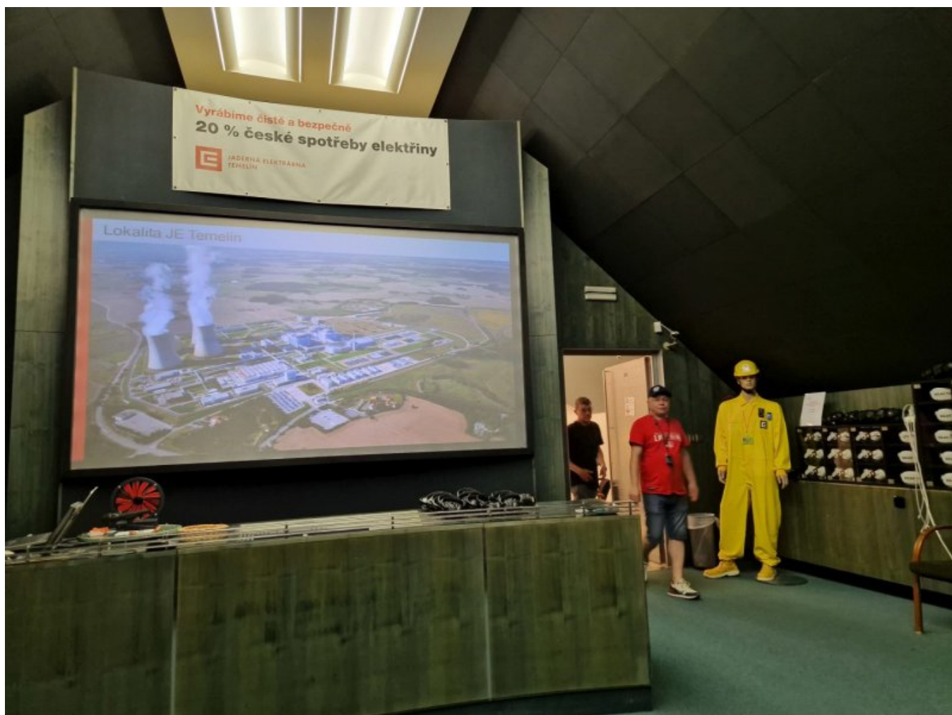
Centrum Informacyjne Elektrowni Jądrowej Temelin