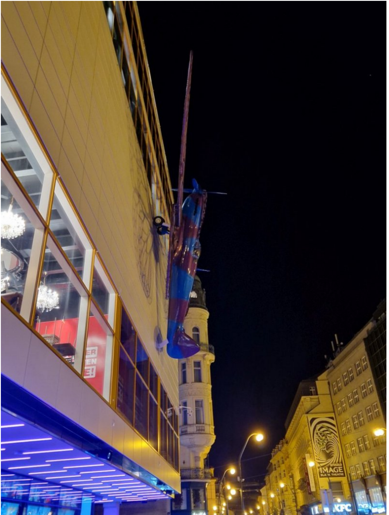
Supermarine Spitfire na budynku