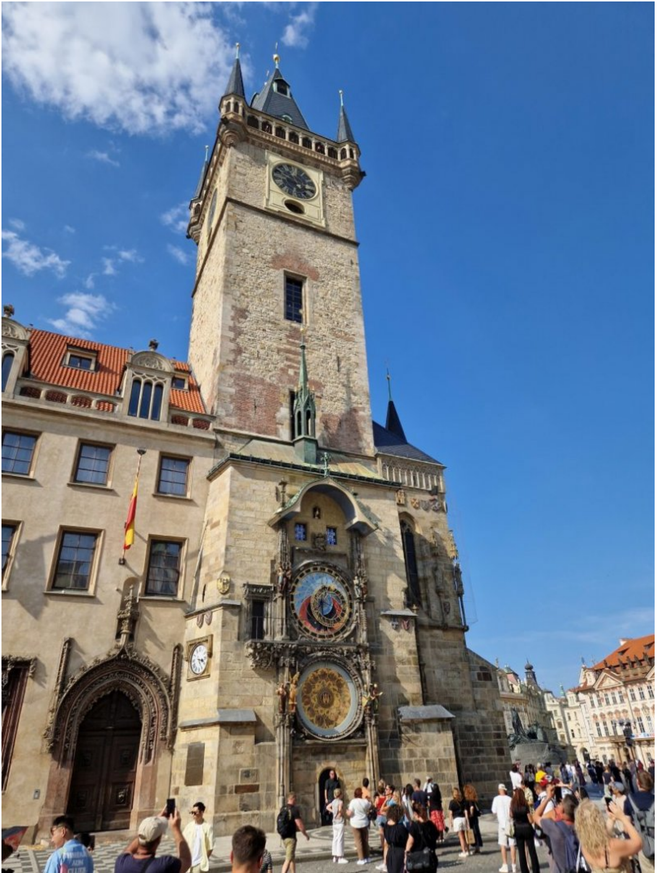
Praski zegar astronomiczny