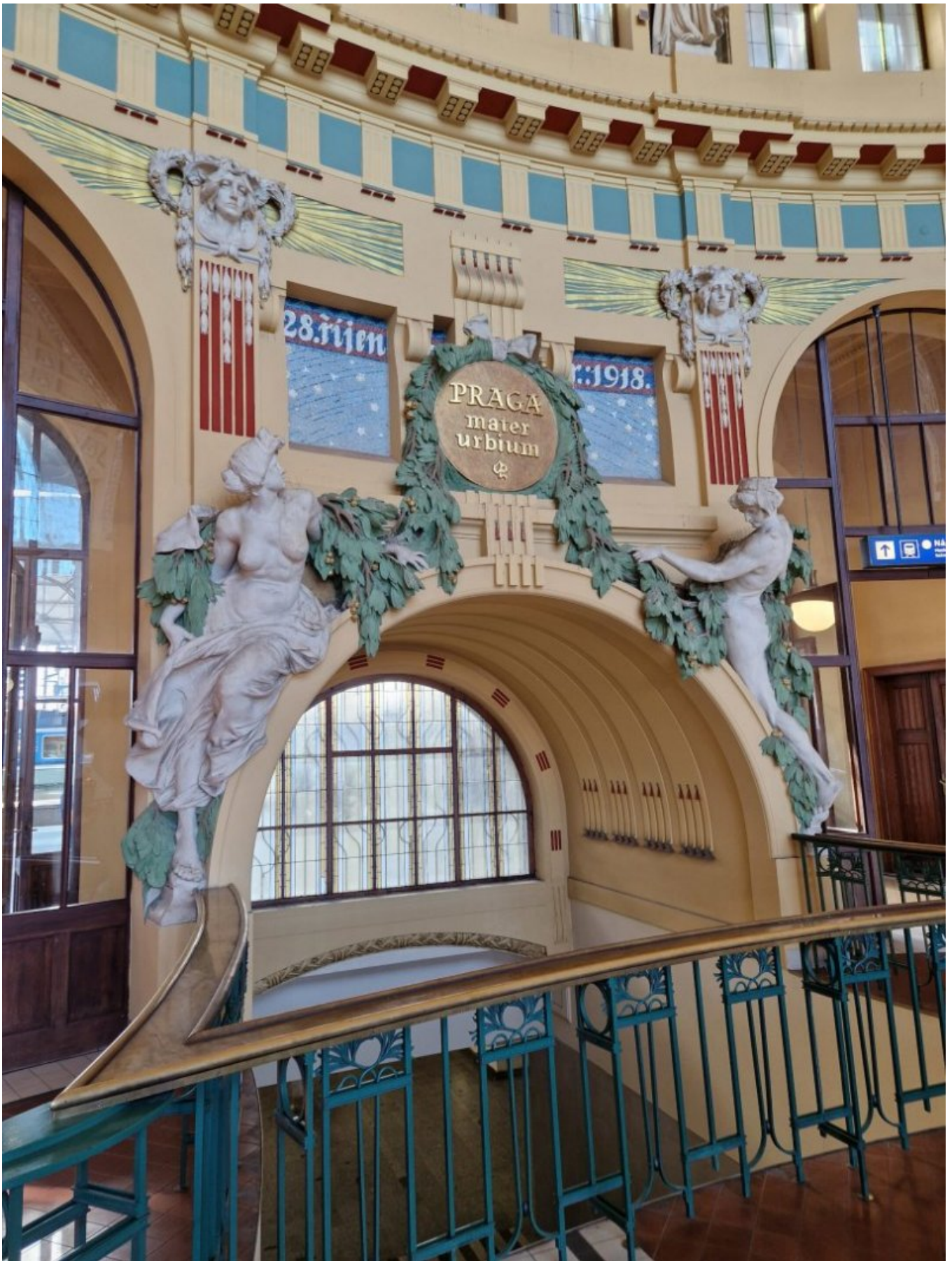
Dworzec kolejowy w Pradze