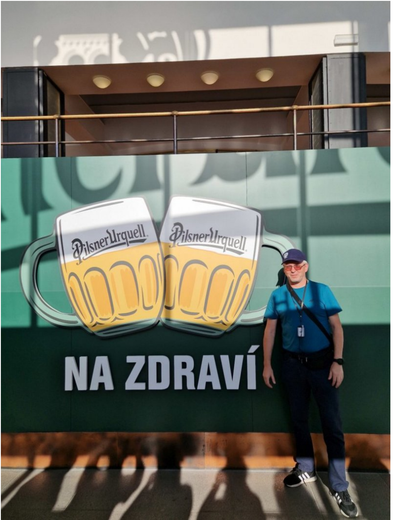
Browar Pilsner Urquell