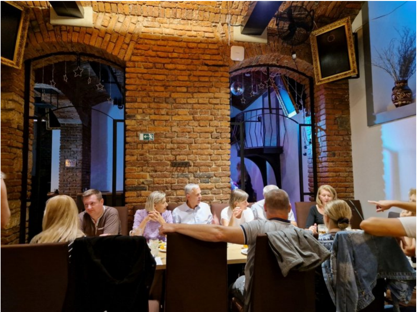
Kolacja w restauracji Zlaté Časy