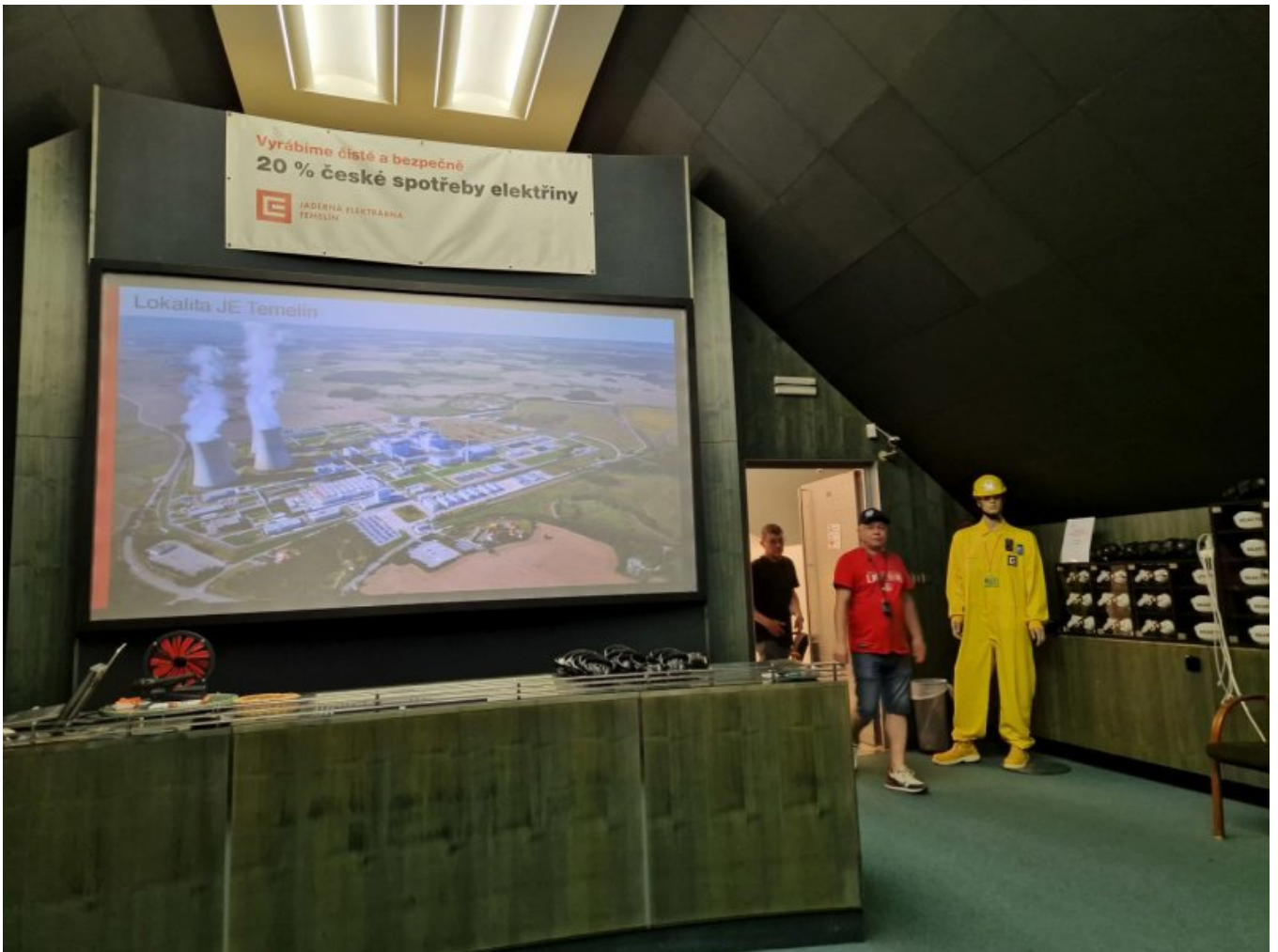
Centrum Informacyjne Elektrowni Jądrowej Temelin