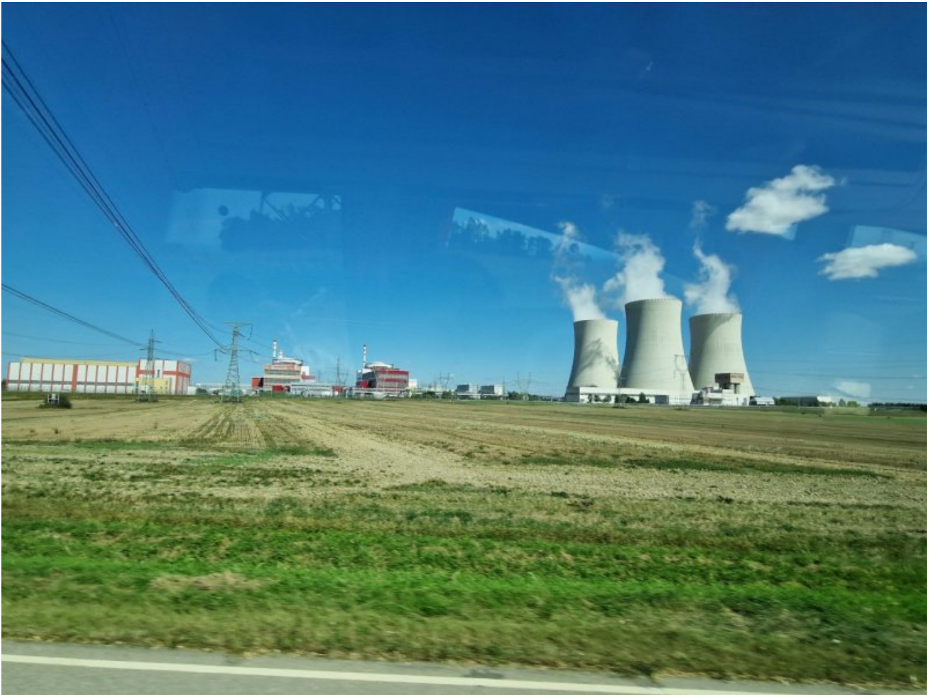
Elektrownia jądrowa w Temelinie