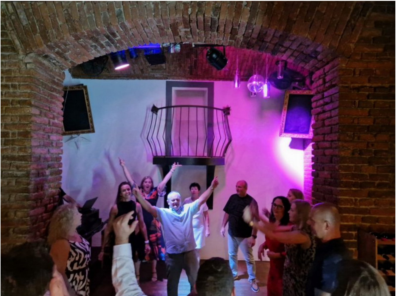
Wieczorem w restauracji Zlaté Časy