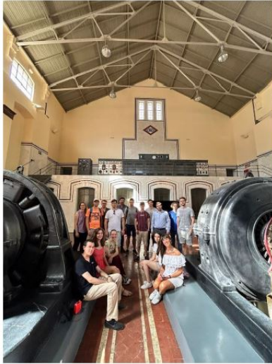
Zdjęcie 12: Zwiedzanie muzeum Metra – Metro de Madrid.