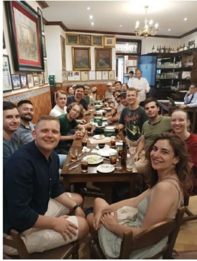
Zdjęcie 3: Uczestnicy EUREL Field Trip w Tawernie.

Po południu zwiedziliśmy centrum Madrytu, gdzie w interesujący sposób poznaliśmy historię powstawania miasta Madryt przywołując czasy VIII w.n.e, jak i wszystkie historyczne wydarzenia w Europie z tego okresu, przemierzając trasę stuletnich tawern w miejscach najważniejszych lokacji tj. „bram miasta”, gdzie mogliśmy skosztować specjalów niektórych z nich i poznać zwyczaje miasta.