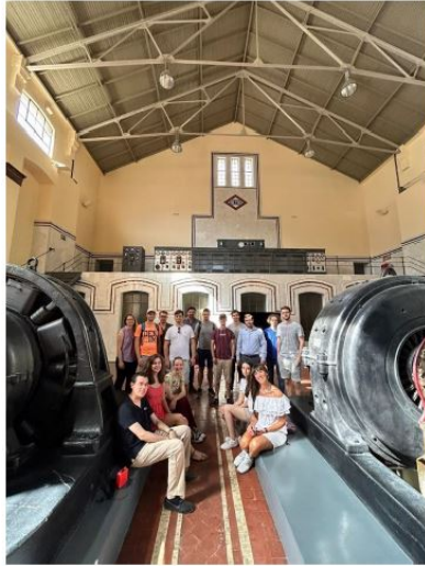
Zdjęcie 12: Zwiedzanie muzeum Metra – Metro de Madrid.