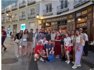
Zdjęcie 4: Uczestnicy EUREL Field Trip na końcu wycieczki po centrum Madrytu.

Trzeciego dnia odwiedziliśmy Centralne Laboratorium Inżynierii Elektrycznej (LCOE) w TecnoGetafe. Pracujący tam specjaliści pokazali nam laboratoria wysokiego i średniego napięcia,