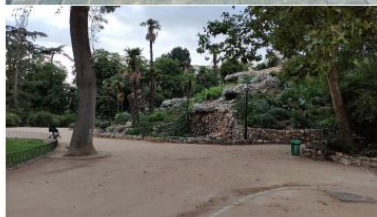
Zdjęcie 8, 9, 10 i 11: Wieczorne zwiedzanie Retiro Park.

Ostatniego dnia wizyta połączyła technologię i kulturę: odwiedziliśmy parowozownię Pacífico należącą do Metro de Madrid. Została ona zbudowana w 1922 roku i służyła do 1972 roku. Odwiedziliśmy również stare lobby stacji, które nadal wygląda tak, jak w 1923 roku.