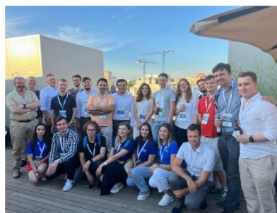
Zdjęcie 1: Uczestnicy EUREL Field Trip na dachu COIIM

Oficjalne rozpoczęcie wydarzenia odbyło się 16 lipca 2024 r. w siedzibie „Colegio de Ingenieros Industriales de Madrid” (COIIM) zlokalizowanego około 5 minut od głównego noclegu. W trakcie rozpoczęcia, uczestnicy wyjazdu mieli okazję zapoznać się ze sobą, dowiedzieć w jakich sektorach elektrotechniki się specjalizują oraz poznać zainteresowania poza sferami naukowymi, zaś następstwem rozpoczęcia był poczęstunek na dachu budynku z panoramą na Madryt.