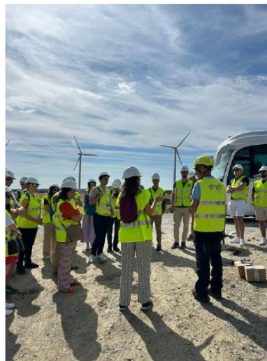
Zdjęcie 2: Uczestnicy EUREL Field Trip na farmie wiatrowej.

Drugiego dnia udaliśmy się do Ávili, aby odwiedzić farmę wiatrową. W otoczeniu pięknego górskiego krajobrazu mogliśmy dowiedzieć się o działaniu farmy wiatrowej zarządzanej przez Endesa, farmy wiatrowe firmy „Enel Green Power”. W trakcie tej wycieczki uczestnicy mieli okazję zapoznać się ze specyfiką pracy w branży turbin wiatrowych, potrzebnym wykształceniu, wymaganych umiejętnościach do podjęcia pracy w tym obszarze, a nawet wejść do jednej z turbin wiatrowych.