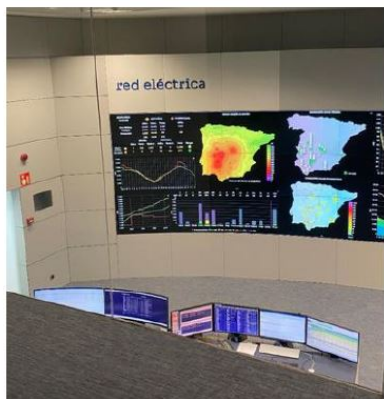
Zdjęcie 7: W trakcie wizyty w Red Eléctrica.

Po południu odbyliśmy przyjemną wycieczkę z przewodnikiem po parku Retiro, gdzie z wielkim zaangażowaniem przywoływane były aspekty historyczne z dnia poprzedniego.