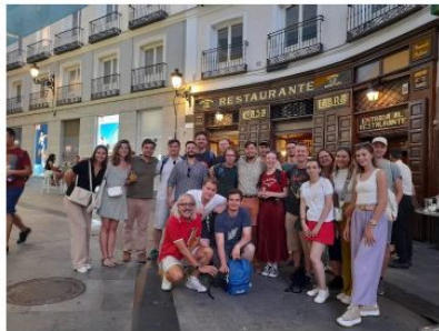
Zdjęcie 4: Uczestnicy EUREL Field Trip na końcu wycieczki po centrum Madrytu.

Trzeciego dnia odwiedziliśmy Centralne Laboratorium Inżynierii Elektrycznej (LCOE) w TecnoGetafe. Pracujący tam specjaliści pokazali nam laboratoria wysokiego i średniego napięcia,