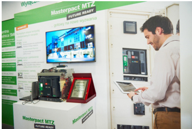
Na zdjęciach: wyróżniony wyłącznik Masterpact MTZ na Targach ENERGETAB 2018