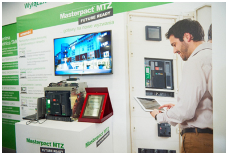
Na zdjęciach: wyróżniony wyłącznik Masterpact MTZ na Targach ENERGETAB 2018