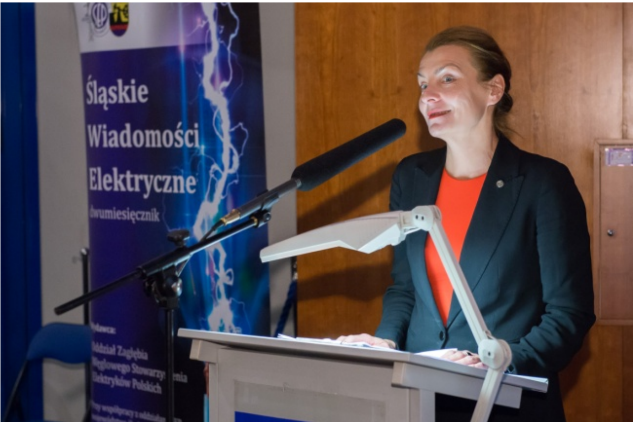
Fot.1 uczestnicy spotkania