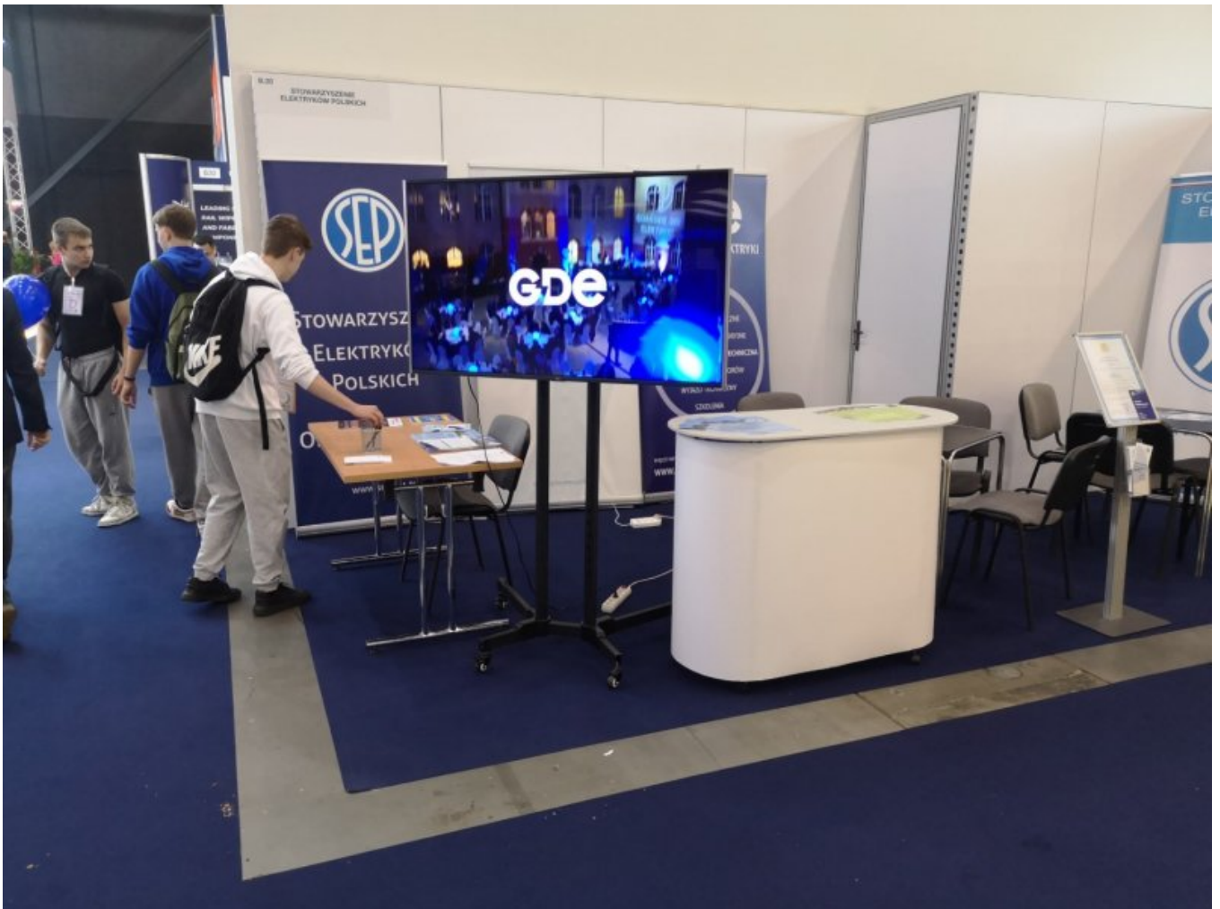
Stoisko SEP podczas targów