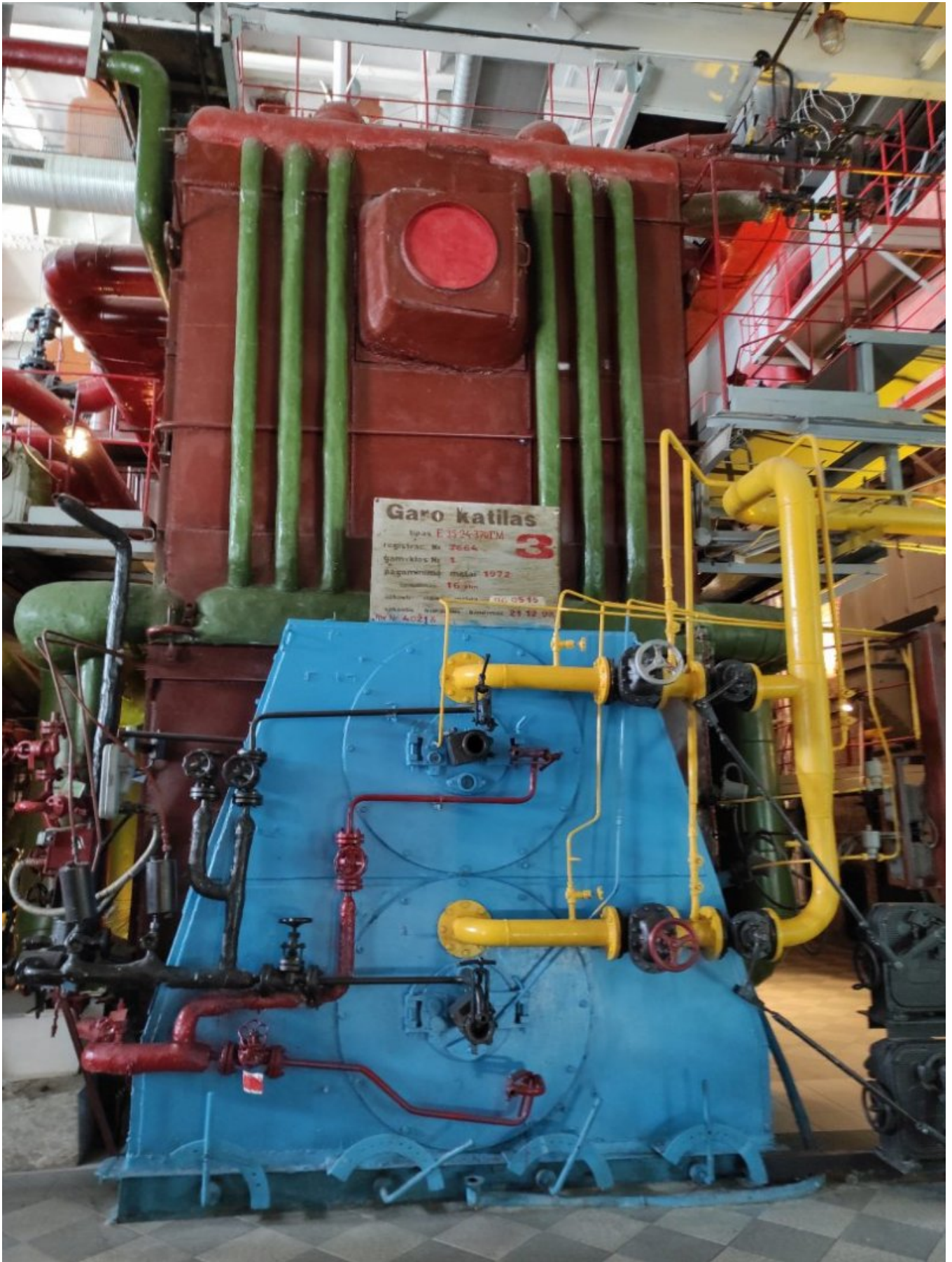
Muzeum Energetyki i Techniki