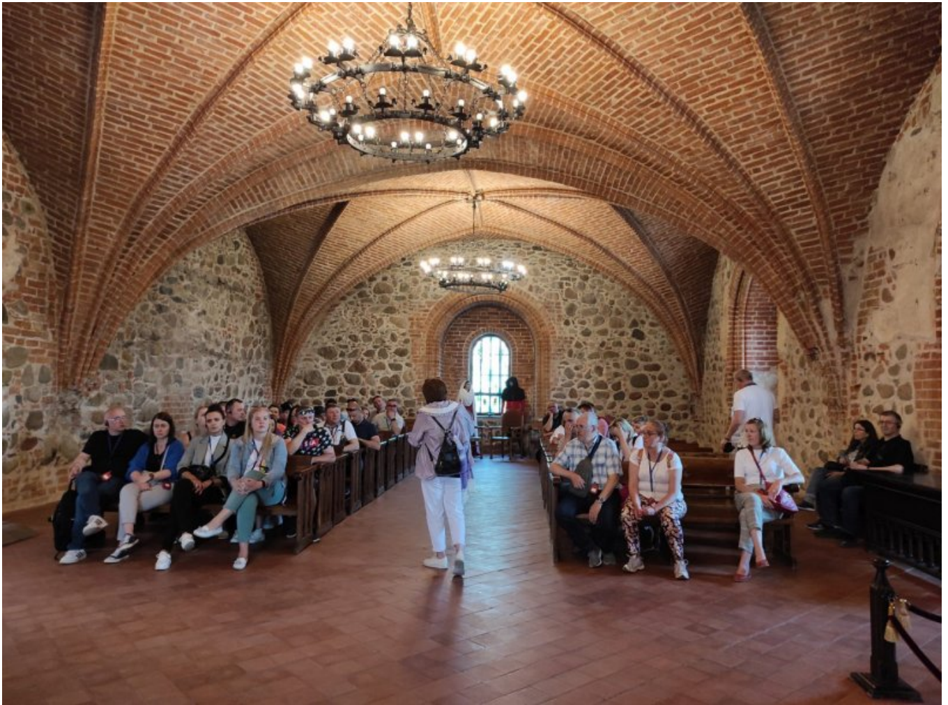
Zamek w Trokach