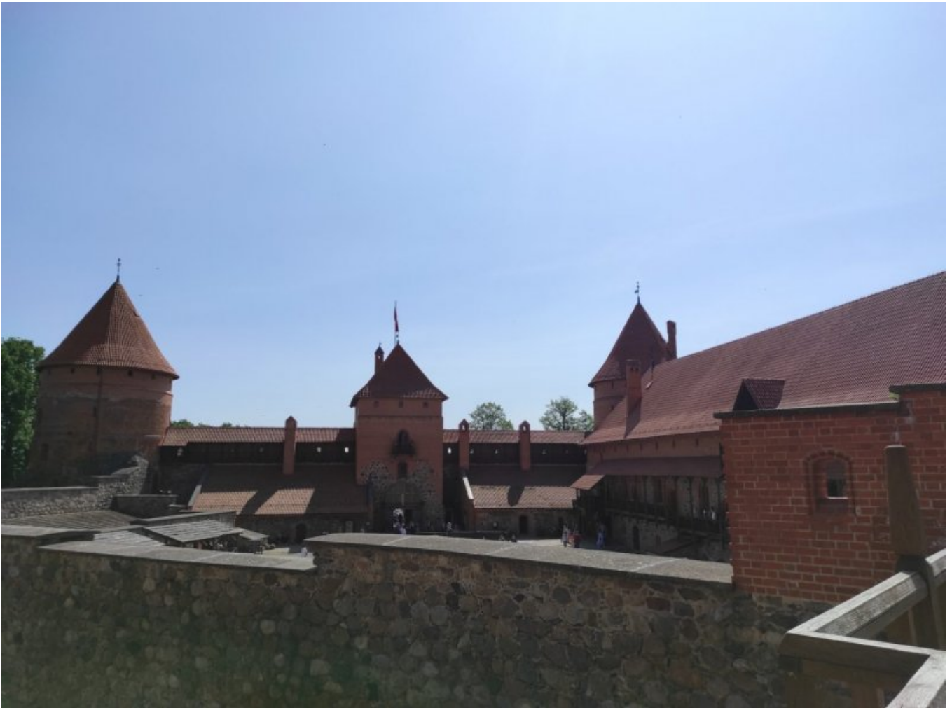
Zamek w Trokach