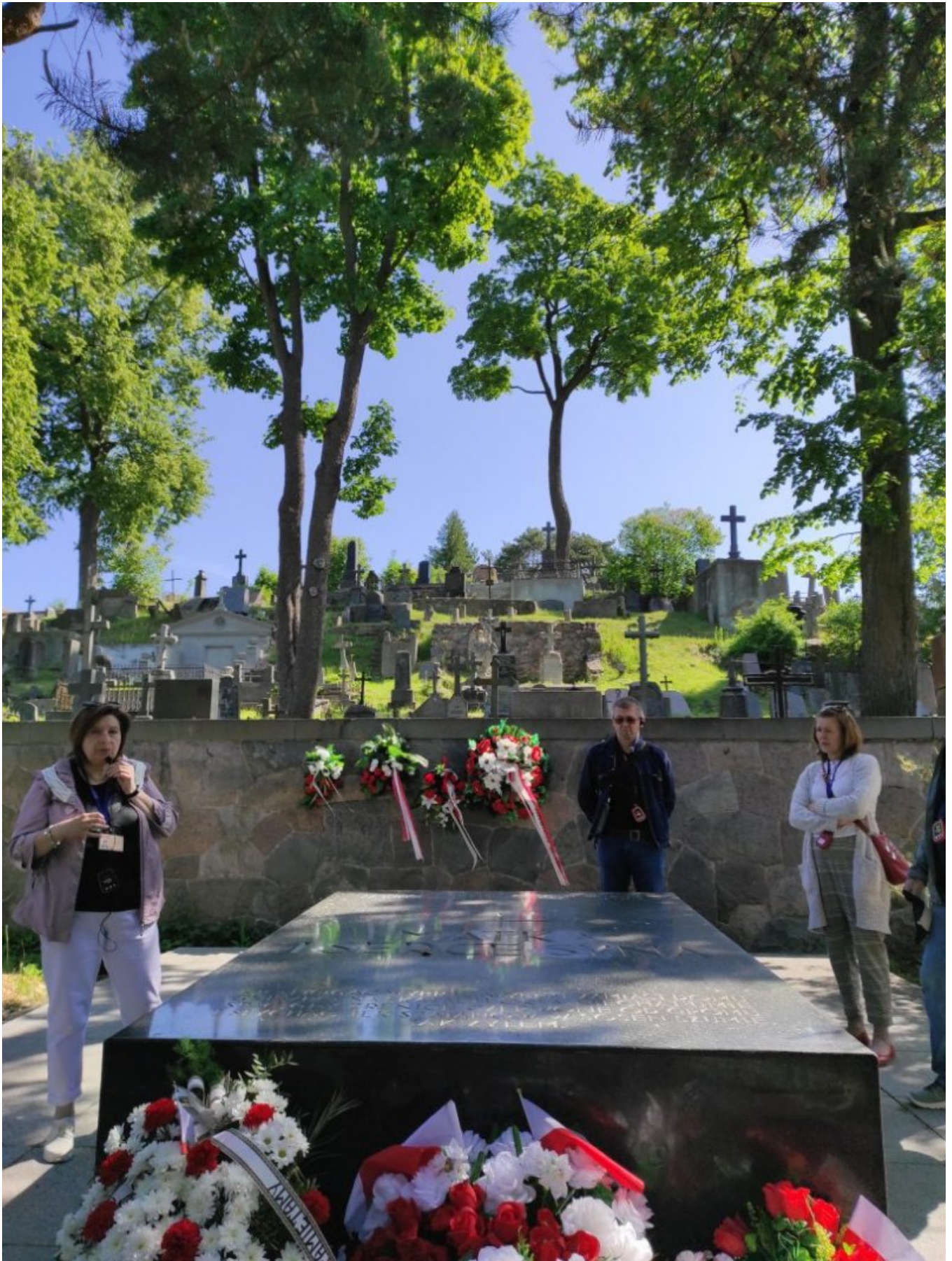
Cmentarz Na Rossie