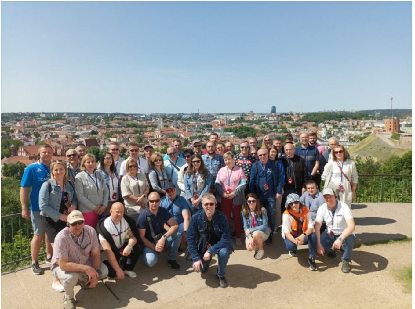
Góra Trzech Krzyży