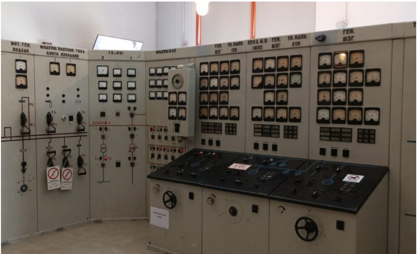
Muzeum Energetyki i Techniki