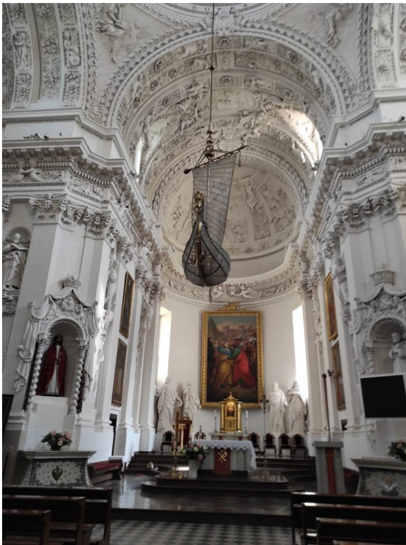
Kościół św. Apostołów Piotra i Pawła