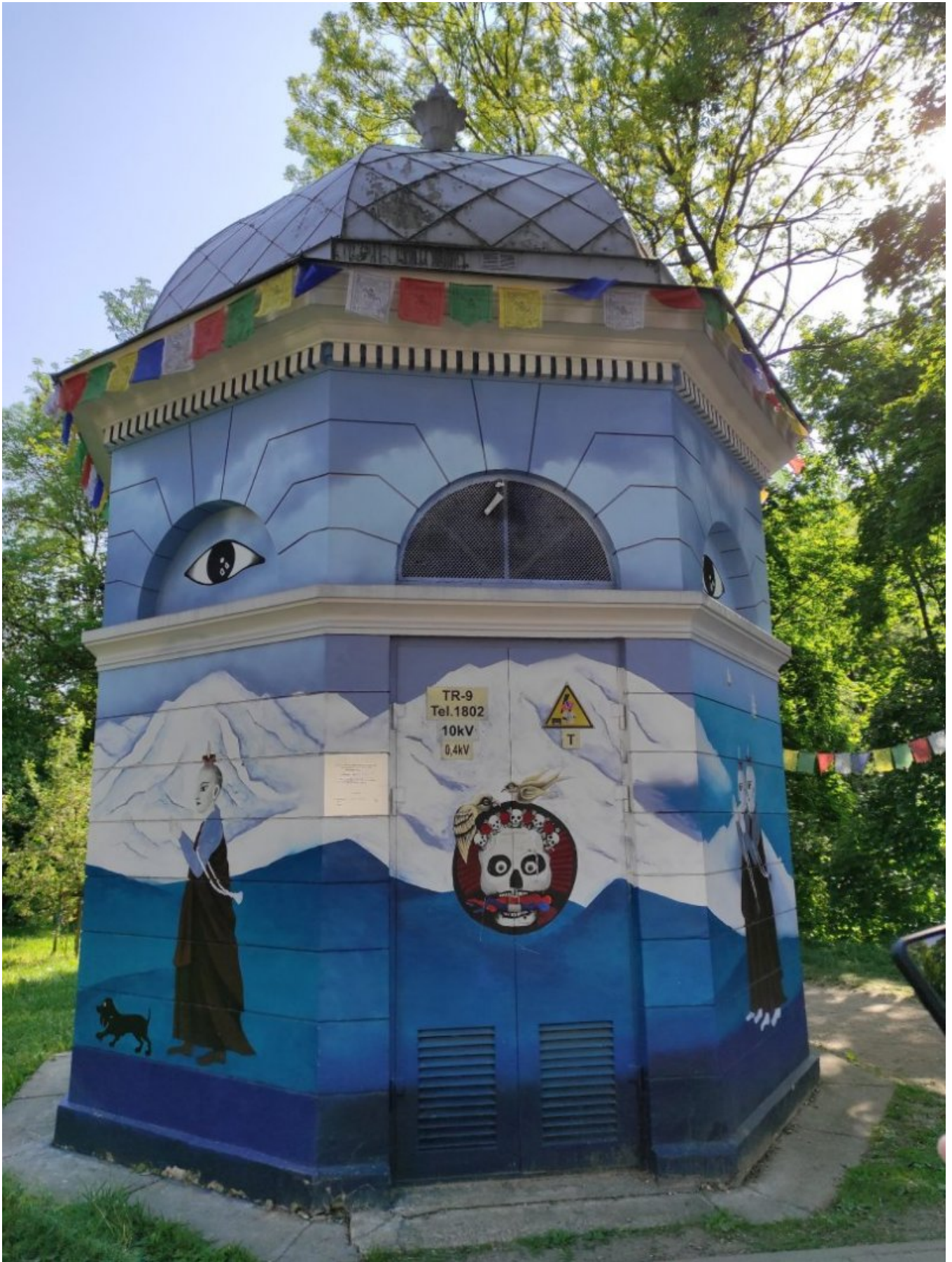
Zarzecze – stacja transformatorowa