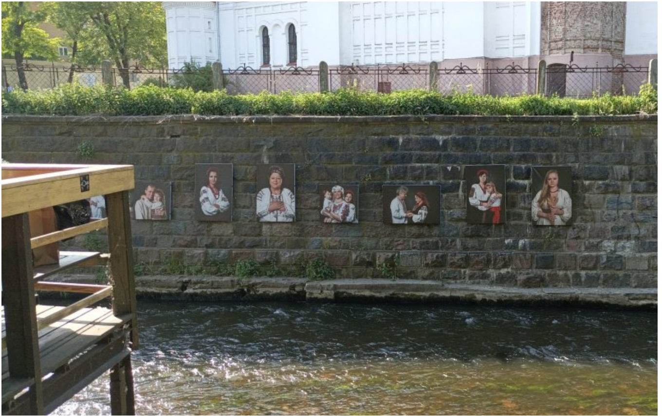
Zarzecze – galeria obrazów