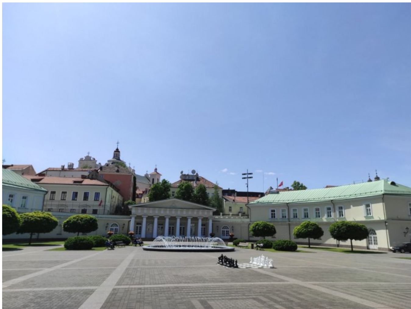
Pałac prezydencji w Wilnie