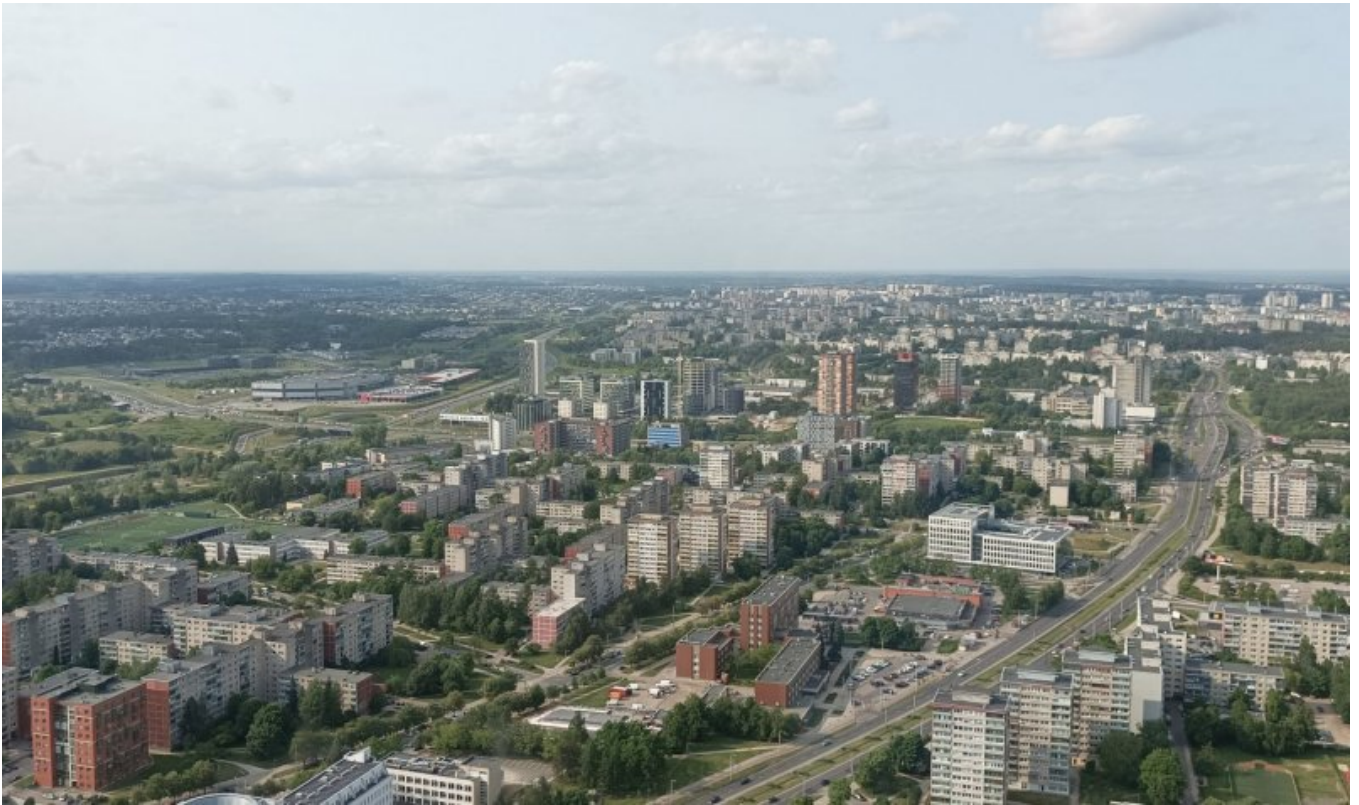
Widok z wieży telewizyjnej