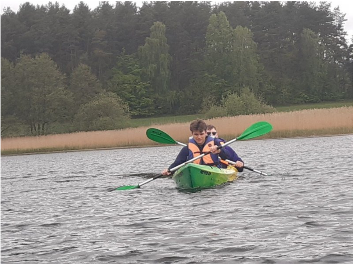
Spływ Kajakowy -2