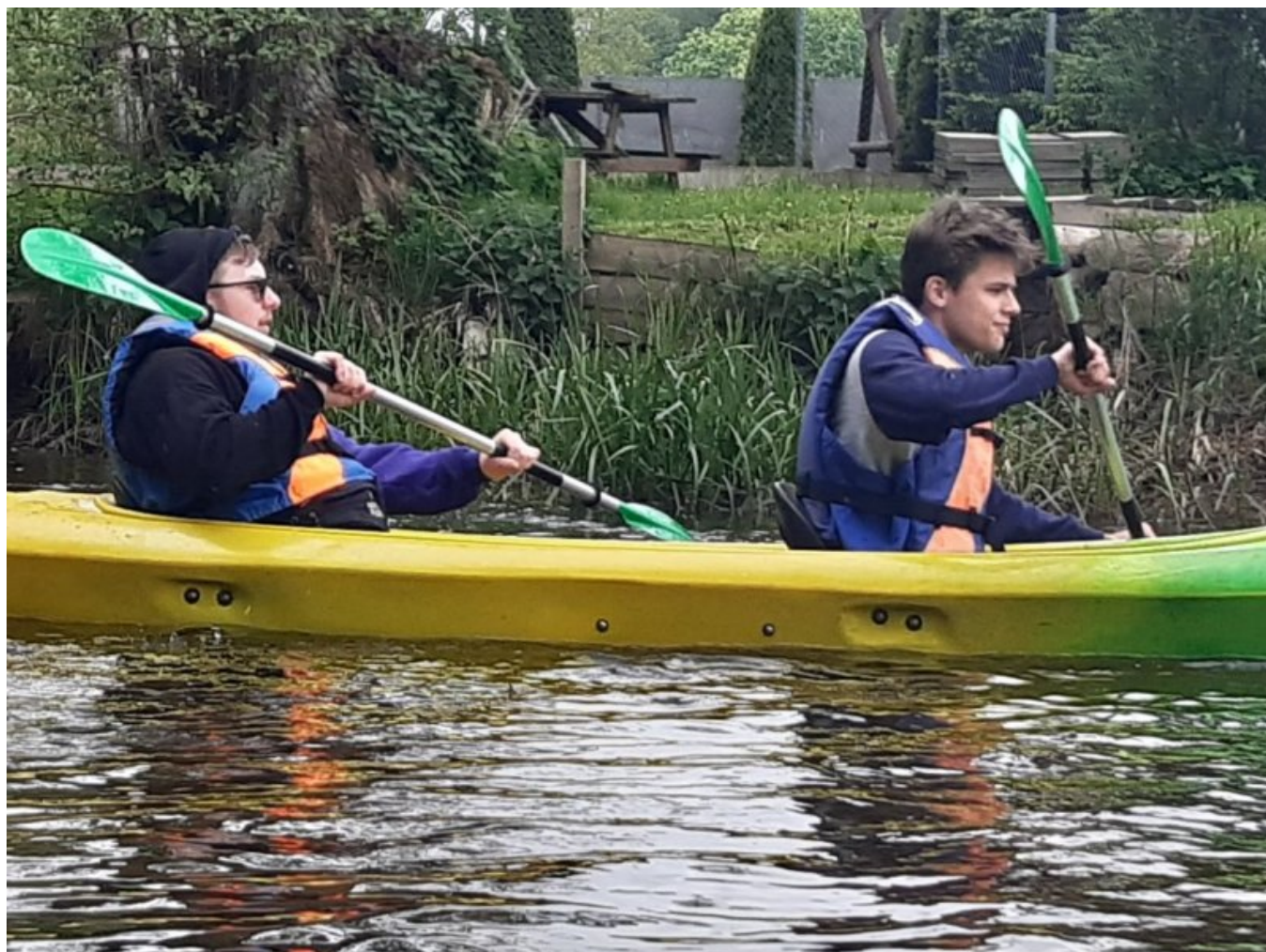
Spływ kajakowy - 1