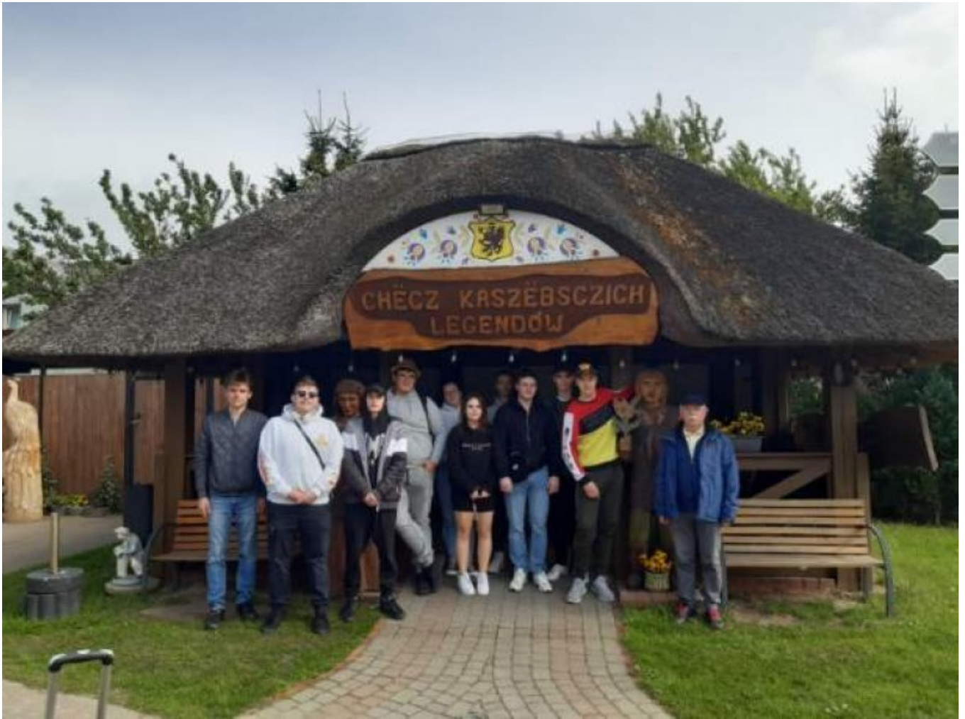
Fot. Członkowie Koła Młody Energetyk