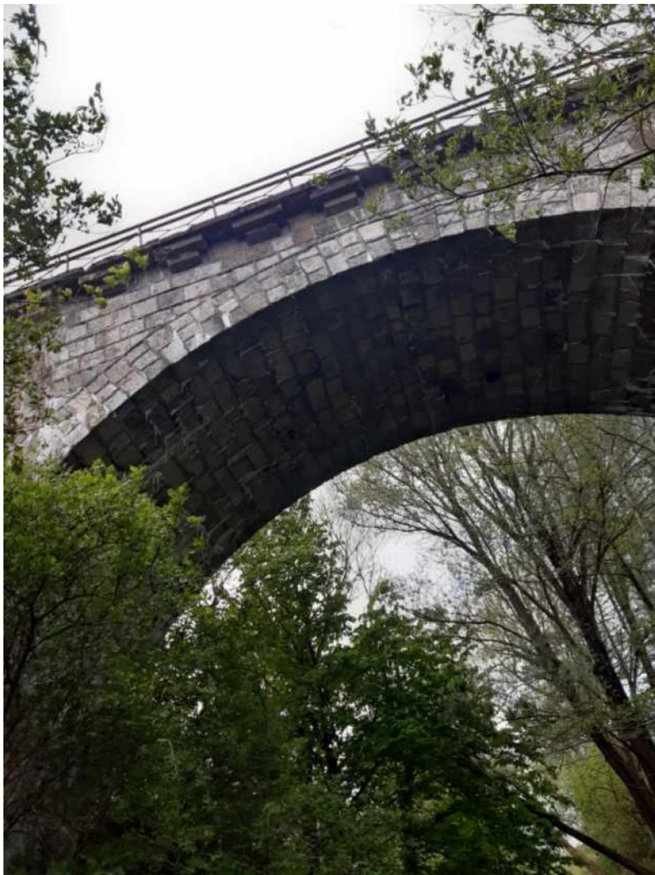
Widok z rzeki Radunia