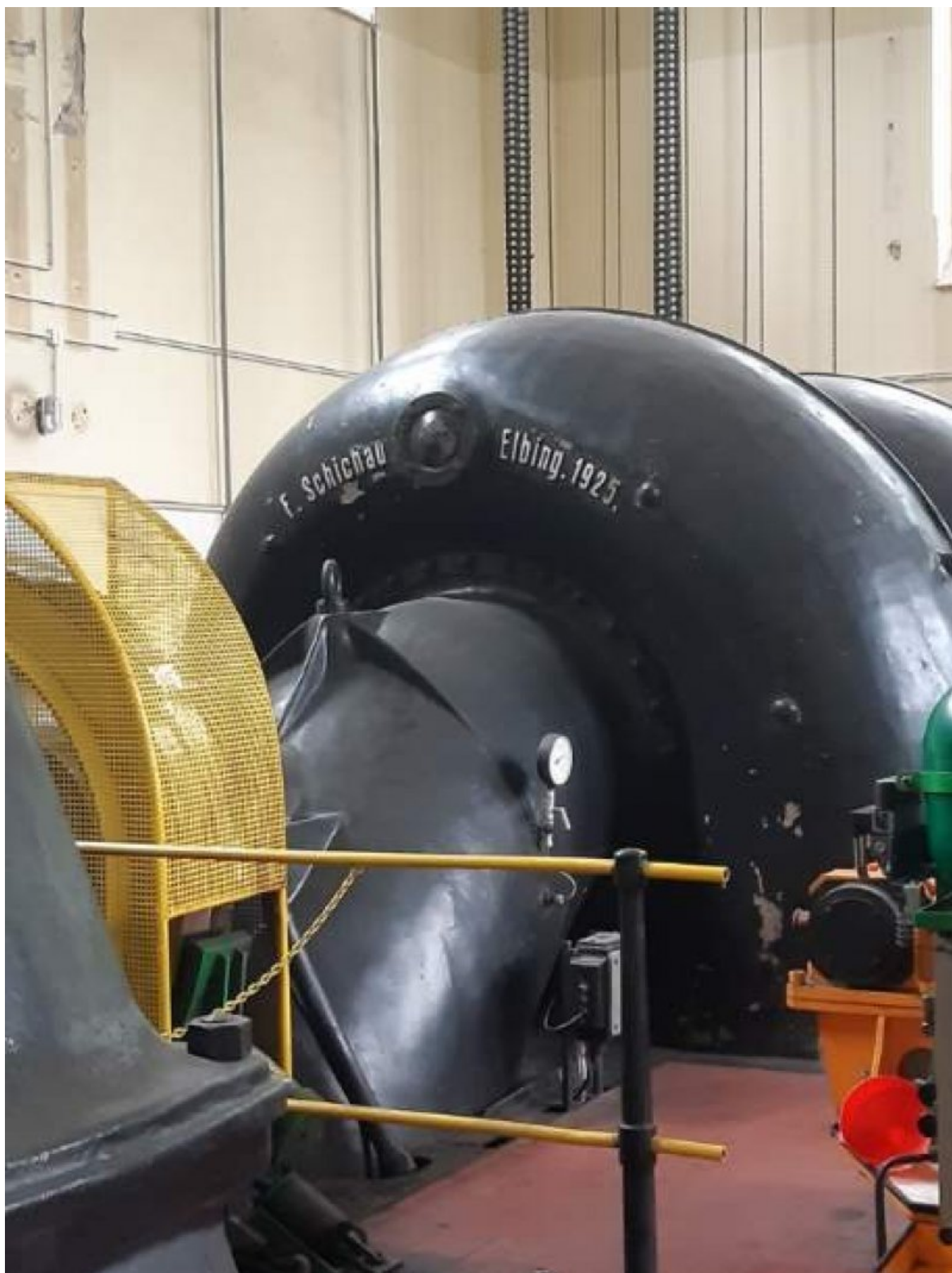
EW Łapino - Turbina Schichau Elbing 1925