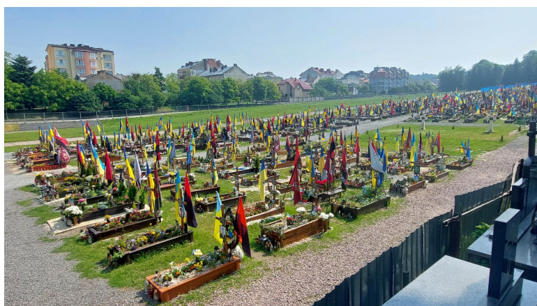
Cmentarz żołnierzy poległych w walce z rosyjską agresją na Ukrainę w latach 2022-2023