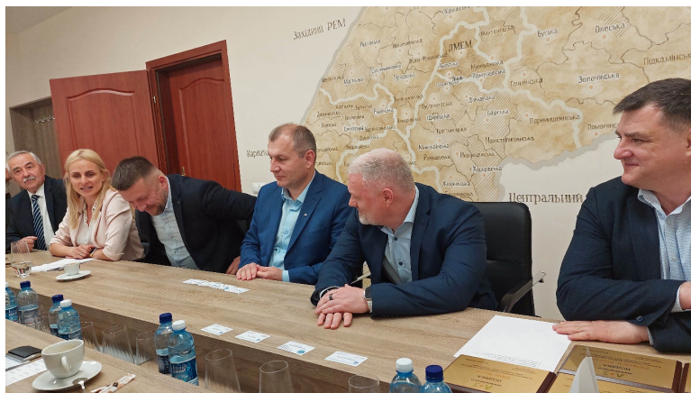
Początek spotkania delegacji SEP z kierownictwem Firmy PSA "Liwibłenergo"

https://kuriergalicyjski.com/wizyta-we-lwowie-polskich-energetykw/