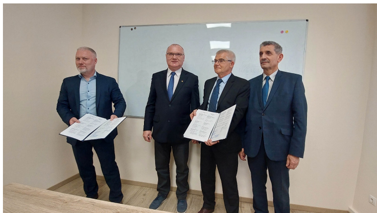
Sygnatariusze prezentuj podpisane porozumienie...