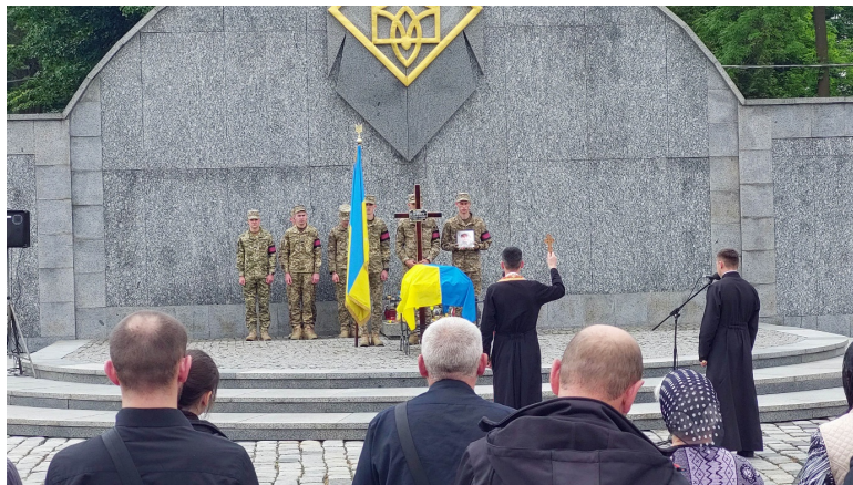
Pogrzeb wojskowy żołnierza poległego za wolność Ukrainy...