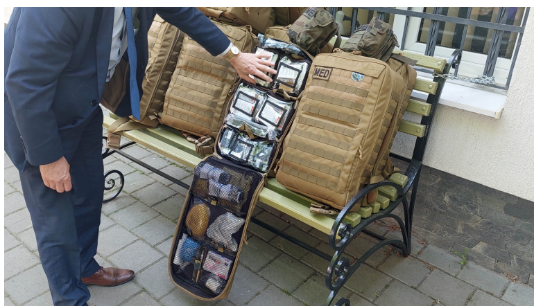
Wntrze jednego z plecakw ratunkowych. WyposaŹenie tej "superapteczki" zgodne jest ze standardami wojsk NATO