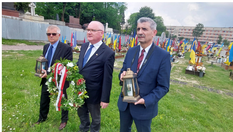
Delegacja SEP podczas składania kwiatów i zniczy na cmentarzu żołnierzy poległych w latach 2022-2023