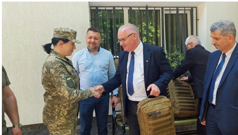
Plecaki z rąk prezesa SEP odbierają przedstawiciele Sił Zbrojnych Ukrainy