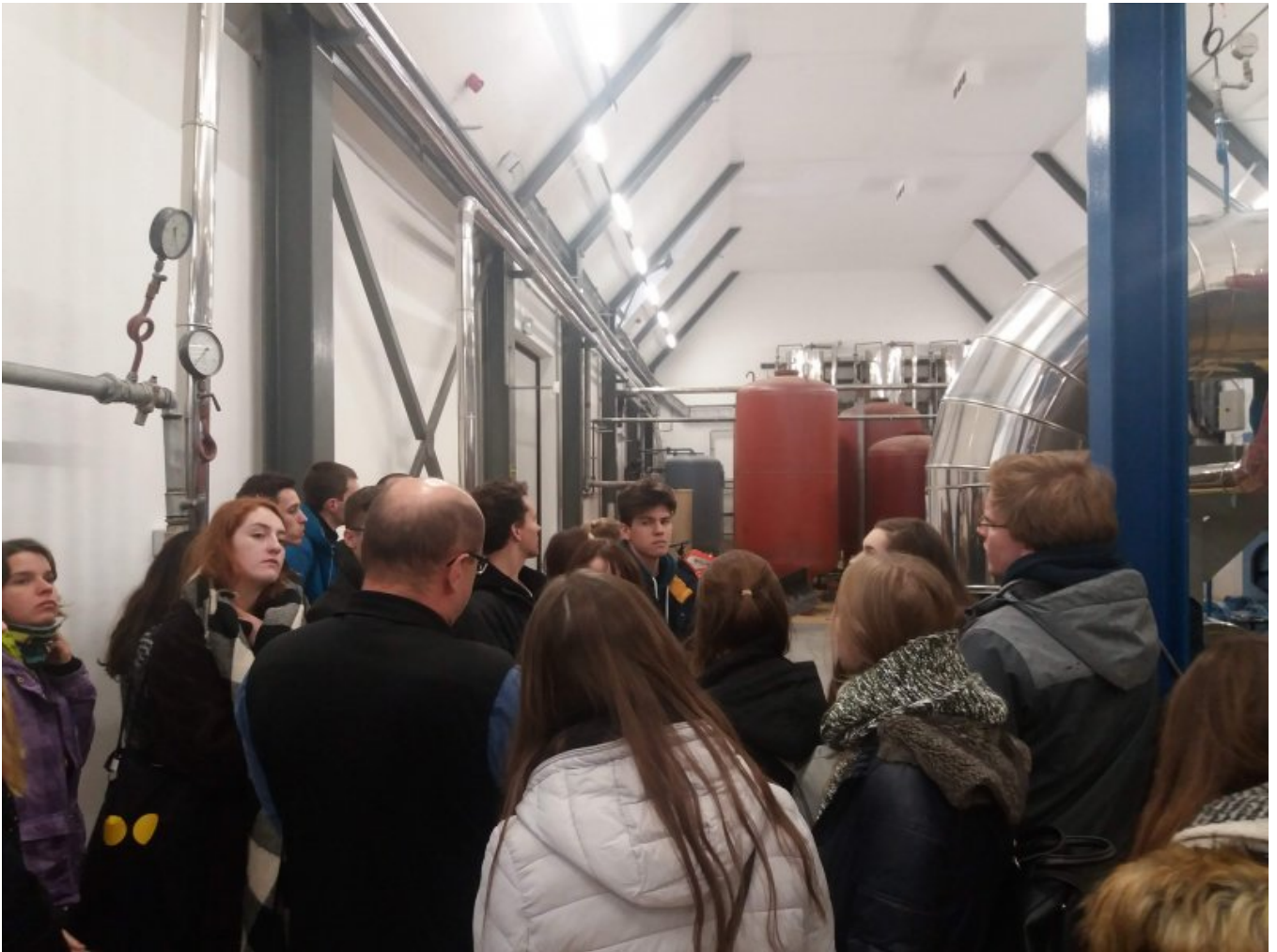
Pracownik zakładu podczas prezentacji maszynowni