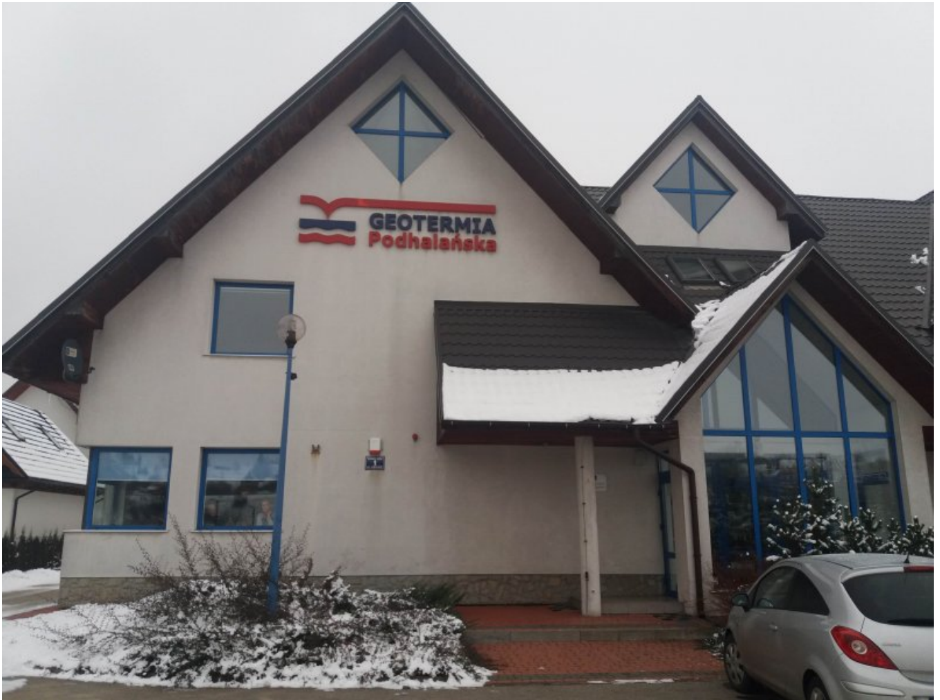
Budynek Geotermii Podhalańskiej