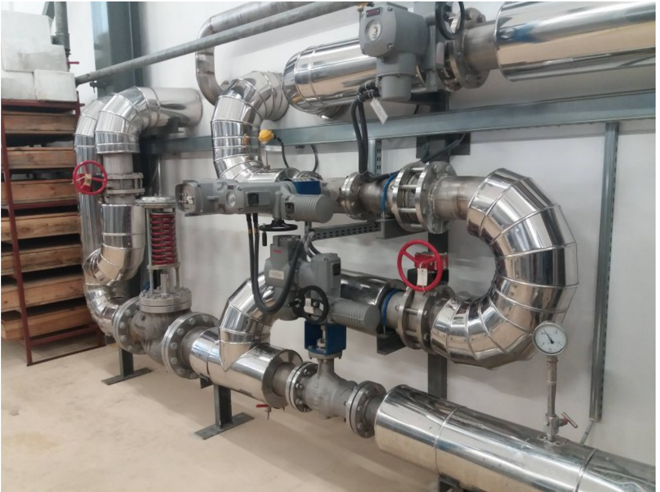
Układ siłowników do sterowania przepływem