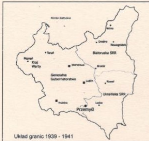
Układ granic 1939 - 1941