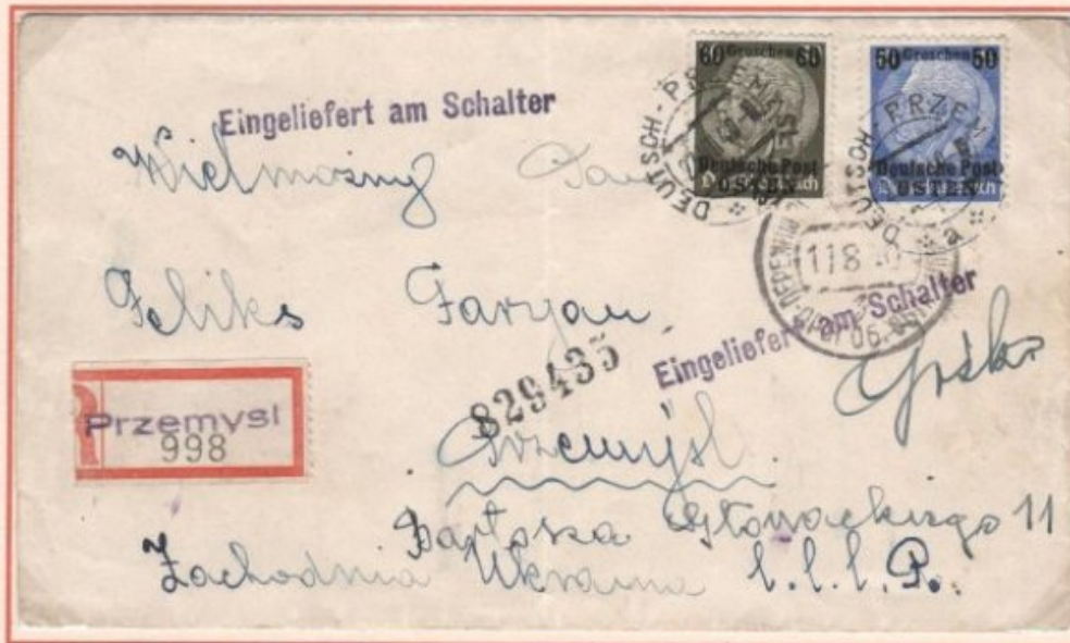
koperta listu poleconego wysłanego z niemieckiego Zasania 23.07.1940 r. i dostarczonego do radzieckiego Przemyśla 11.08.1940 r. RR

Autor opublikował wyniki własnych badań w fachowych czasopismach (Filatelista, Przegląd Filatelistyczny, HBBF).