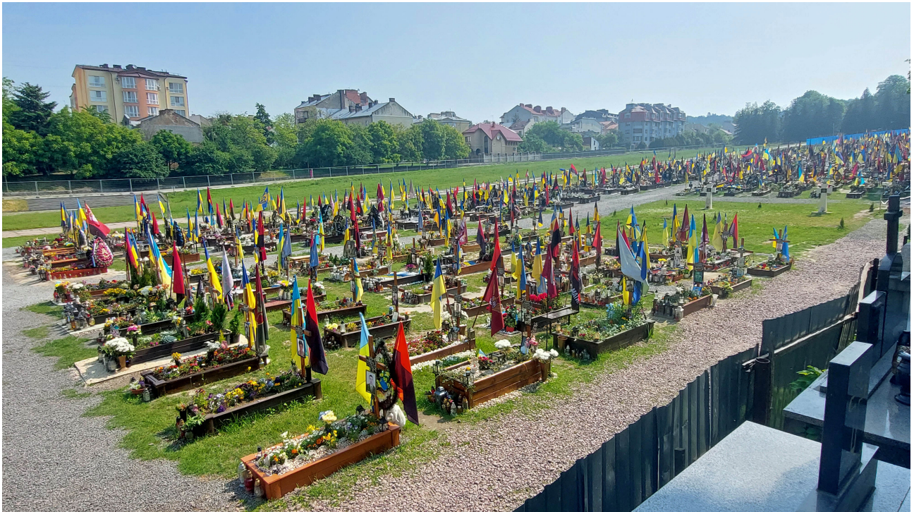
Cmentarz żołnierzy poległych w walce z rosyjską agresją na Ukrainę w latach 2022-2023