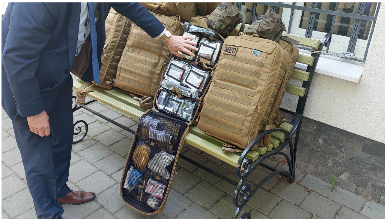
Wnętrze jednego z plecaków ratunkowych. Wyposażenie tej "superapteczki" zgodne jest ze standardami wojsk NATO