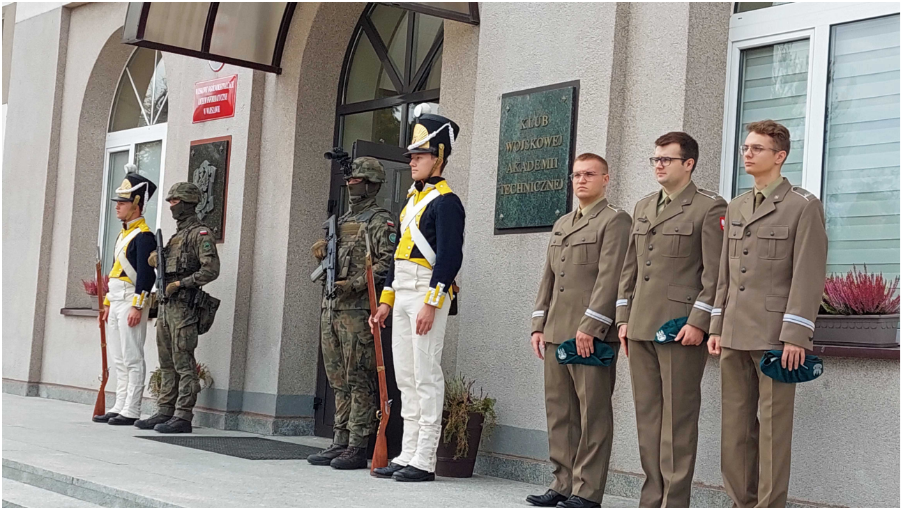
Studenci-Podchorążowie witają Gości w murach Uczelni