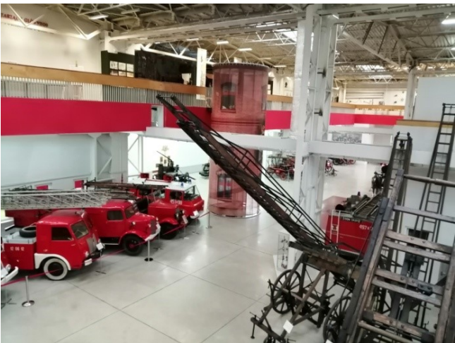
Widok z galerii na eksponaty