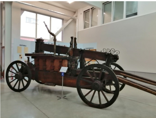
Najstarszy eksponat - sikawka zbudowana na potrzeby ochrony zabudowań klasztonych w XVIII w.