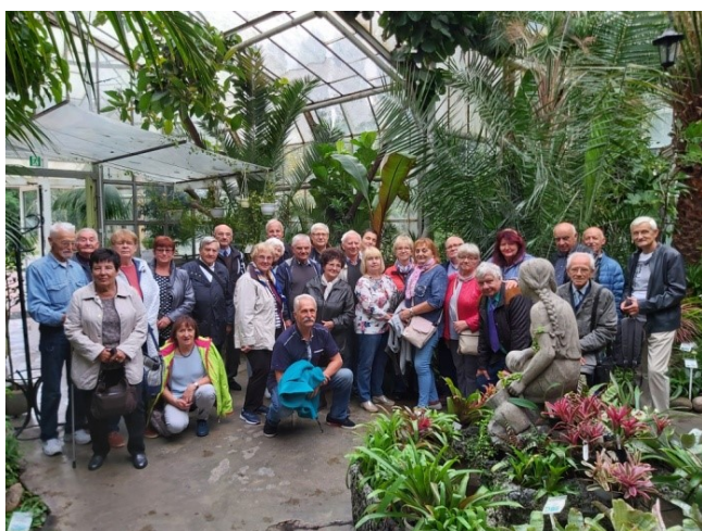
Seniorzy Zwiedzający Egzotarium

Egzotarium zostało otwarte w 1956 roku. w związku z tym ciasnota i czas odcisnęły na nim swoje piętno. Czekają go przebudowa, po której będzie to Centrum Edukacji Ekologicznej. Przybędzie miejsca dla roślin i zwierząt. Będą też nowe atrakcje dla zwiedzających. Mimo trudnych warunków „mieszkańowych” dla roślin i zwierząt, warto zwiedzić to miejsce.