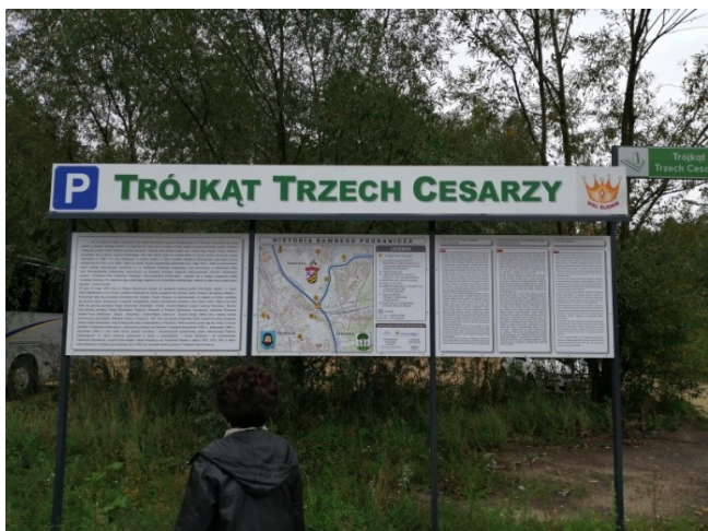
Miejsce styku trzech granic zaborów