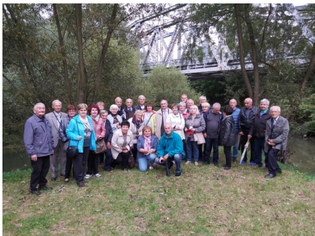
Pamiątkowe wspólne zdjęcie

Ostatnim punktem wycieczki było zwiedzenie Centralnego Muzeum Pożarnictwa w Mysłowicach. Muzeum to przechowuje, gromadzi, dokumentuje oraz eksponuje dorobek i dziedzictwo polskiego pożarnictwa. CMP jest największą tego typu placówką w Polsce i jednym z największych w Europie. Muzealne zbiory liczą ponad 4 tysiące eksponatów. Nowe muzeum wspaniale pomieściło eksponaty zarówno z początku tworzenia się straży, jak powojenne.