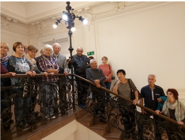
W Pałacu Schoena

Po spotkaniu z „przyrodą” uczestnicy wycieczki udali się do Pałacu Schoena, aby obejrzeć stałą ekspozycję wyrobów powojennych z polskich fabryk szkła, wystawę pt.: „Jan Paweł II - w 20. rocznicę wizyty” i wystawy pt. „Kiedy Brynica i Przemsza łączyły. Sosnowiec i powstanie śląskie - w 100. rocznicę insurekcji”. Po zwiedzaniu, w restauracji „Belweder” mieszczącej się w podziemiach pałacu, odbył się uroczysty obiad z okazji 100-lecia OZW SEP.