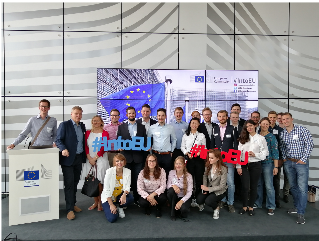
Uczestnicy YES 2019 w siedzibie Komisji Europejskiej