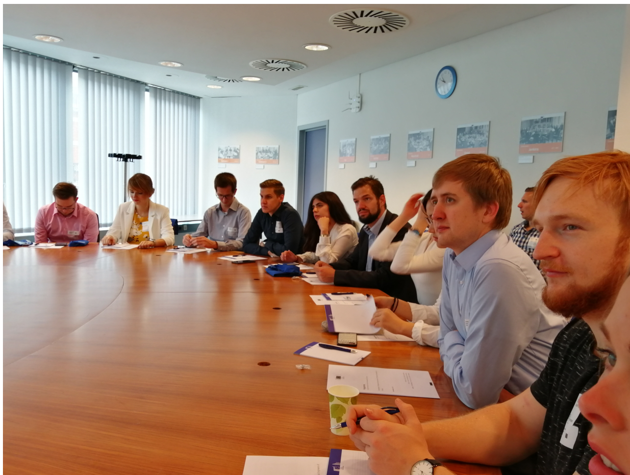
Uczestnicy Seminarium YES 2019 w sali konferencyjnej Komisji Europejskiej