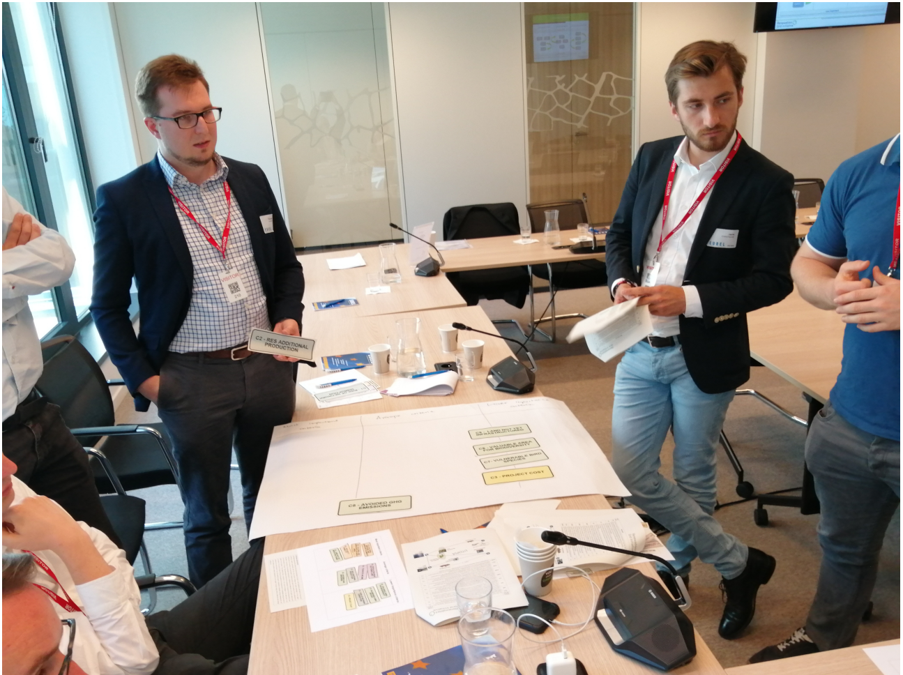
Wypracowywanie decyzji w drodze negocjacji