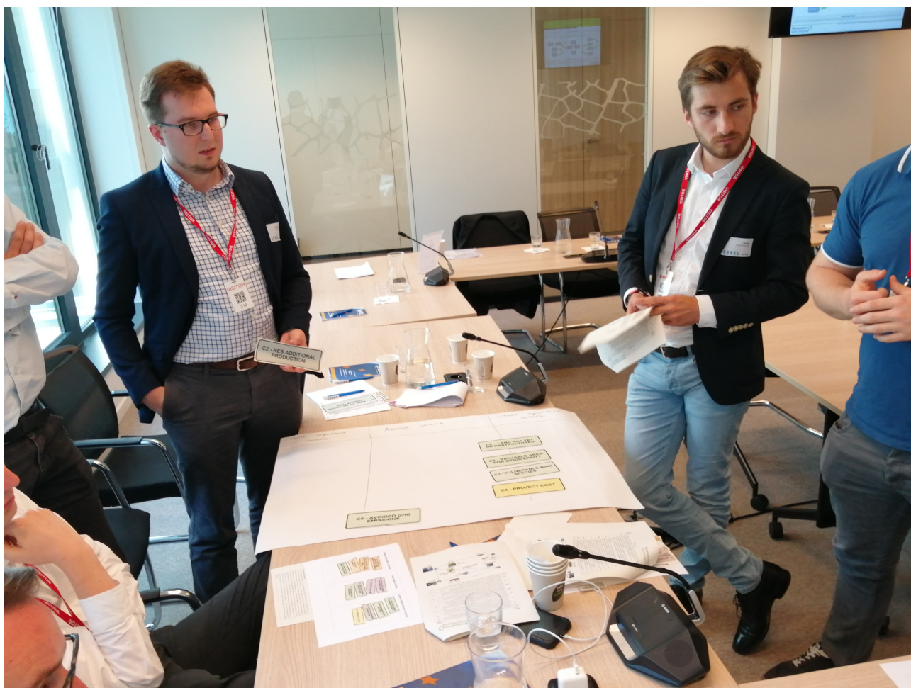
Wypracowywanie decyzji w drodze negocjacji