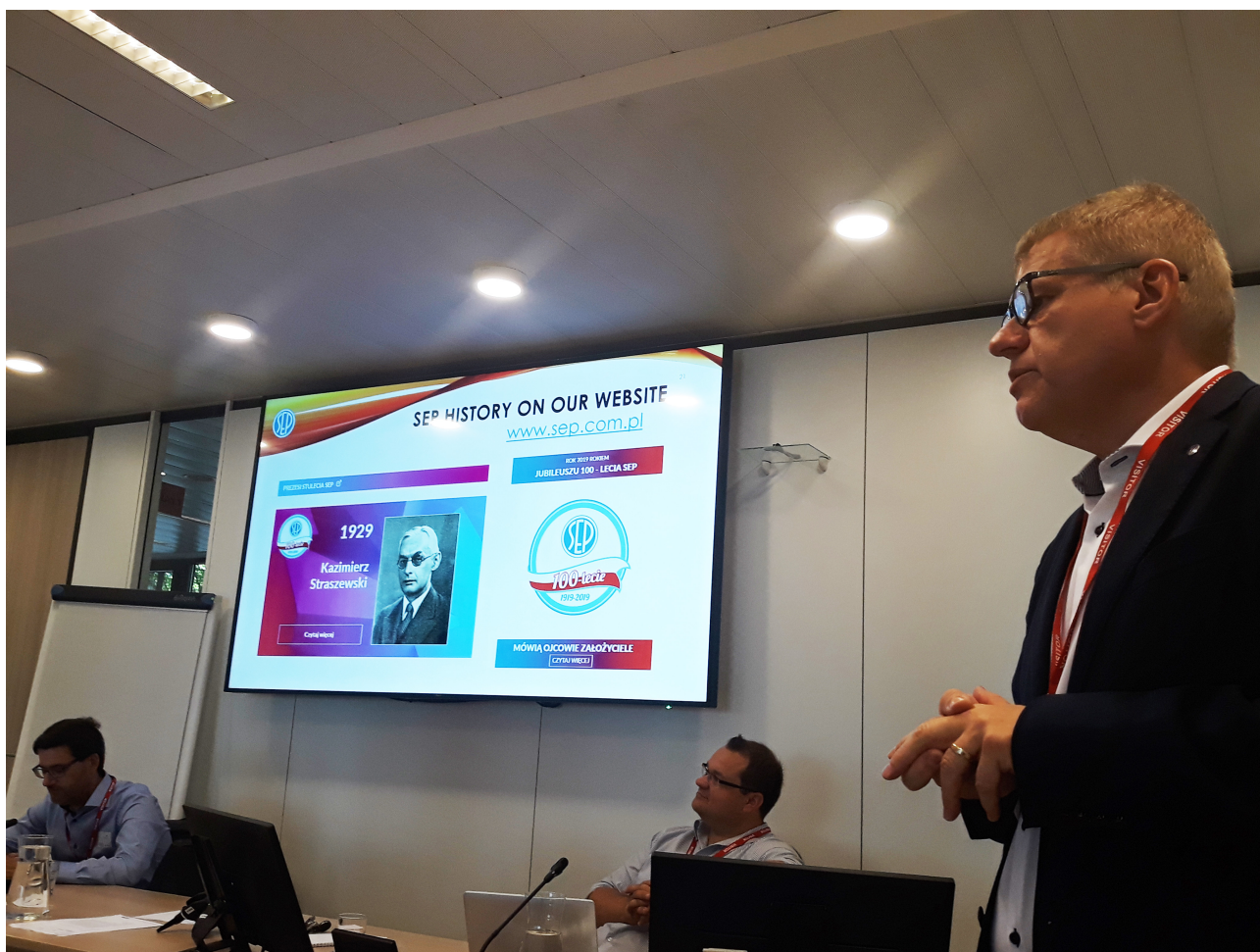
Wykład o historii Stowarzyszenia Elektryków Polskich z okazji Jubileuszu 100-lecia SEP