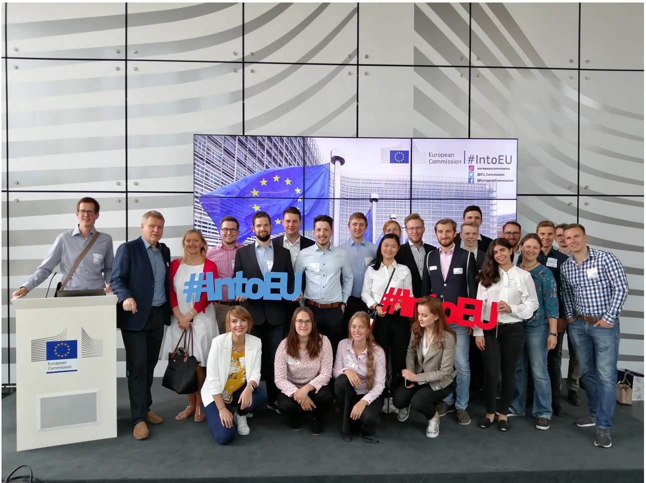
Uczestnicy YES 2019 w siedzibie Komisji Europejskiej