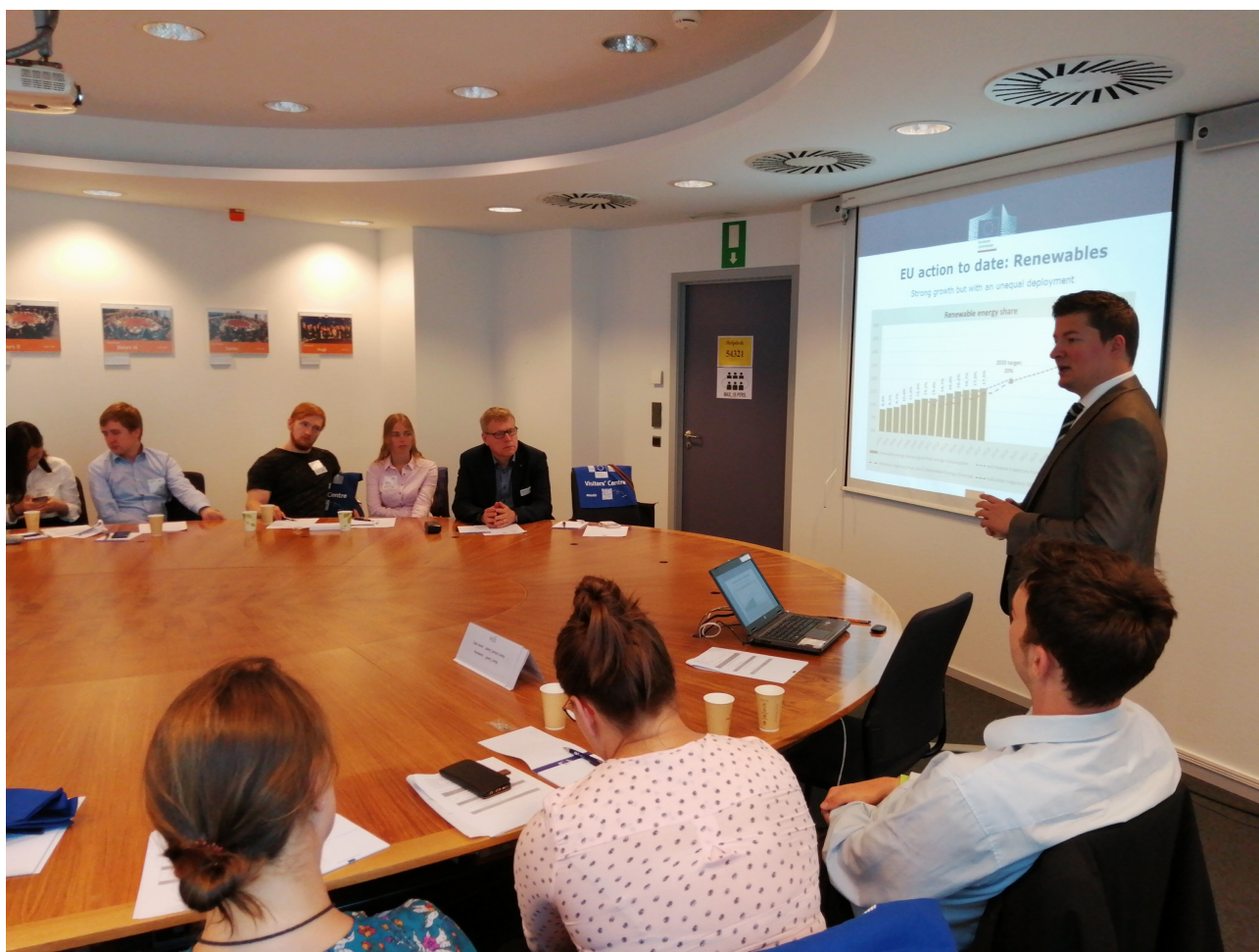
Workshop „Ostatnie zmiany w polityce energetycznej i klimatycznej UE”