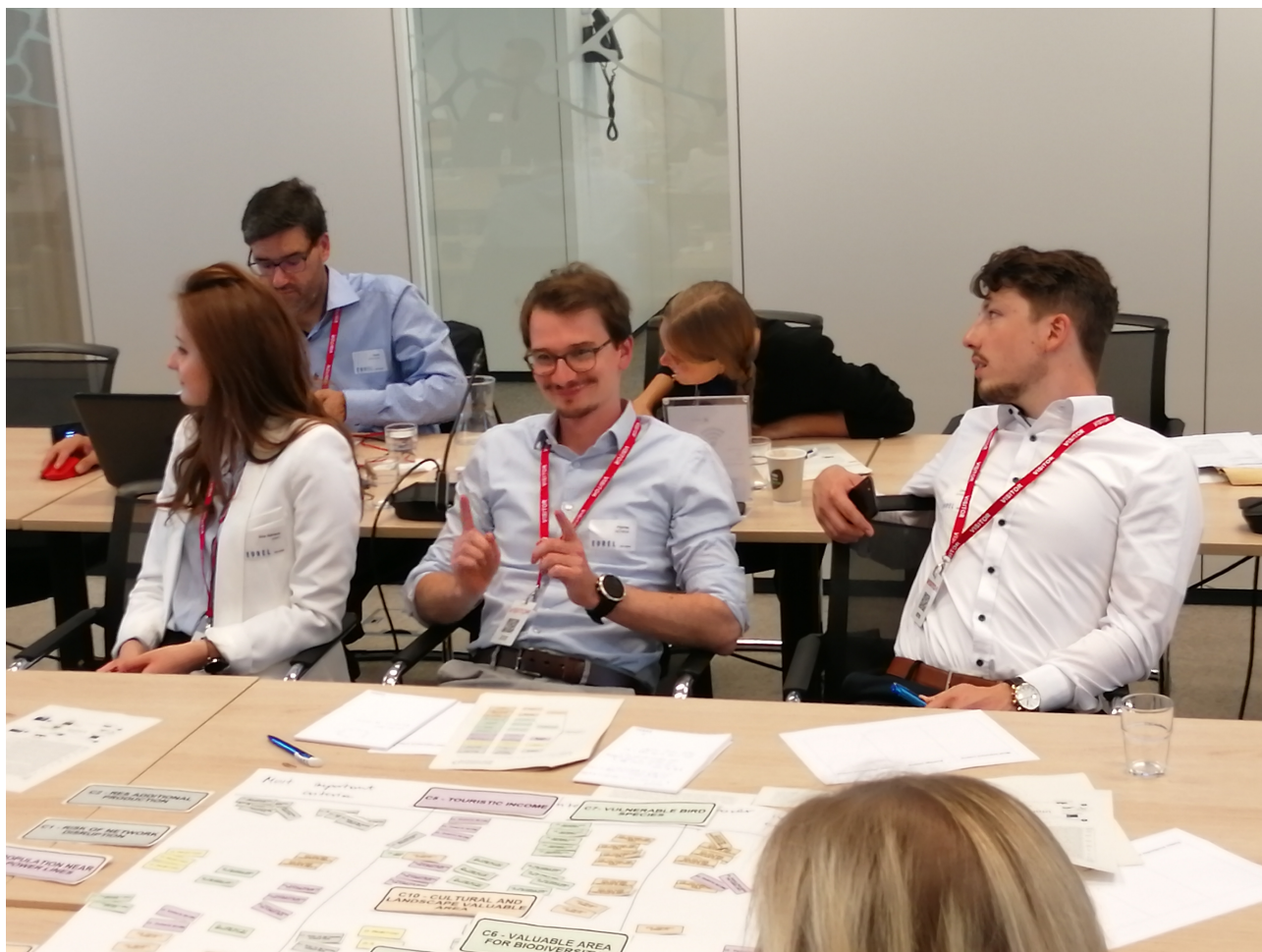
Dyskusja w jednym z trzech zespołów workshopu