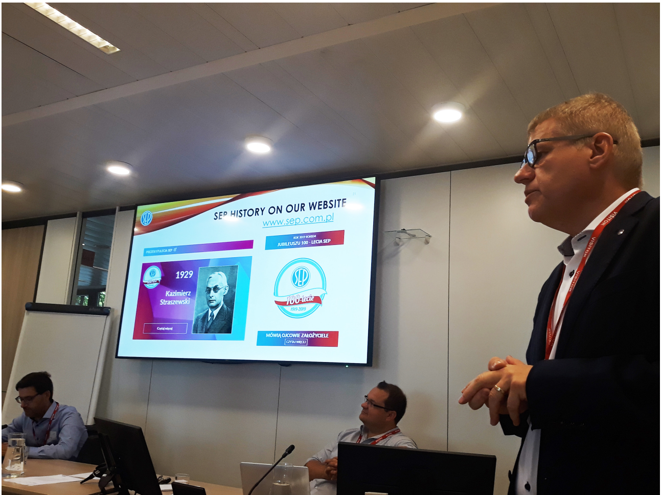
Wykład o historii Stowarzyszenia Elektryków Polskich z okazji Jubileuszu 100-lecia SEP