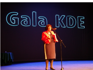
Wystąpienie prezes FSNT NOT Ewy Mańkiewicz-Cudny