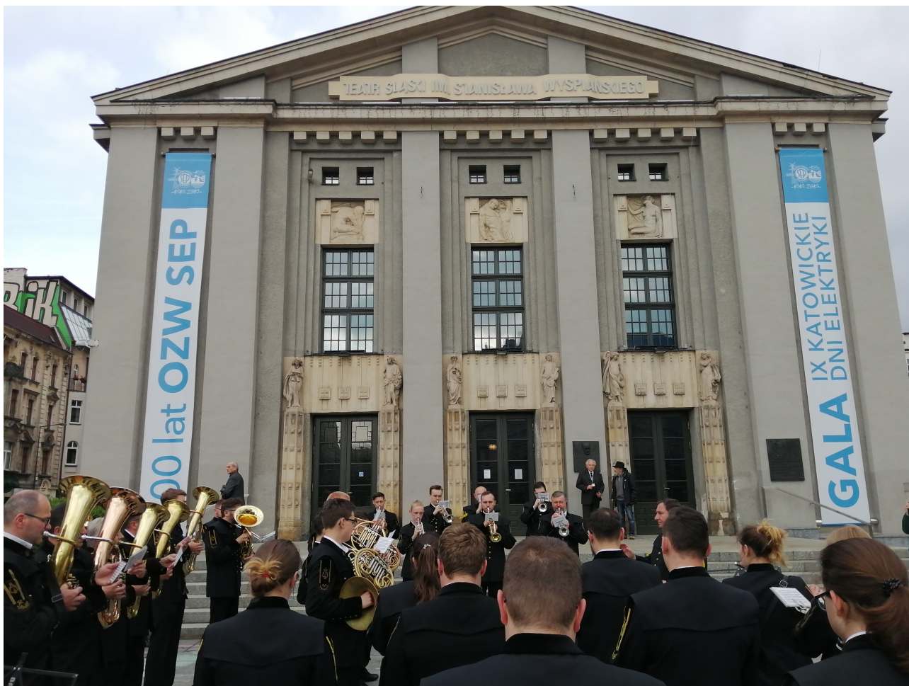
Okolicznościowo udekorowany gmach Teatru Śląskiego im. Stanisława Wyspiańskiego w Katowicach