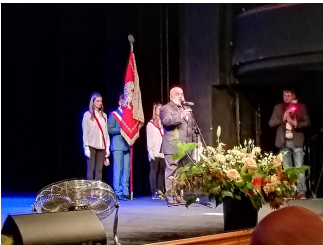
Uroczyste rozpoczęcie Gali Stulecia w Teatrze Śląskim