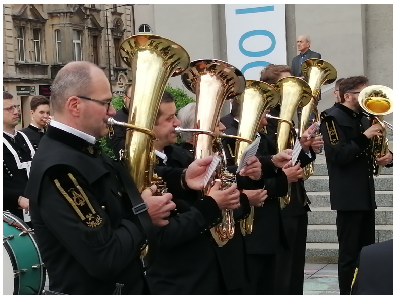
Gra orkiestra górnicza