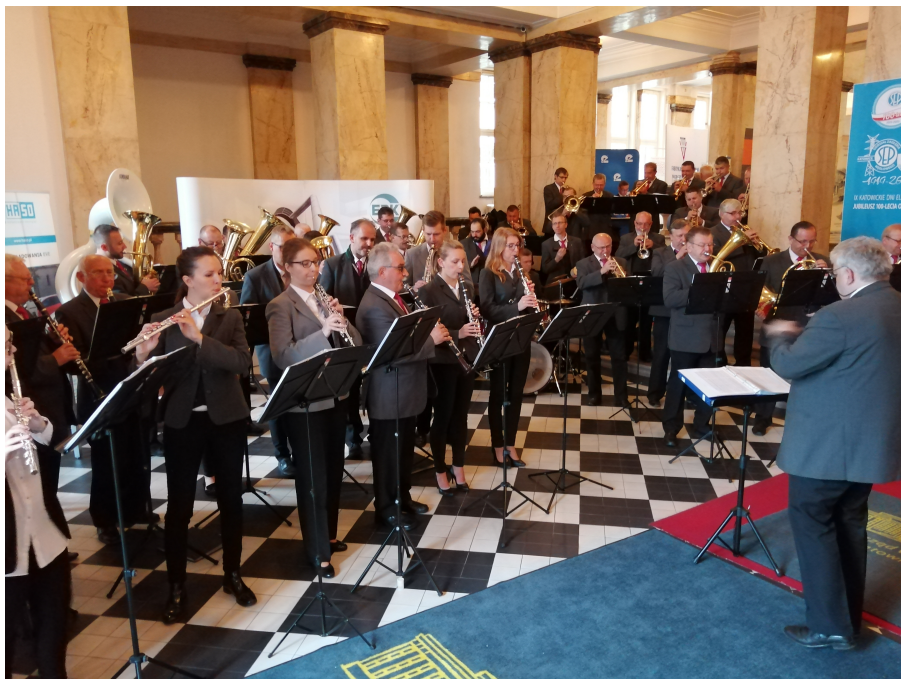
Przybyłych wita orkiestra dęta z Elektrowni Łaziska