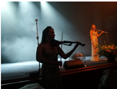
Wspaniały koncert smyczkowy duetu VIOLLIN SiSTAR