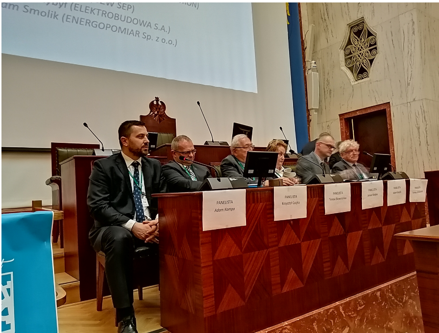
Uczestnicy panelu dyskusyjnego