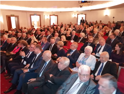
Widownię Teatru Śląskiego zapelnili zaproszeni Goście