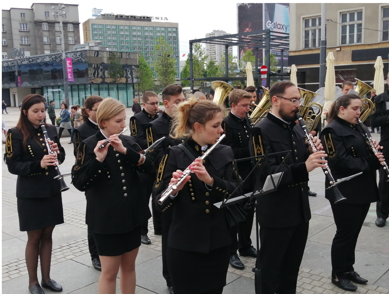
Orkiestra górnicza witała przybyłych na wieczorną galę 100-lecia OZW SEP