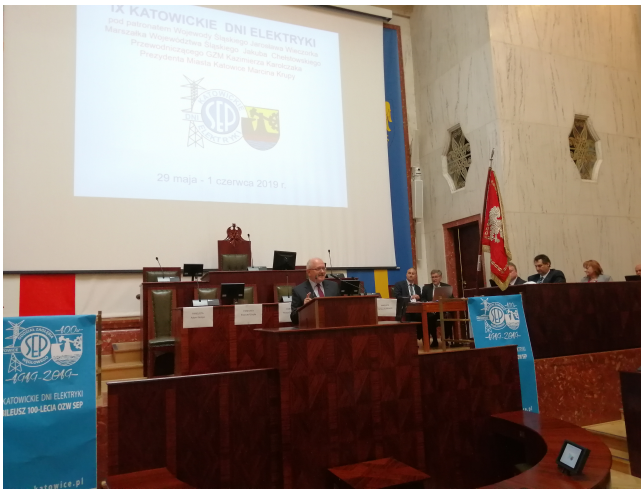
Otwarcie XII Konferencji Naukowo-Technicznej pt. „Bezpieczeństwo w elektryce i energetyce w obliczu wyzwań przemysłu 4.0”