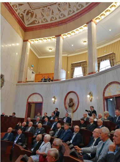
Obrady konferencji w historycznej sali Sejmu Śląskiego