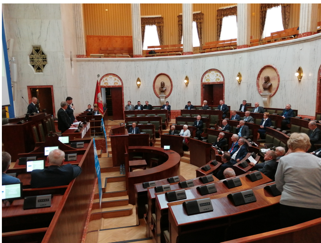
Obrady konferencji w historycznej sali Sejmu Śląskiego