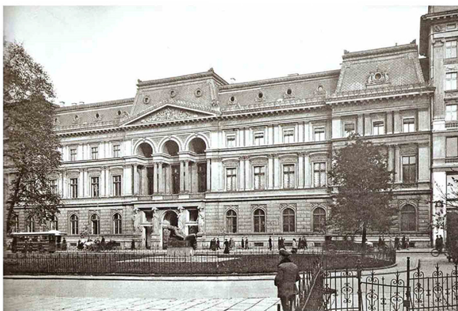
Pałac Kronenberga – przedwojenna siedziba Stowarzyszenia Elektryków Polskich

W 1919 r. wziął udział w Założycielskim Zjeździe SEP jako delegat Magistratu M. Warszawy i został członkiem Komitetu Redakcyjnego „Przeglądu Elektrotechnicznego”. W latach 1930-1935 był posłem do Sejmu RP III. kadencji.