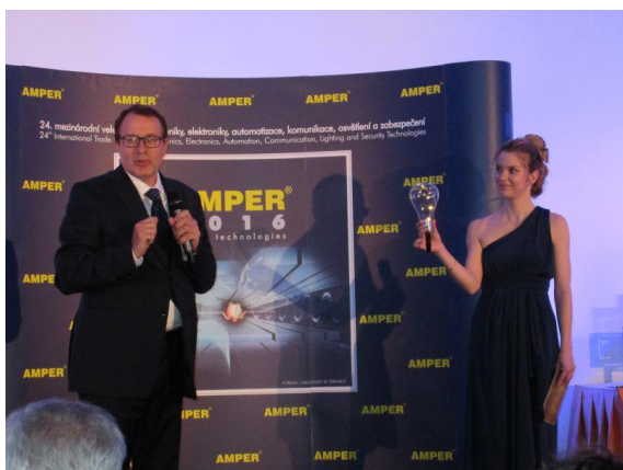
Uroczystość Złotego Ampera

Pierwszego dnia targów, w godzinach wieczornych, wzięliśmy udział w uroczystym ogłoszeniu zwycięzców w konkursie GOLDEN AMPER 2016 - dla najlepszych, innowacyjnych produktów prezentowanych na targach. Ceremonia zgromadziła jak zwykle wybitnych czeskich naukowców i przedstawicieli z branży elektryki. Miłą niespodzianką było wyróżnienie przyznane polskiej firmie ZPUE KORONEA , za wyłącznik liniowy średniego napięcia „Recloser” THO-RC 27.