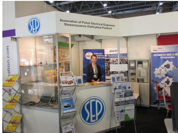
Stoisko SEP - W. Hetmańska – ELKO-BIS