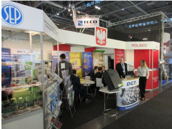
Stoiska SEP i WPHiI Ambasady RP w Pradze

SEP udostępnił swoje stoisko uczestnikom wyjazdu – dla wyłożenia materiałów reklamowych: eksponatów, banerów, katalogów, folderów, płyt CD itp. oraz dla spotkań i przeprowadzania rozmów.