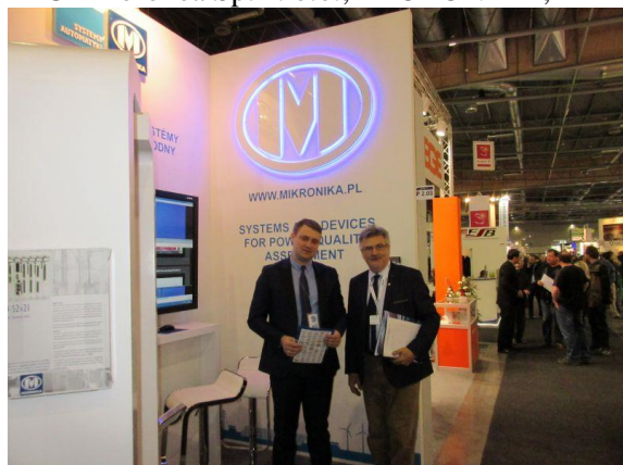
Polskie stoiska na targach – MIKRONIKA

SEP; Wydział Promocji, Handlu i Inwestycji Ambasady RP w Pradze; International Wire Polska Sp. z o.o.; INTROL Sp. z o.o.; LC ELEKTRONIK Leszek Czabak; MICEL Sp. z o.o.; MPL POWER ELEKTRO Sp. z o.o.; MARMAT Sp. z o.o.; TRANSFER MULTISORT ELEKTRONIK Sp. z o.o.; ZPUE Koronea Sp. z o.o.; MIKRONIKA; ZREW TRANSFORMATORY.