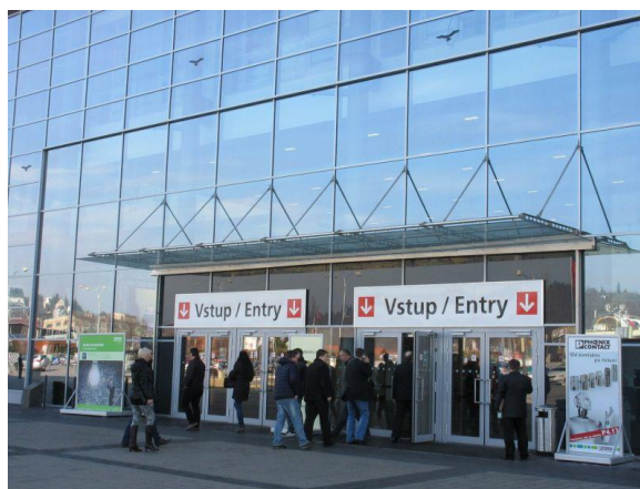
Hale i tereny targowe

Targi AMPER odbywają się w pięknie położonym, imponującym kompleksie wystawienniczym Vystaviste, który powstał w 1928 roku. Jest to jeden z najpiękniejszych tego typu obiektów w Europie. Ekspozycje targów AMPER 2016 były prezentowane w trzech halach wystawienniczych: P, F i V oraz na zewnątrz. Nomenklatura targów obejmowała wszystkie kluczowe gałęzie elektryki, od elektroniki po techniki komunikacyjne i technologie bezpieczeństwa.