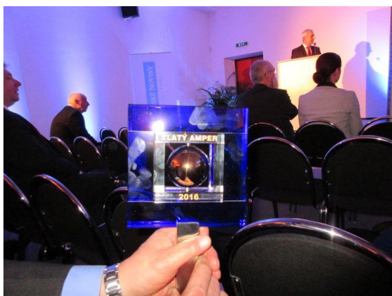
Statuetka Złotego AMPERA