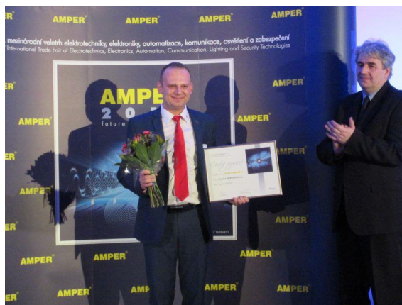
Przedstawiciel polskiej firmy ZPUE S.A. Koronea odbierający wyróżnienie

W środę 16 marca, po targach spotkaliśmy się wieczorem w kultowej restauracji Starobrn Pivovar , na wspólnej kolacji, która miała charakter integracyjny. W miłej i wesołej atmosferze smakowaliśmy potraw tradycyjnej czeskiej kuchni i oczywiście słynnego czeskiego piwa.