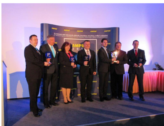
Zdobywcy nagród Złotego AMPERA