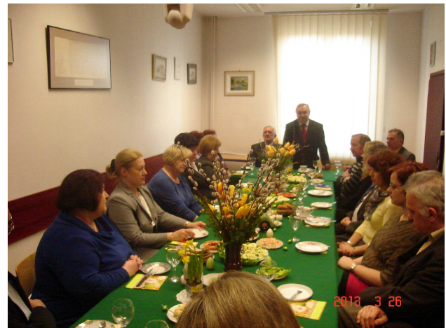
Fot. 3. Spotkanie w Biurze SEP.

W dniu 26 marca 2013 r. odbyło się spotkanie prezesa SEP i sekretarza generalnego SEP z pracownikami Biura SEP i COSiW. Spotkanie było okazją do złożenia życzeń świątecznych.