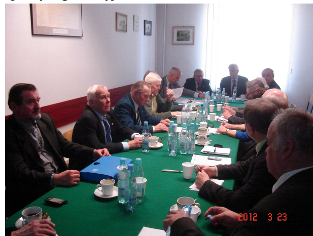
Fot. 3. Zebranie Sekcji.

W piątek 23 marca 2012 r. w sali posiedzeń ZG SEP w Biurze SEP odbyło się zebranie Centralnego Kolegium Sekcji Energetyki SEP. Omówiono bieżące sprawy organizacyjne.