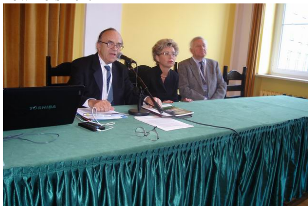
Fot. 5 II Szkoła Energetyki Jądrowej w środku minister Hanna Trojanowska fot. Stanisław Szalapak